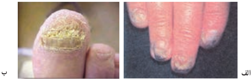
شکل ۳-۸- ضایعه قارچی ناخن (کچلی ناخن)

کچلی ناخن : این نوع کچلی با التهاب و قرمزی ناخن و تغییر شکل آن مشاهده می‌گردد (شکل ۳-۸).