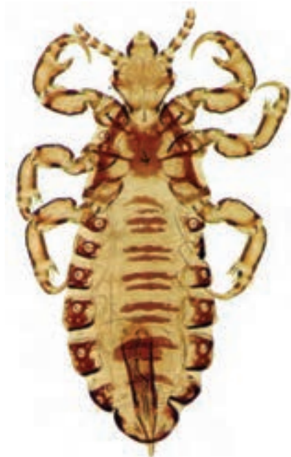
شکل ۵-۸- شپش موی سر

بیماری است که به علت آلودگی پوست و موی سر با این حشره، در مناطق پر جمعیت که سطح بهداشت فردی و اجتماعی پایین است مشاهده می‌گردد. لذا این بیماری در مواقع جنگ و بی‌خانمانی شیوع بیشتری پیدا می‌کند (شکل ۵-۸).