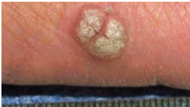
شکل ۸-۸- زگیل معمولی

بیماری ویروسی مزمنی است که در سنین خردسالی شایع است. بیماری به صورت دانه‌های برجسته به رنگ پوست با سطح خشن و یا صاف می‌باشد. این ضایعات در پشت دست‌ها و صورت، بیشتر از سایر نقاط بدن مشاهده می‌گردد (شکل ۸-۸).