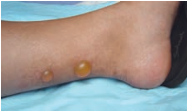
شکل ۹-۸- ضایعات ناشی از گزش حشرات

این بیماری در سنین خردسالی در فصول فعالیت حشرات یعنی بهار و تابستان در اثر گزش حشرات دیده می‌شود. ضایعات به شکل دانه‌های قرمز خارش دار و برجسته بر روی قسمت‌های باز بدن به خصوص دست‌ها و پاها، شکم و کمر و صورت بروز می‌کند. گاهی ضایعات به شکل تاولی مشاهده می‌شود (شکل ۹-۸). درمان گزش شامل استفاده از داروهای ضد خارش موضعی است.