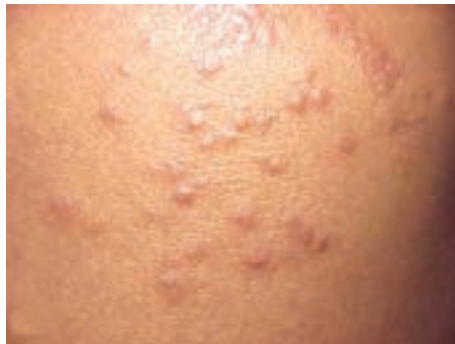
شکل ۷-۸- گال یا جرب

و ناحیه تناسلی به وجود می‌آیند. حرکت انگل در پوست سبب انتشار بیماری می‌گردد (شکل ۷-۸). خارش بدن به هنگام شب بیشتر است.