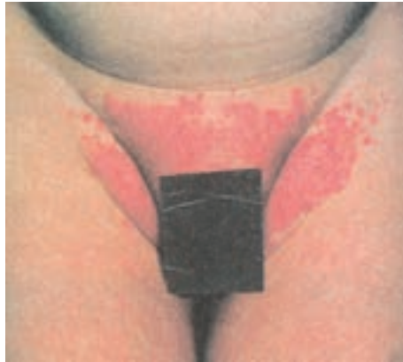
شکل ۱۳-۸- اگزمای ناشی از قارچ کاندیدا

این بیماری در سنین شیرخوارگی به علت تحریک پوست بر اثر تماس طولانی با ادرار و یا مدفوع به وجود می‌آید. عدم تعویض به موقع کهنه و یا پوشک، سبب تشدید عارضه می‌گردد. این بیماری به صورت قرمزی ناحیه تناسلی بروز می‌کند و در صورت طولانی شدن ممکن است در چین‌های منطقه قارچ کاندیدا اضافه شود که با بروز دانه‌های به ظاهر چرکی، در اطراف ضایعه اصلی و چین‌ها مشخص می‌گردد (شکل ۱۳-۸).