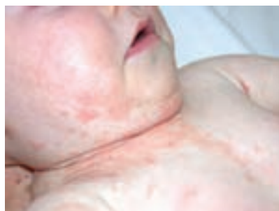
شکل ۱۲-۹- اگزمای شیرخوارگی در یک کودک