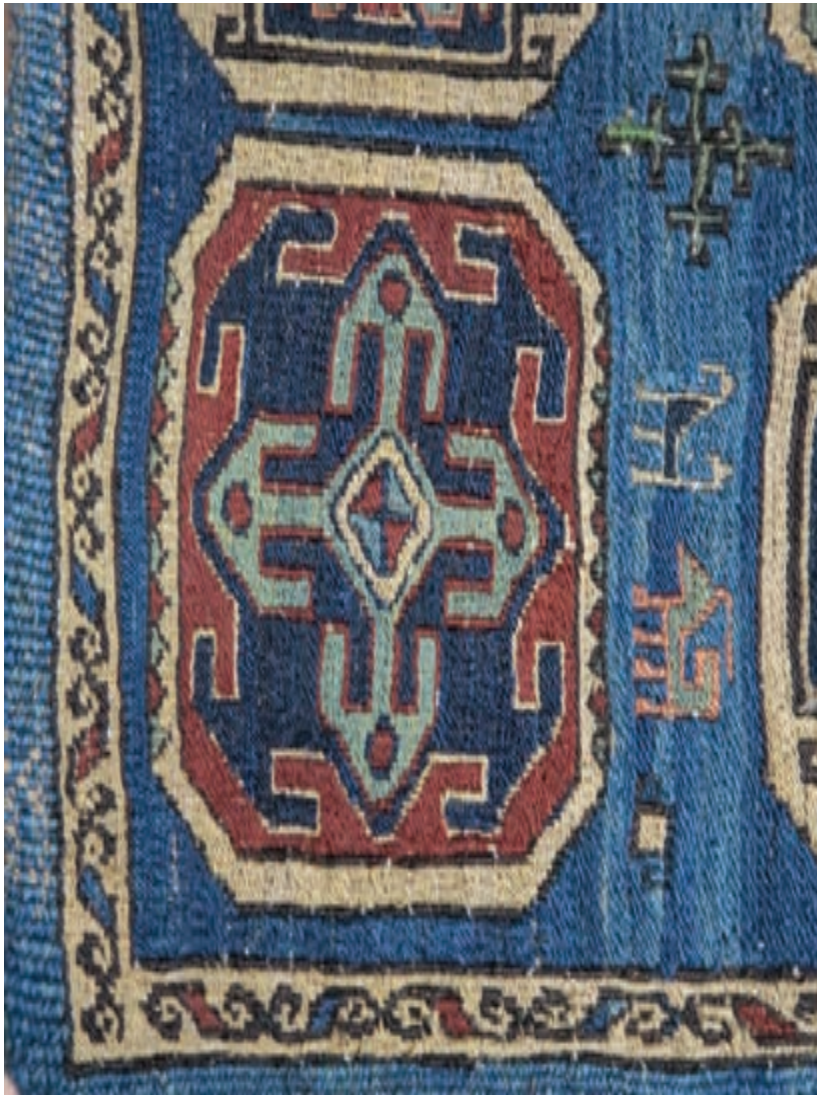
بخشی از یک گلیم ورنی با شیرازه حصیری | تصویر ۴-۵ ▲