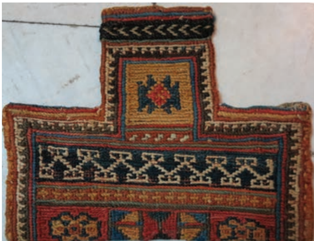
▲ یک نمونه گلیم ورنی قدیمی | تصویر ۳-۵

۴- بر اساس نقشه کنار سمت راست بافت پس از رج پودگذاری سراسری با پود رنگی (لور) بافته می‌شود.