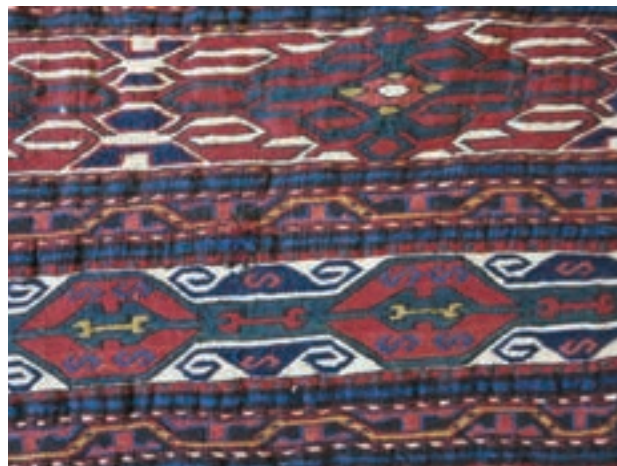
روی یک گلیم ورنی | تصویر ۶-۵ ▲