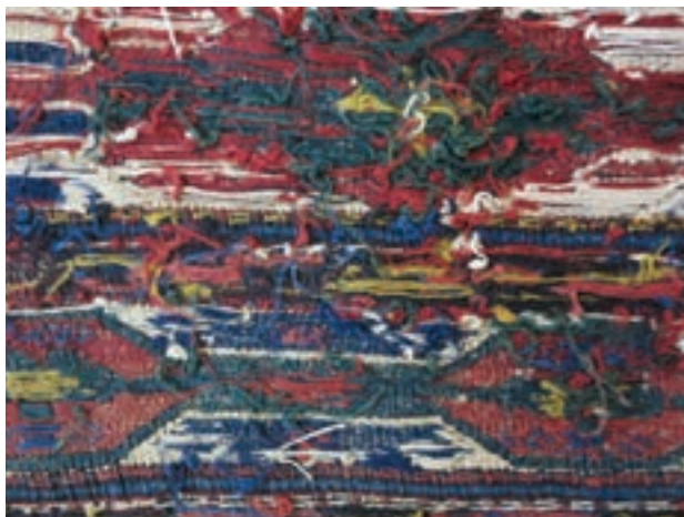
پشت یک گلیم ورنی | تصویر ۷-۵ ▲

چند نوع گلیم ورنی وجود دارد؟ در منطقه خود جست و جو کنید و انواع گلیم های ورنی را بیابید. از آن ها عکس گرفته و بررسی کنید تفاوت آنها در چیست؟ سپس از آنها گزارش تهیه کرده و به کلاس بیاورید.