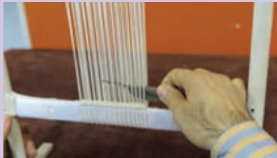
روش های اشتباه در دست گرفتن قلاب و حرکت آن