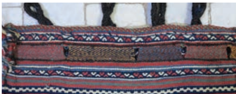
نمونه یک سربندی تلفیقی | تصویر ۱-۵ ▲

مراحل اول) چله کشی: چله کشی گلیم ورنی مانند دیگر گلیم ها انجام می شود که در فصل اول بطور کامل آن را آموخته اید. البته سیه بندی گلیم ورنی با سایر گلیمها متفاوت بوده و مشابه قالی است. در گلیم ورنی همانند قالی هر جفت تار برابر با یک خانه ی نقشه (شطرنجی) است. مرحله دوم) سربندی تلفیقی: پس از مرحله چله کشی نوبت