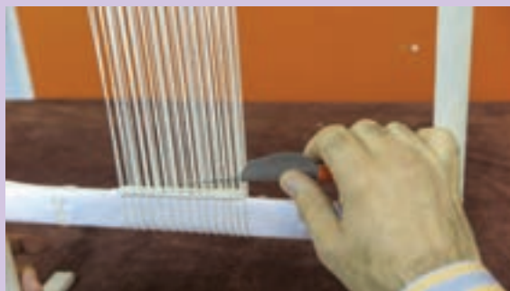
روش های صحیح در دست گرفتن قلاب و حرکت آن