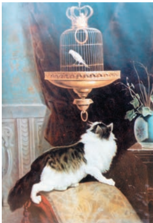
تصویر ۱-۵۲- قفس قناری و گربه - اثر کمال‌الملک، رنگ روغن روی بوم، مکتب تهران، قرن سیزدهم هجری

پس از آن نخستین نمایشگاه نقاشی ایران به دستور ناصرالدین شاه با تعدادی تابلو و مقداری عکس چاپ شده از آثار نقاشان اروپایی برپا گردید. در این زمان محمد غفاری که در مدرسه‌ی دارالفنون تحصیل می‌کرد به دربار شاه راه یافت و بعدها لقب کمال‌الملک گرفت. وی شدیداً تحت تأثیر نقاشان اروپایی بود. در این زمان، با کنار گذاشتن عناصر نقاشی ایرانی، ویژگی‌های نقاشی کلاسیک اروپایی عیناً به جای نقاشی ایرانی نشست (تصویر ۱-۵۲).