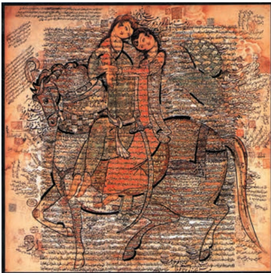
تصویر ۱-۵۶- زوج، صادق تبریزی، آبرنگ روی کاغذ، دوره معاصر، مجموعه خصوصی

تهران کار می کردند. کسانی مانند حاج میرزا آقا امامی، حاج مصور الملکی، حسین بهزاد، هادی تجویدی و ... از این گروه اند (تصاویر ۱-۵۷ و ۱-۵۸ و ۱-۵۹).