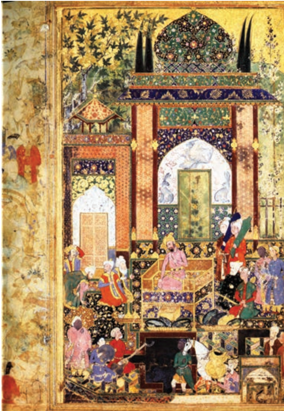
تصویر ۳۰-۱- بابرشاه بر تخت، بابرنامه، اثر فرخ‌بیگ، قرن دهم هجری، واشنگتن

در دوران سلطنت شاه طهماسب، همایون پادشاه هند از سلطنت خلع شد و برای دریافت کمک به دربار ایران پناهنده گردید. او وقتی که از تبریز دیدن کرد و در دربار پادشاه با کار هنرمندان ایرانی آشنایی یافت پس از بازگشت به سلطنت در هند با اجازه‌ی شاه طهماسب دو هنرمند عصر، یعنی عبدالصمد و میرسیدعلی، شاگردان بهزاد را با خود به هند برد. عبدالصمد که