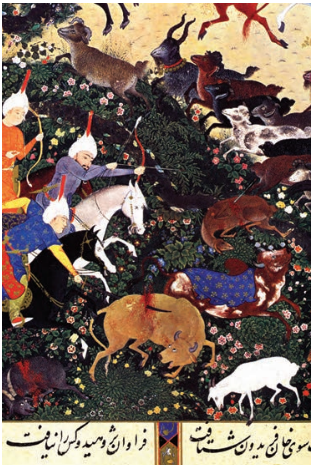
تصویر ۲۹-۱- کشتار حیوانات اهلی به دست ضحاک (بخشی از اثر)، شاهنامه شاه طهماسب، اثر سلطان محمد، قرن دهم هجری موزه هنرهای معاصر تهران

یکی از آثار معروف این دوره شاهنامه‌ای بود که به شاهنامه‌ی شاه طهماسب معروف گردید. این اثر، دارای دویست و پنجاه و هشت تصویر به شیوه‌ی مکتب تبریز از آثار سلطان محمد، میرک نقاش، میرسیدعلی و... است که در دوران ریاست بهزاد و پس از آن در تبریز اجرا شده است. این شاهنامه که بعدها به دست دلان