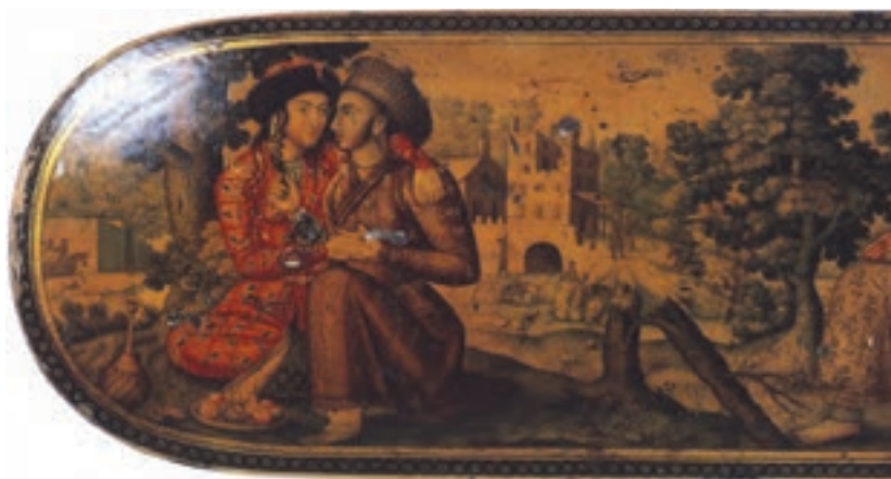
تصویر ۱-۴۲- قلمدان، نقاشی لاک‌روغنی، مکتب اصفهان، قرن یازدهم، مجموعه خصوصی، لندن

اصفهان» خوانده‌اند. این هنرمندان عبارتند از: شفیع عباسی، محمدزمان، علی‌قلی بیک جبه‌دار، ... (تصویر ۱-۴۳).