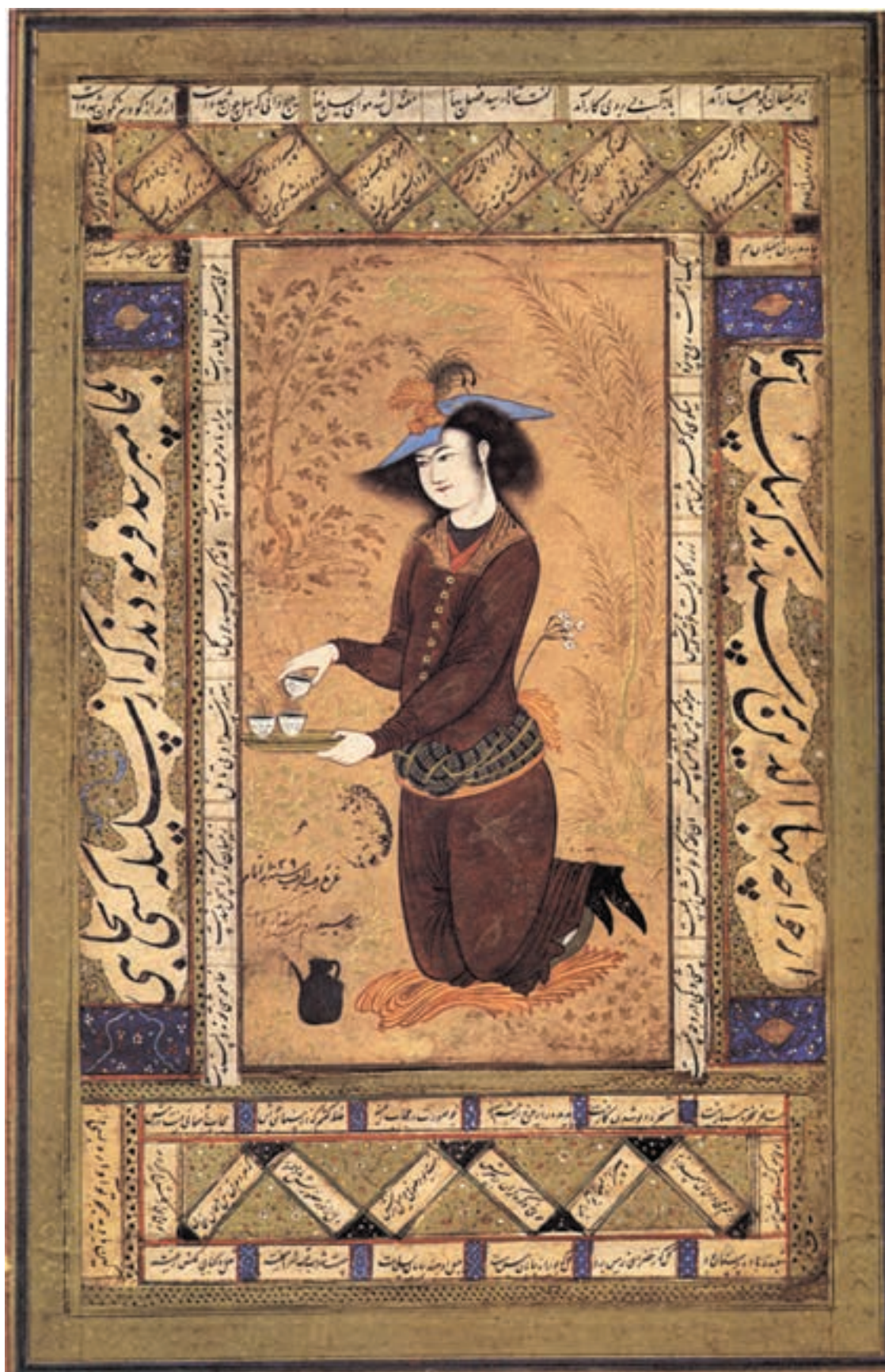
تصویر ۳۷-۱- ساقی، اثر رضا عباسی، مکتب اصفهان، قرن یازدهم هجری، موزه رضاعباسی، تهران