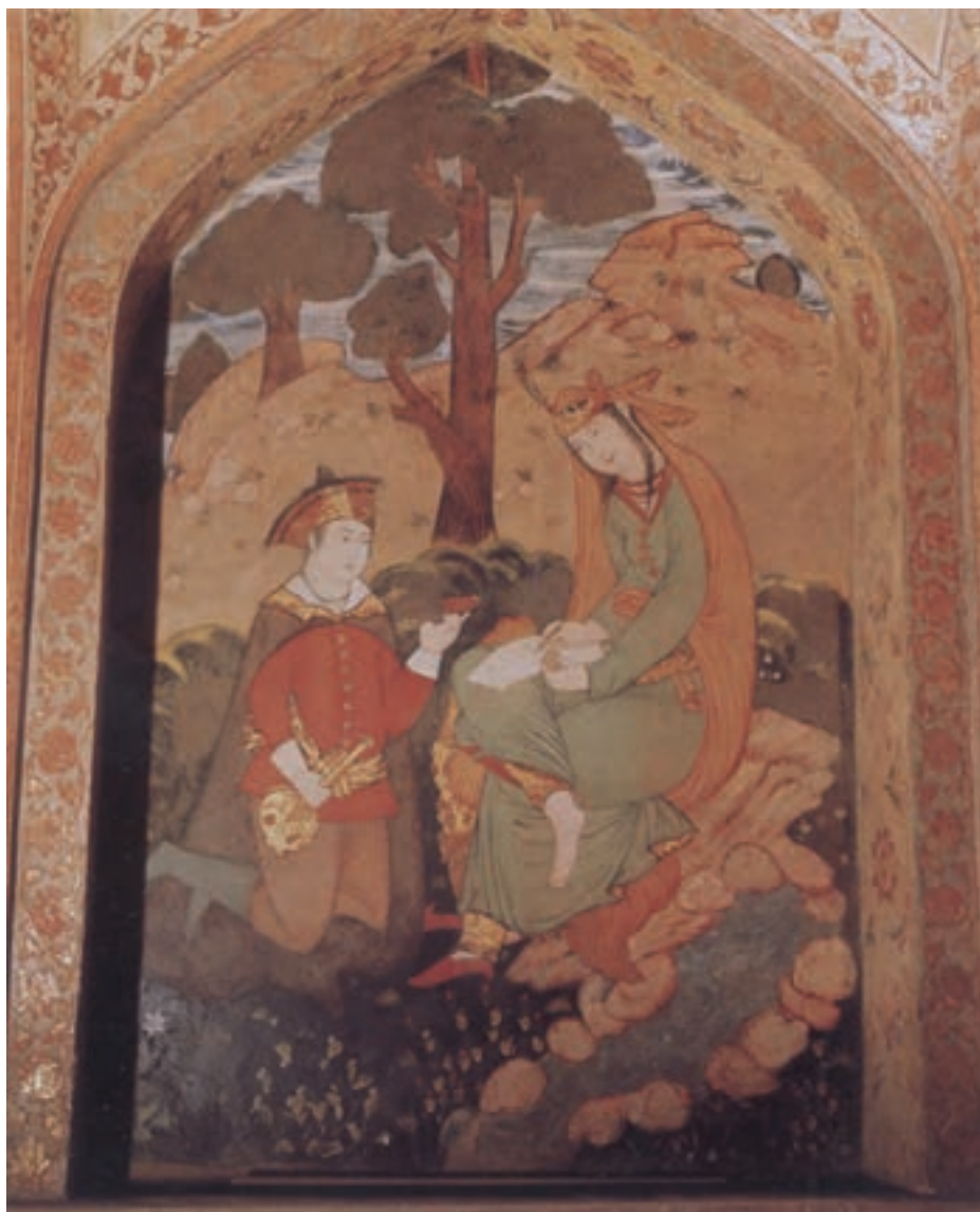
تصویر ۱-۳۵- در باغ، نقاشی دیواری، مکتب اصفهان، قرن یازدهم هجری، کاخ چهلستون اصفهان

باختگی اینان در مقابل غرب، در تمام کشور و بین تمام اقشار جامعه رخنه کرد. از همین جا غربی شدن تدریجی تکنیک نقاشی ایرانی و تأثیرپذیری آن از موضوعات نقاشی اروپایی آغاز گردید. در این دوره به علت علاقه‌ی شخصی شاه عباس به بناسازی به تقلید از شاه‌جهان در هند، نقاشی دیواری بیش از کتاب آرایه مورد توجه قرار گرفت. به همین دلیل هنر کتاب آرایه تا حدود بسیار زیادی محدود گردید و هنرهای وابسته به آن کم از یاد رفت و برعکس، هنرهای وابسته به معماری افزایش یافت. نمونه نقاشی‌های دیواری این دوره را در عمارت‌های مجلل اصفهان مانند کاخ عالی قاپو، کاخ چهلستون، سر در بازار قیصریه، کاخ هشت بهشت، و... می‌توان دید (تصاویر ۱-۳۵ و ۱-۳۶).