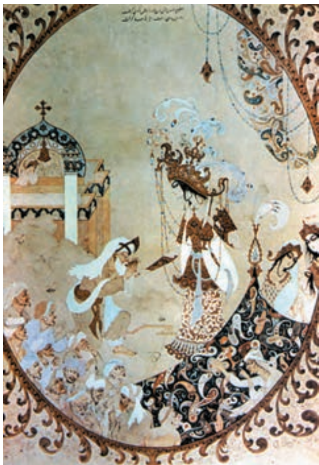
تصویر ۱-۵۸- شیخ صنعان و دختر ترسا، آبرنگ و گواش، حاج مصورالملکی، مکتب تهران، قرن چهاردهم، موزه هنرهای ملی تهران