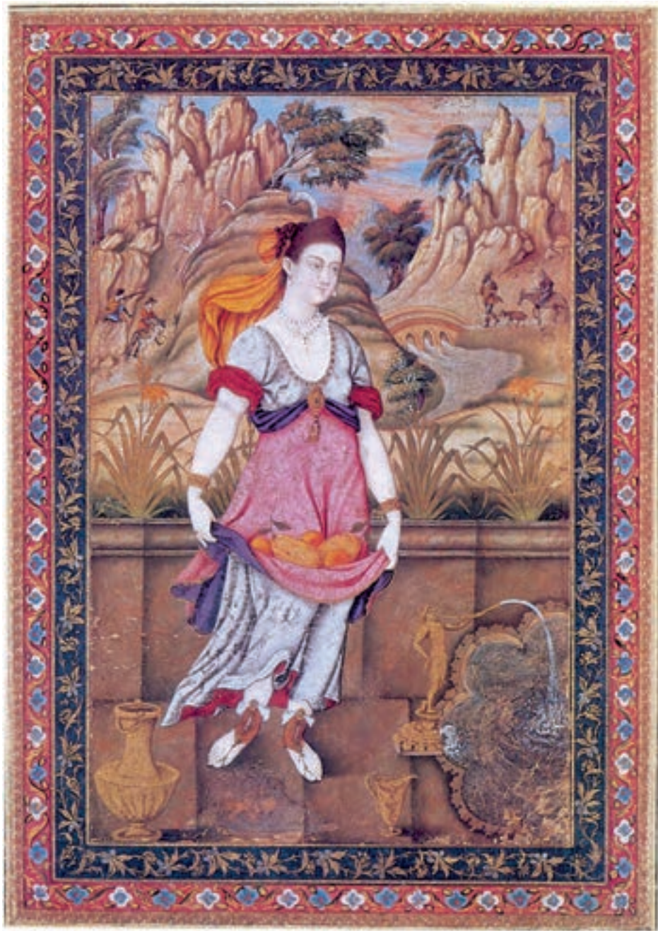
تصویر ۴۳-۱- زن ایستاده در کنار فواره، اثر علی قلی بیگ جبّدار، مکتب ایتالیا اصفهان، اواخر قرن یازدهم هجری، مجموعه خصوصی