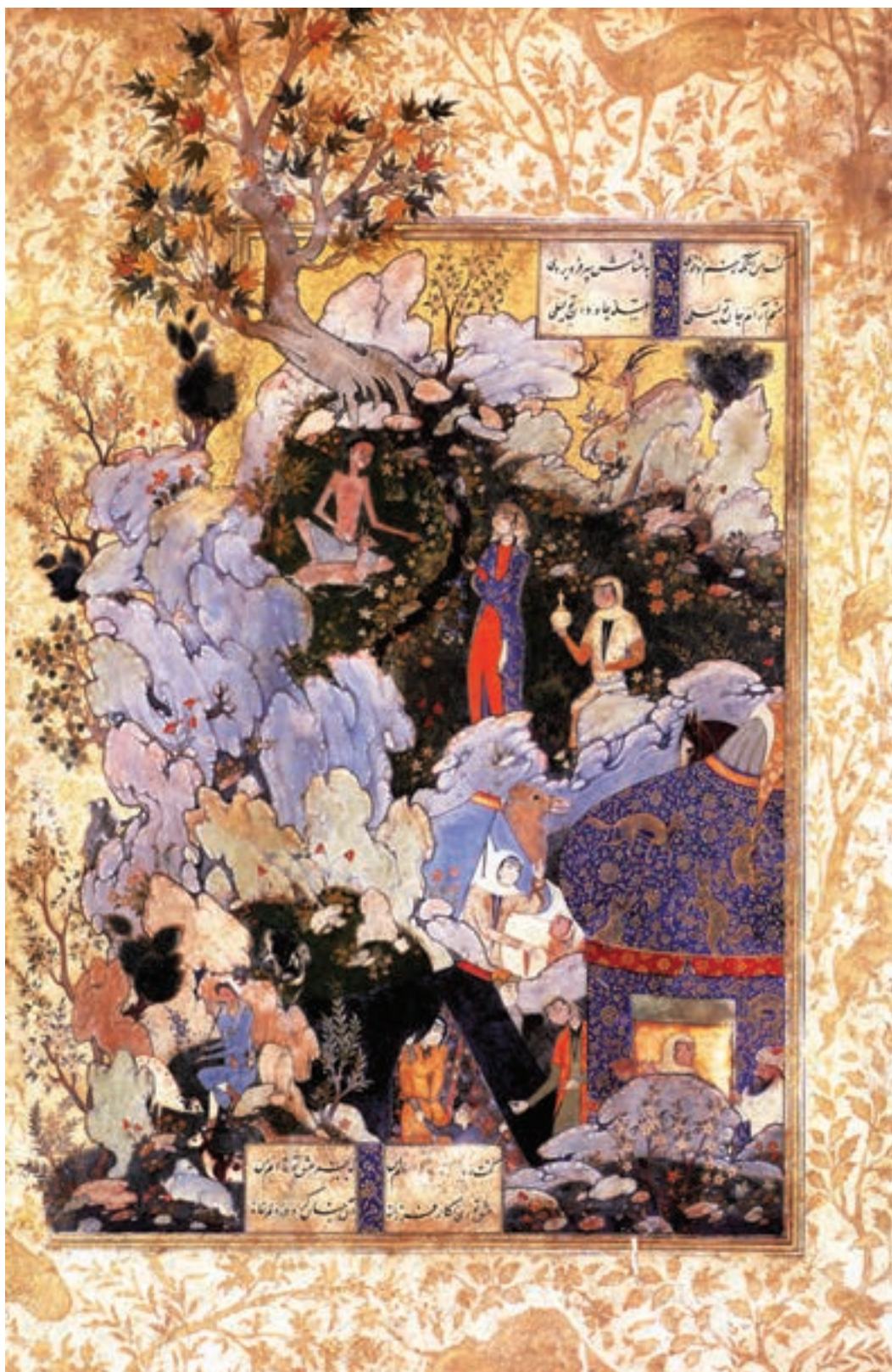
تصویر ۳۹-۱- عشق مجنون، کتاب سلسله‌الذهب، اثر محمدی، قرن دهم هجری

۲- گرایش دوم: مناظر طبیعی روستایی، مناظری از زندگی شبان‌ها و زنان روستایی در حین کار، نوازندگان نی، ریسندگان و