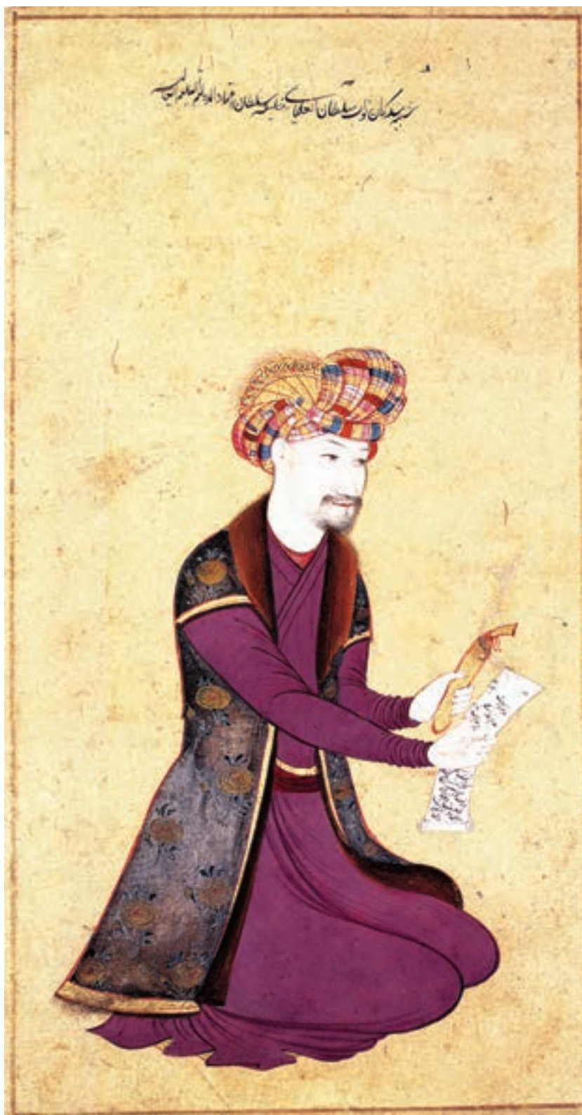
تصویر ۴۰-۱- وزیر خلیفه سلطان، اثر معین مصور (شاگرد رضا عباسی)، مکتب اصفهان، قرن یازدهم هجری

۳- گرایش سوم: توجه به چهره‌نگاری است که اغلب از سوی شاهزادگان، بزرگان، و درباریان به هنرمندان سفارش داده