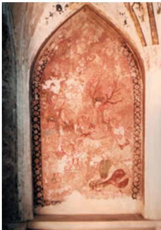
تصویر ۱-۳۲- بزم، نقاشی دیواری، مکتب قزوین، قرن دهم هجری، کاخ چهلستون قزوین