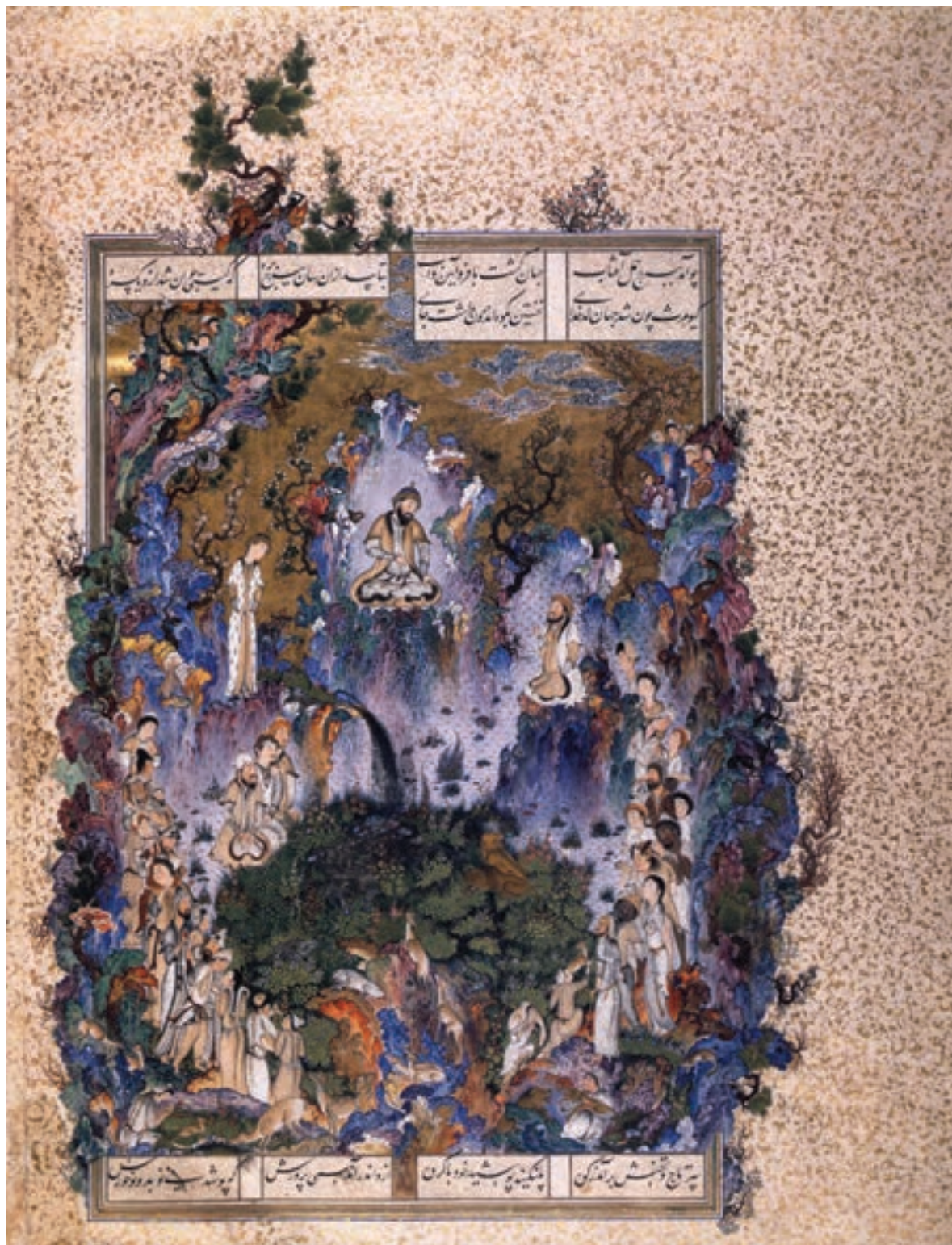
تصویر ۳۸-۱- بارگاه کیومرث اولین شاه، شاهنامه شاه طهماسب، اثر سلطان محمد، مکتب تبریز در دوره دوم، قرن دهم هجری، مجموعه خصوصی، ژنو

نگارگری عهد صفوی شامل سه مکتب (تبریز در دوره دوم، قزوین و اصفهان) و پنج گرایش می‌باشد که عبارتند از: ۱- گرایش اول: نقاشی عهد صفوی شامل مناظر درباری