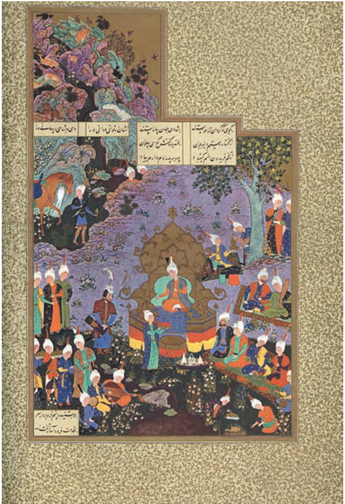
تصویر ۲۸-۱- رستم در دربار کیقباد، اثر آقامیرک، خمسه نظامی، قرن دهم هجری، موزه بریتانیا