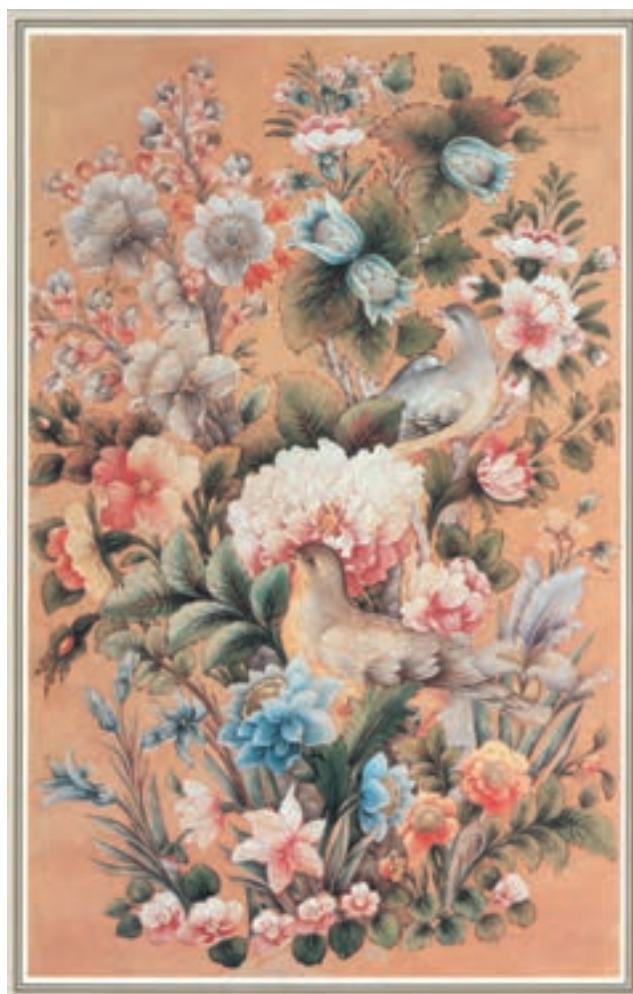
تصویر ۱-۵۷- گل و مرغ، شیوه پرداز، اثر حاج میرزا آقا امامی، مکتب تهران، قرن چهاردهم، موزه هنرهای ملی تهران