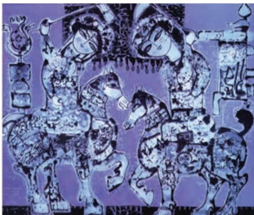
تصویر ۱-۵۵- چوگان، اثر ناصر اویسی، رنگ و روغن روی بوم، دوره معاصر، تهران

۲- گروه دوم: شامل کسانی‌ست که تحت تأثیر هنرهای سنتی ایران و پیروی از تکنیک و اصول نقاشی کلاسیک و یا مدرن غرب، دست به تلفیق و نوآوری زده‌اند مانند جلیل