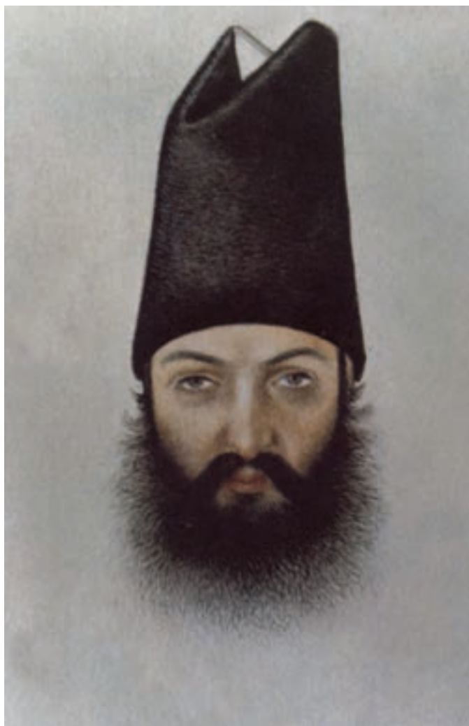
تصویر ۴۸-۱- خسروخان کرمانی، شیوه پرداز، اثر ابوالحسن غفاری (صنیع الملک) مکتب تهران، قرن سیزدهم هجری، کتابخانه بریتانیا

علاوه بر نقاشی دیواری و نقاشی روی بوم در این دوره نوعی نقاشی آبرنگ بر روی کاغذ نیز رواج پیدا کرد که بیش تر