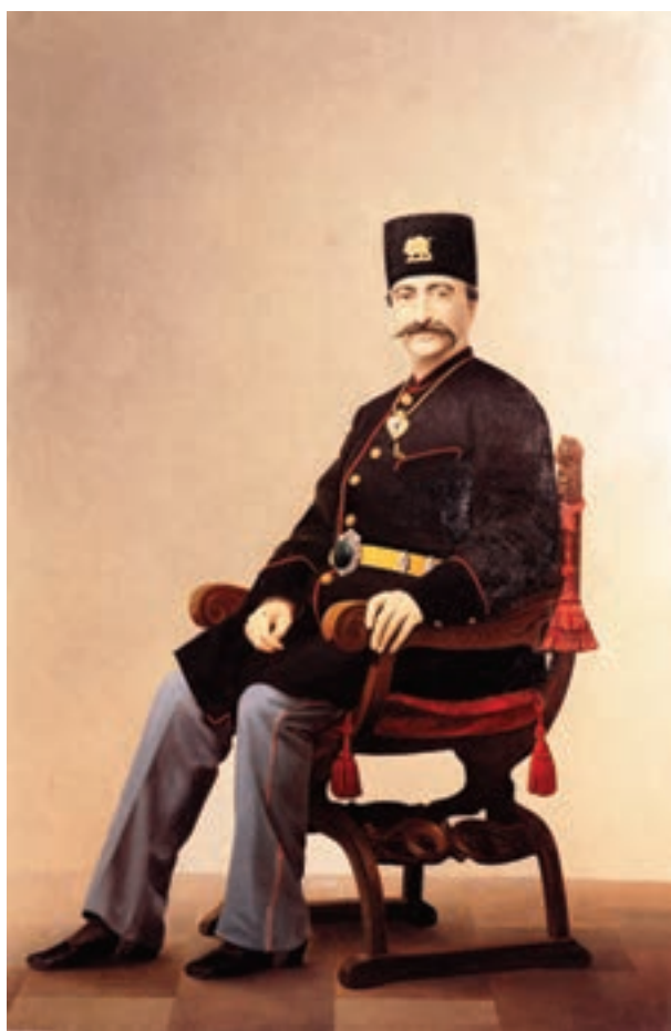
تصویر ۱-۵۳- چهره‌ی ناصرالدین شاه، اثر کمال‌الملک، مکتب تهران، اوایل قرن چهاردهم هجری، موزه هنرهای معاصر

پس از انقلاب مشروطه، تحولی در نقاشی ایران ایجاد گردید. که می‌توان آن را در این دوره به سه گروه تقسیم کرد: ۱- گروه اول: شامل کمال‌الملک، اسماعیل آشتیانی، علی محمد حیدریان و کسانی است که به روش او و کاملاً با استفاده از نقاشی کلاسیک اروپا بدون توجه به اصول و روش نقاشی ایرانی، نقاشی می‌کردند (تصاویر ۱-۵۳ و ۱-۵۴).