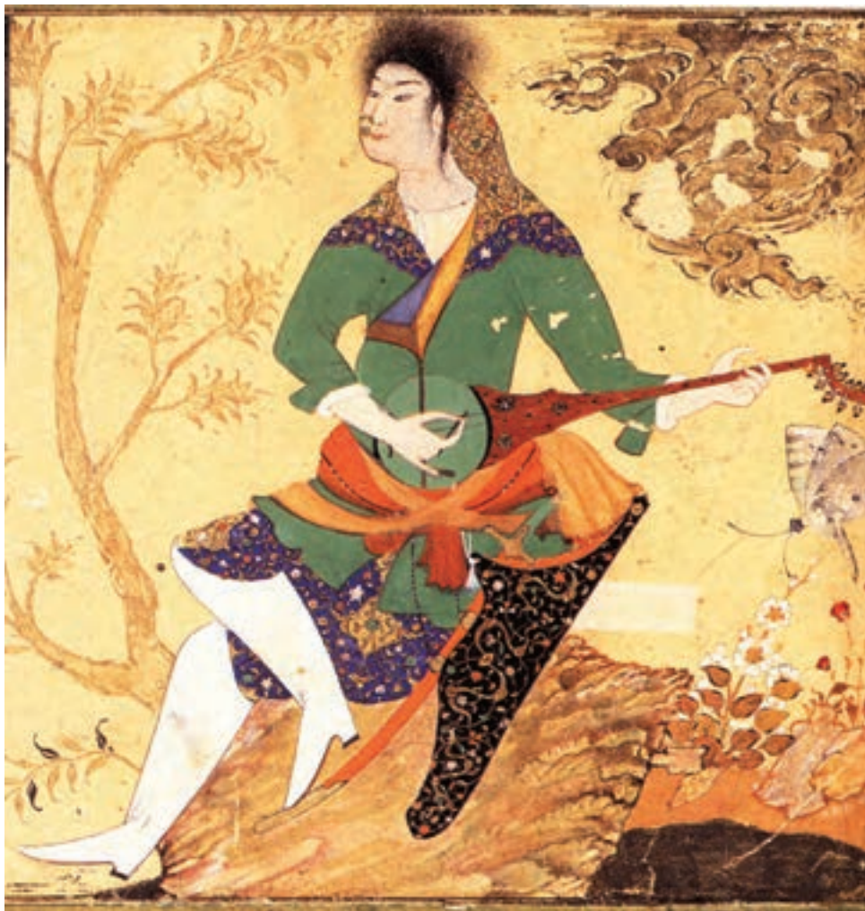
تصویر ۱-۳۴- نوازنده‌ی رباب، اثر محمدجعفر، مکتب قزوین، قرن دهم هجری، کتابخانه‌ی بریتانیا

این شیوه توسط هنرمندان مکتب قزوین دنبال شده و در دوران صفوی نیز ادامه یافت (تصویر ۱-۳۴).