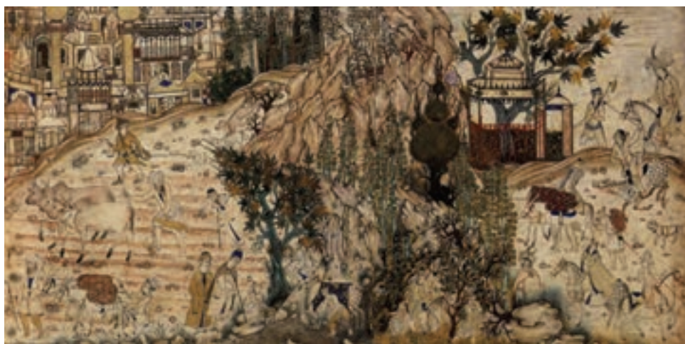
تصویر ۱-۳۱- کار در مزرعه با دورنمای شهر، اثر محمدی، مکتب قزوین، قرن دهم و یازدهم هجری، موزه توپکاپی استانبول

حرکات، طبیعی‌تر گشت و کم‌کم نوعی طبیعت‌گرایی که در مکاتب بعدی با شدت بیش‌تری بروز کرد، در این دوره دیده شد، در آثار نقاشی مکتب قزوین توجه به موضوعات درباری و جنگ و جدال کم‌تر شد و هنرمندان به موضوع‌های عمومی و زندگانی روستایی پرداختند. در این تصاویر، از عمامه‌های دوازده ترکی با میله‌ی قرمز اثری نیست، اغلب تصاویر در کتب به صورت جفتی اجرا شده و معمولاً دو تصویر با یک کادر به تصویر درآمده است. در این دوره مجدداً نقاشی دیواری آغاز گردید و ما شاهد آثار بسیار زیبایی در کاخ قزوین هستیم (تصاویر ۱-۳۱ و ۱-۳۲).