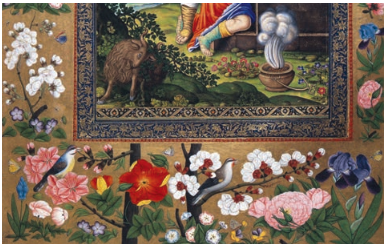
تصویر ۱-۵۰ - پرندگان و گل‌ها، بخشی از اثر، گواش و آبرنگ، مکتب اصفهان و تهران، اواخر قرن دوازدهم هجری، موزه سن پترزبورگ