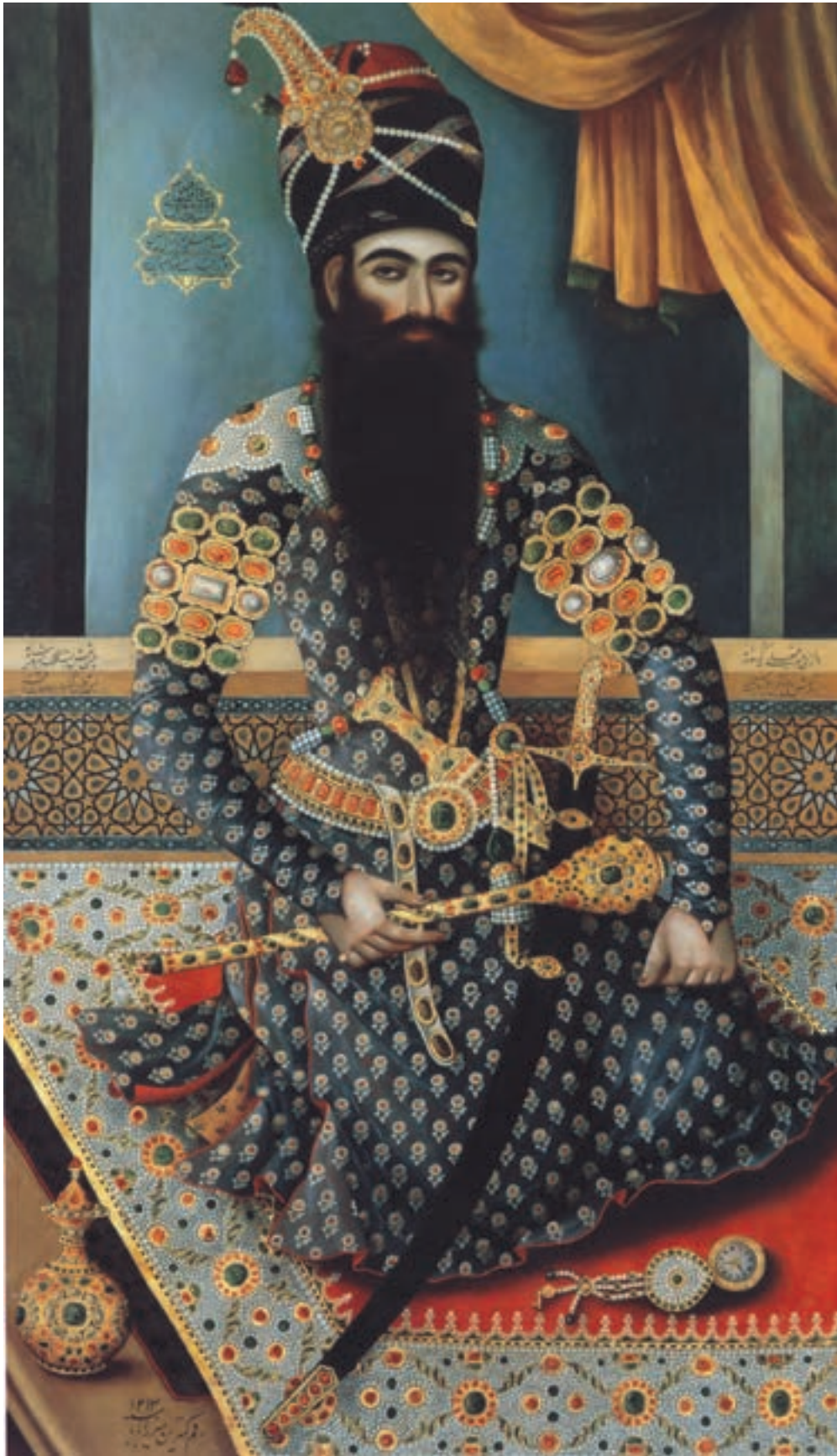
تصویر ۵۱-۱- فتحعلی شاه، اثر میرزا بابا، رنگ و روغن روی بوم، مکتب تهران، اواخر قرن دوازدهم هجری، لندن