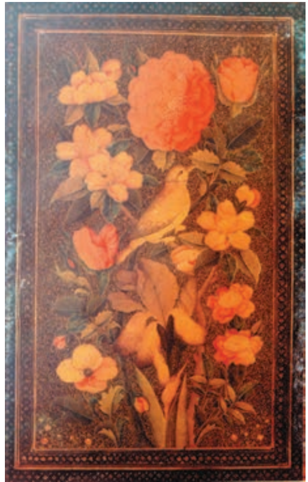
تصویر ۴۵-۱- جلد قرآن، لاک، گل و مرغ، مکتب شیراز

پس از سلطنت کریم خان زند، اختلاف زیادی بین جانشینان او و آقا محمدخان که از قبایل ترک قاجار بود روی داد. در نهایت آقا محمدخان با غلبه بر جانشینان کریم خان، توانست سلسله‌ی جدیدی تشکیل دهد و تهران را به پایتختی برگزیند. اما پس از چندی آقا محمدخان به قتل رسید و برادرزاده‌ی او باباخان پسر حسینعلی خان جهانسوز که در شیراز به سر می‌برد به سرعت خود را به تهران رسانید و با نام فتحعلی شاه به تخت نشست. فتحعلی شاه به هنرمندان نقاش توجه خاصی داشت و تصویرگران در دربار او به‌طور مستمر مشغول کشیدن تصاویر شاه در حالت‌های مختلف بودند. این تصاویر، اغلب با رنگ روغن و به اندازه‌ی طبیعی کشیده می‌شد. دیوارکاخ‌ها و سراها انباشته از مجالس نقاشی دیواری بود که اغلب، تصاویر سلطان و رقاصه‌ها و بانوان حرم سرا و مجالس عیش و عشرت شاه را ارائه می‌کرد (تصویر ۴۷-۱).