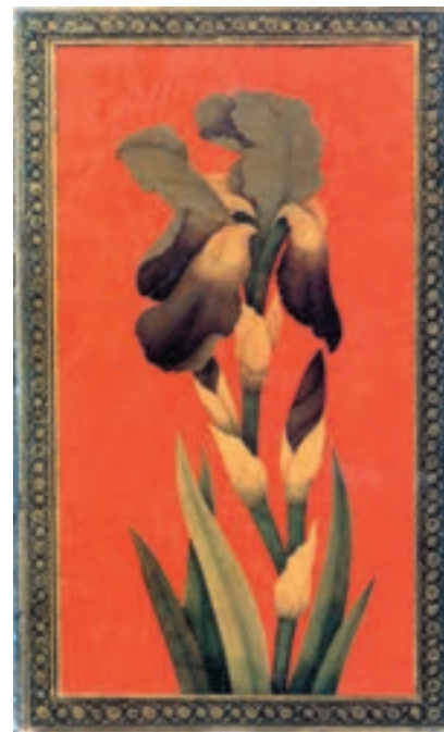
تصویر ۴۶-۱- تصویر جلد لاک با طرح گل زنبق مکتب شیراز