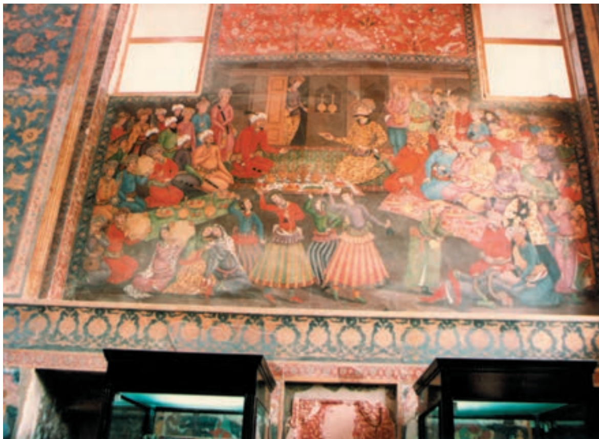
تصویر ۱-۴۱- محمدخان در دربار شاه‌عباس، نقاشی دیواری، مکتب اصفهان، قرن یازدهم هجری، کاخ چهلستون اصفهان

۴- گرایش چهارم: توجه به نقاشی در بناهای مجلل، نقاشی روی قاب آینه، قلمدان و جعبه‌ها رواج پیدا کرد. از