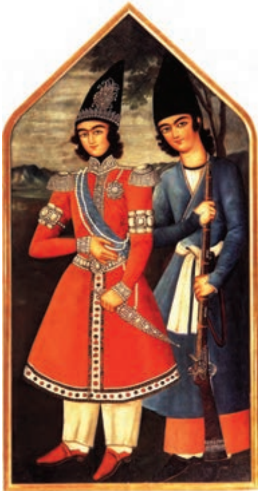
تصویر ۴۷-۱- شاهزاده قاجار و محافظ، رنگ روغن روی بوم، مکتب تهران، قرن سیزدهم هجری