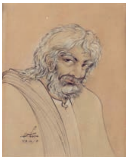
تصویر ۱-۵۹- حافظ، اثر حسین بهزاد، آبرنگ، آبان ماه ۱۳۳۶، تهران