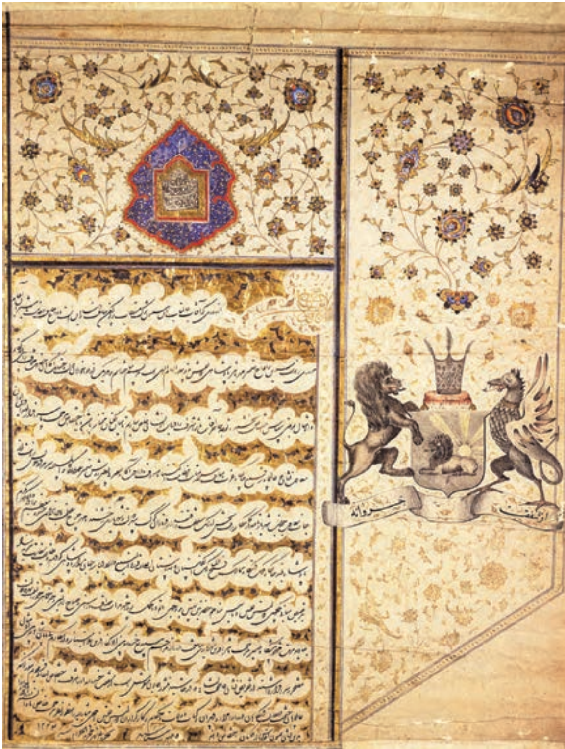
تصویر ۴۹-۱- نامه فتحعلی شاه به سفیر انگلستان، رنگ و مرکب و طلا روی کاغذ، مکتب تهران، قرن سیزدهم هجری، لندن