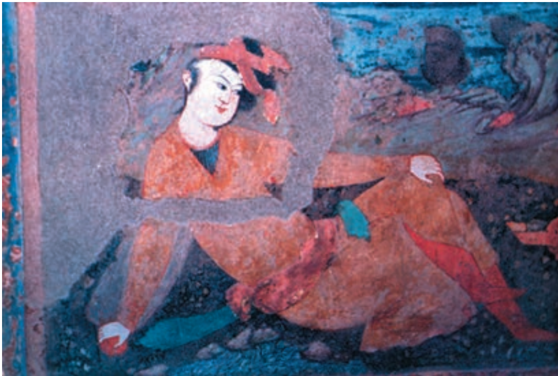
تصویر ۳۶-۱- جوان نشسته، نقاشی دیواری، مکتب اصفهان، قرن یازدهم هجری، عمارت عالی‌قاپو در اصفهان

در این دوره، هنرمندان کم‌کم از زیر حمایت دربار بیرون آمدند و مستقلاً به کار مشغول شدند. صورت‌نگاری و تک‌چهره‌سازی که با خوی فردگرایی شاه‌عباس و سایر درباریان مناسبت داشت، گسترش بیش‌تری یافت. شاه‌عباس به‌منظور آشنا