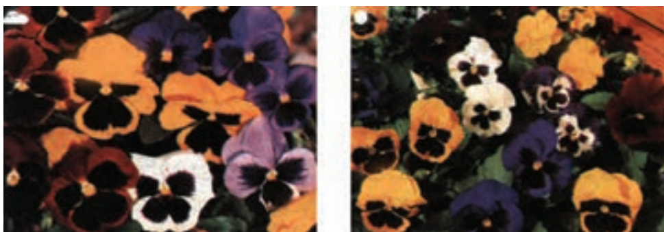
شکل ۸-۹- ارقامی از بنفشه سه رنگ (بنفشه فرنگی)

مهم‌ترین گونه بنفشه؛ بنفشه‌ی سه رنگ ۱ است که ارقام مختلفی دارد و از آن جمله بنفشه‌ی سه رنگ گل درشت پیش رس است که به اسم بنفشه گل درشت پاریسی معروف است. دارای زمینه‌ای به رنگ‌های قرمز؛ سفید؛ زرد و مسی بوده، روی آن لکه‌های بزرگ و پهن قهوه‌ای یا بنفش و... دیده می‌شود (شکل ۸-۹).