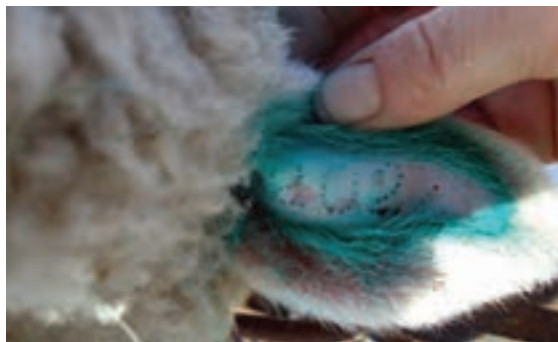
گوش خال کوبی شده

خال کوبی روی سطح داخلی و یا خارجی گوش به وسیله پلاک کوب مخصوص خال کوبی (انبر خال کوبی) انجام می‌شود. این پلاک کوب دارای حروف و ارقام تغییرپذیر هستند و به شکل سوزن‌های نوک تیز می‌باشند. اعداد سوزنی شکل در پلاک کوب مخصوص خال کوبی قرار داده می‌شود و مخاط داخلی گوش توسط آنها سوراخ می‌شود. سوراخ‌های ایجاد شده به شکل شماره یا علامت مورد نظر ظاهر می‌شود. سپس جوهر مخصوص روی آنها مالیده می‌شود. پس از چند روز جای سوزن‌ها بهبود می‌یابد و جوهر در زیر پوست به صورت نقاط رنگی باقی می‌ماند و شماره دام با استفاده از جوهر به کار رفته قابل خواندن خواهد بود. در مقایسه با سایر روش‌های علامت‌گذاری، خال کوبی نسبتاً پرهزینه است؛ اما اگر به درستی انجام شود تا آخر عمر حیوان، اثر آن باقی می‌ماند. ولی حیواناتی که پوست گوش آنها سیاه‌رنگ است، نقش خال آنها واضح نیست.