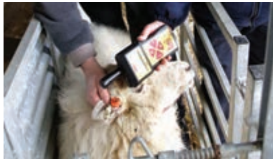
استفاده از میکروچیپ در گوش گوسفند

خمیر قلیایی توسط یک مهر لاستیکی روی پوست خشک قرار داده می‌شود. این روش باعث ایجاد فرورفتگی بدون مو می‌شود. در چند روز اول پس از استعمال، باید حیوان را از باران و رطوبت محافظت نمود.