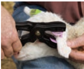
نحوه مهار بره با دست

در زیر برخی از روش‌های مهار کردن گوسفند و بز نشان داده شده است.