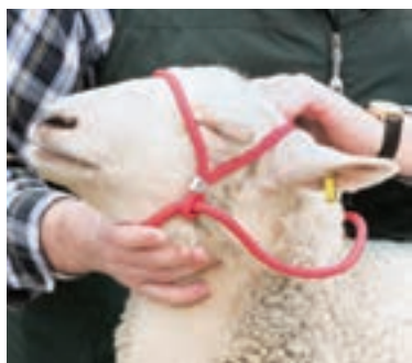
طناب برای مهار کردن گوسفند و بز