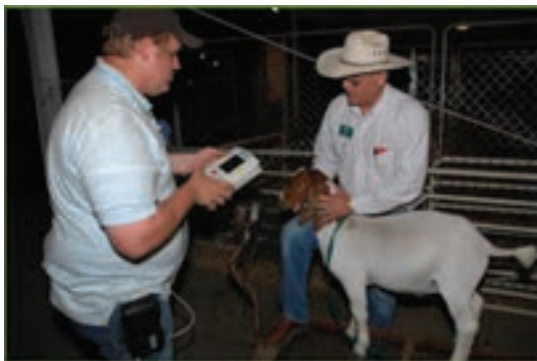
استفاده از اسکن شبکیه چشم در بز