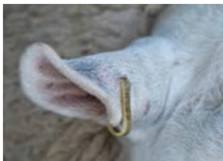
استفاده از پلاک گوش فلزی