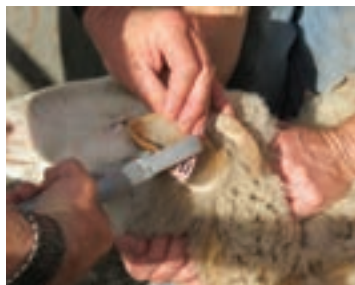
نحوه مهار گوسفند با دست