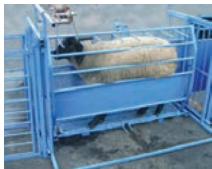
استفاده از نرده و جایگاه انفرادی