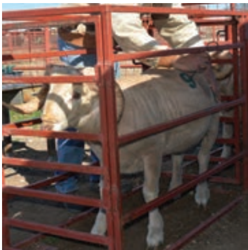
داغ کردن سرد

داغ کردن شامل دو نوع سرد و گرم است؛ داغ کردن گرم در گوسفند و بز با استفاده از ابزاری است که عدد مورد نظر بر روی آن قرار دارد. در قسمت پشت یا پهلو حیوان با سوزاندن کامل پشم دام و از بین بردن فولیکول آن ایجاد می‌شود. به عبارت دیگر شماره‌ها و اعداد با توجه به فقدان پشم ظاهر می‌شود. مزیت آن این است که در مواقعی مثل فصل جفت‌گیری یا زایش می‌توان با سرعت دام را شناسایی نمود و شماره‌ها به قدر کافی بزرگ هستند تا از فاصله دور نیز قابل رؤیت باشد.