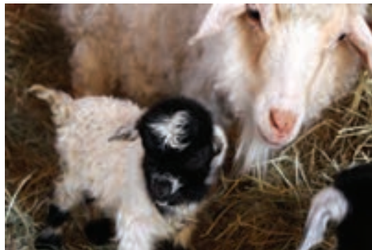
استفاده از اثر بینی در شناسایی دام