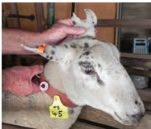
استفاده از پلاک گردن

مخصوص به خود هستند که رنگ آنها به آسانی از بین نخواهد رفت و دوام بسیار خوبی دارند، همچنین به منظور تفکیک سنی، جنسیتی و نژاد دام، دامدار می‌تواند از پلاک‌هایی با رنگ‌های متفاوت استفاده کند.