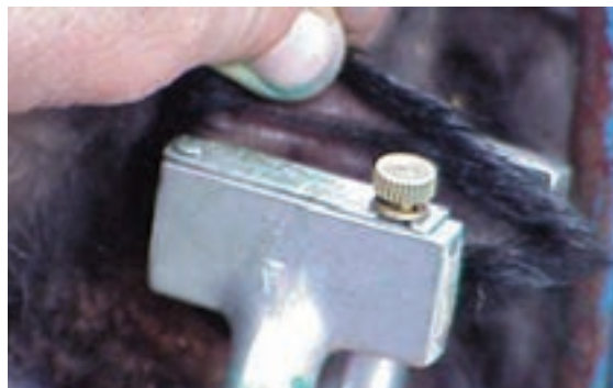
دستگاه خال کوب با حروف الفبایی

برای خال کوبی بره و بزغاله‌ها، حداقل باید تا سن ۵ یا ۶ ماهگی صبر کرد. در این سن جای کافی برای نصب شماره‌ها در گوش وجود دارد و گوش به اندازه کافی رشد کرده است. اگر دام را در سنین بسیار پایین خال کوبی کنید با رشد گوش اثر خال کوبی به تدریج محو می‌شود. به علاوه ضخیم شدن تدریجی بافت‌های گوش و افزایش مقدار مواد رنگی پوست، خال کوبی را غیر قابل خواندن می‌کند.