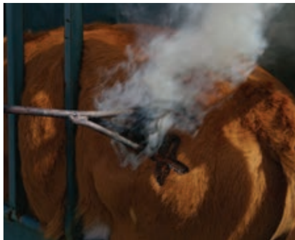
داغ کردن گرم

در مورد مزایا و معایب هر یک از روش‌های شماره‌زنی بررسی کنید و در کلاس درس گزارش دهید.