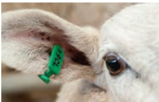
استفاده از پلاک گوش پلاستیکی