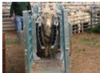
دستگاه مهارکننده ثابت (ایموبلایزر) ۱