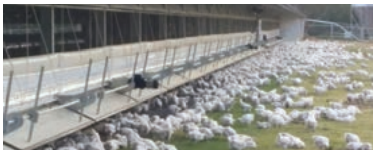
نمونه سالن در مناطق گرم و مرطوب (شرجی)