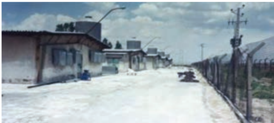
حصارکشی اطراف سالن‌های مرغداری

اقدامات لازم جهت جلوگیری از ورود حیوانات وحشی به‌عمل آید و محوطه مرغداری حصارکشی گردد. (حتی‌الامکان دو ردیف حصار کشیده شود).