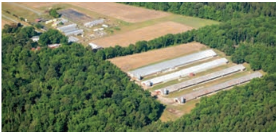
نمونه احداث بادشکن در اطراف سالن‌های مرغداری

احداث بادشکن برای اطراف سالن‌ها بسیار ضروری می‌باشد. درخت کاری در اطراف سالن‌ها در صورت امکان در صورتی که فصل مناسب است قبل از زمان شروع عملیات ساختمانی توصیه می‌گردد. وجود درختان علاوه بر تلطیف هوا و نقش بادشکن نقش مهمی در ایزوله کردن محوطه مرغداری دارد.