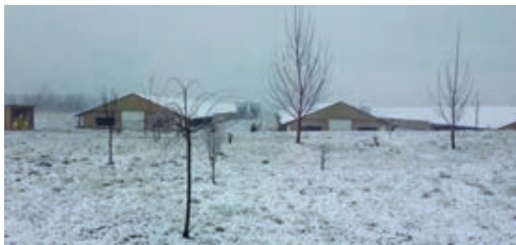
نمونه سالن در مناطق سرد

موقعیت مزرعه باید طوری باشد که مواد اولیه خوراک طیور با طی مسافت کم و هزینه کم به مزرعه برسند. همچنین به منظور رساندن تولیدات به بازار، مزرعه باید به ایستگاه قطار و یا فرودگاه نزدیک باشد. البته