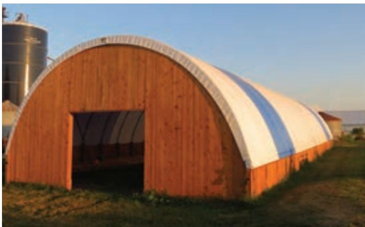
نمای بیرونی سالن‌های برزنتی (کشور فرانسه)