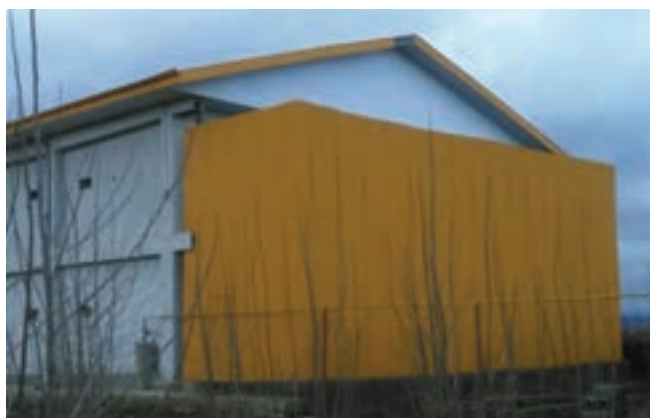
انبار لوازم، پوشال و کلس

یک انبار برای سایر لوازم و یا پوشال و کلس در نظر گرفته شود.