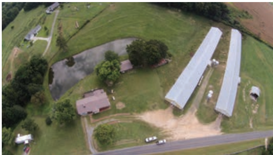
تصویر مرغداری در کنار جاده اصلی

مرغداری‌ها باید از کنار جاده فاصله داشته باشند تا در اثر تردد کامیون‌هایی که مرغ زنده و یا کود حمل می‌کنند در معرض آلودگی قرار نگیرند. در عکس زیر یک مرغداری با فاصله بسیار کم از جاده ترانزیت دیده می‌شود. جاده‌های ترانزیت ریسک بسیار بالایی برای انتقال آلودگی دارند چون ممکن است در اثر تردد کامیون‌ها آلودگی را از یک کشور به کشور دیگر منتقل سازند. این عکس را از یک مرغداری در کشور ترکیه گرفته‌ام.