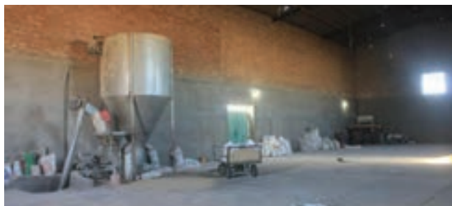
سالن انبار مواد اولیه خوراک و محل تهیه دان

قسمتی جهت احداث انبار مواد اولیه و همچنین محل ساخت دان در نظر گرفته شود. ظرفیت این قسمت باید طوری محاسبه گردد که گنجایش مصرف ۴ ماه طیور را داشته باشد.