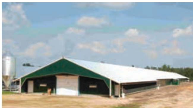
منظره مرغداری قبل از محوطه سازی

در صورتی که مزرعه تولید تخم مرغ دارد محلی برای درجه بندی، دود دادن و انبار تخم مرغ در نظر گرفته شود. قسمتی را جهت کالبدگشایی طیور تلف شده و دفع ضایعات (کوره لاشه سوز) در نظر بگیرید.