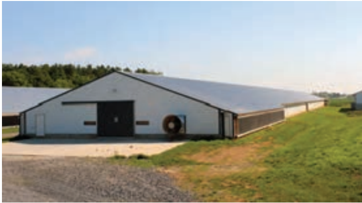
نمونه سالن در مناطق معتدل

در مناطق گرمسیر سالن‌ها باید طوری احداث شوند که آفتاب از مسیر سقف رد بشود (شرقی- غربی).