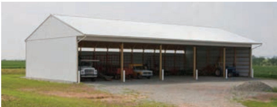
پارکینگ وسایل نقلیه

قسمتی جهت پارک وسایل نقلیه و سرویس آنها در نظر گرفته شود. همچنین قسمتی به‌عنوان دفتر فنی جهت انجام تعمیرات در نظر گرفته شود.