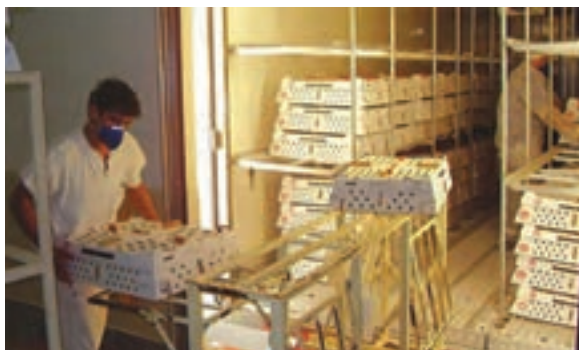
نحوه چیدن کارتن‌ها در ماشین حمل