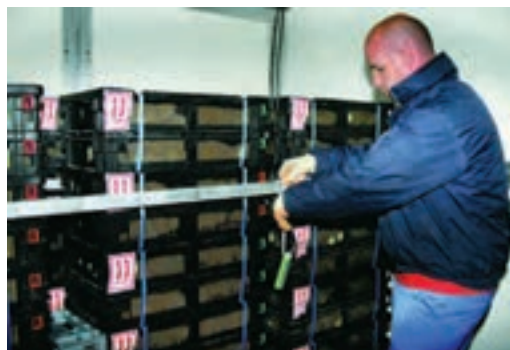
مهار شدن سبد جوجه‌ها در ماشین‌های حمل