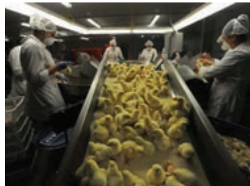
انتقال جوجه‌ها برای درجه‌بندی