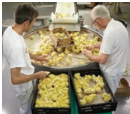
۲. انتقال جوجه‌ها به کارتن‌ها با استفاده از نوار نقاله

معمولاً کارتن مورد استفاده در جوجه‌کشی‌ها به چهار بخش تقسیم می‌شود تا از تجمع جوجه‌ها در یک گوشه کارتن جلوگیری شود. در فصول گرم سال در صورتی که درجه حرارت بالای ۲۱ درجه سانتی‌گراد باشد در کارتن‌ها ۸۰ قطعه جوجه و در صورتی که حرارت از ۲۱ درجه سانتی‌گراد پایین‌تر باشد ۱۰۰ قطعه جوجه را در کارتن‌ها قرار دهید. کارتن‌های آماده شده را در گاری بچینید و از قرار دادن کارتن‌ها روی زمین خودداری کنید. وقتی جوجه‌های تازه هچ شده در کارتن‌ها قرار می‌گیرند، قسمت شکم آنها نرم است، بدنشان به طور کامل کرک ندارد و به خوبی قادر به ایستادن نیستند. به همین دلیل باید اجازه داد تا بدن جوجه‌ها سفت شود.