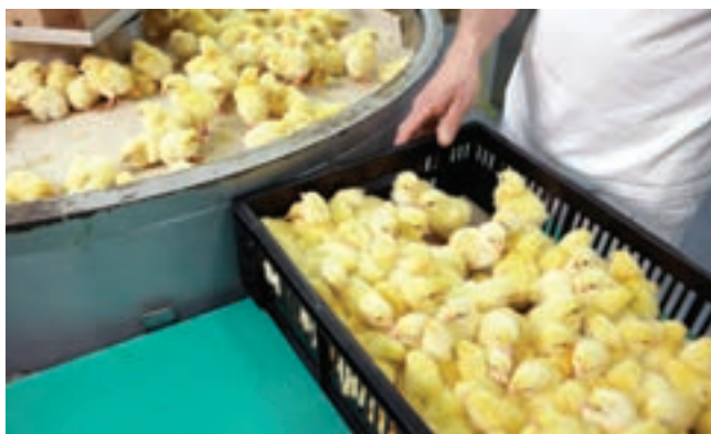
۱. انتقال جوجه‌ها به کارتن‌ها به صورت دستی