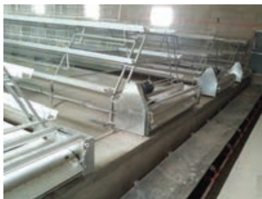
جمع آوری کود به روش نوار نقاله