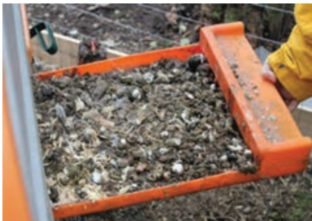
جمع آوری کود قفس ها به صورت دستی

کاردک تخلیه می کنند. ۲. خودکار: در قفس های دارای نقاله، کود در زیر قفس روی صفحه ای از جنس پلاستیک ضخیم یا برزنت می ریزد. صفحه به صورت نوار بی انتهایی است که روزانه یک بار به حرکت در می آید. در انتهای سالن روی هر نوار یک تیغه به صورت ثابت نصب شده است که تیغه کود را می تراشد و در چاله می ریزد.