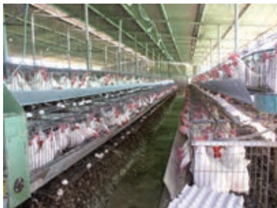
جمع آوری کود به روش گودال عمیق

در جمع‌آوری کودهای دام و طیور ضمن حفظ اصول علمی و بهداشتی و استفاده از چکمه، دستکش و ماسک بهداشتی و سایر نکات علمی، سالن را برای مراحل بعد تولید آماده کنید تا در وقت و هزینه‌ها صرفه‌جویی شود. به هر حال رعایت هر نکته‌ای که در این خصوص (علمی، بهداشتی، ایمنی و اقتصادی) فرا گرفته‌اید دقیقاً عین رعایت احکام شرعی، واجب و لازم و عین تقوای الهی است. حداکثر بهره‌وری از حداقل امکانات و سالم‌ترین بهره‌وری با حفظ کمیّت تولید، نشانه موفقیت شما در رعایت تقوای الهی و از بهترین عبادت‌ها و بهترین اعمال صالح و خدمت به بندگان خداست.