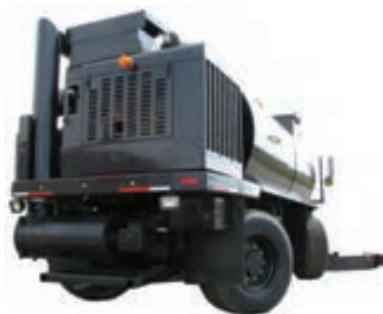
مخزن جمع‌آوری کود

وجود مارپیچ سراسری در قسمت تحتانی مخزن به دستگاه این اجازه را می‌دهد تا هر نوع کود (اعم از مایع و جامد) را به راحتی تخلیه کند.