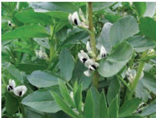
در خاک‌های حاصلخیز یا غنی از مواد غذایی، گیاهان شاداب و پر محصول می‌شوند.