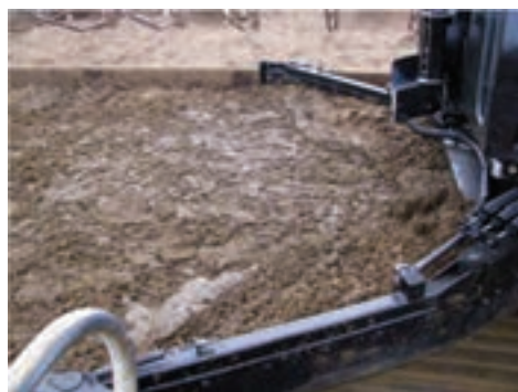
تیغه کود جمع‌کن

به طور مثال هرگاه تیغه را روی ۵ متر تنظیم شود، تیغه از انتهای سالن حرکت می‌کند و تا ۵ متر جلو می‌آید، سپس متوقف می‌شود و به عقب برمی‌گردد و تمام کودهای این فاصله را به داخل کانالی در عرض سالن می‌ریزد. در مرحله بعد فاصله را بیشتر کنید، این عمل را آنقدر ادامه دهید تا تمام طول سالن پاک شود. دقت کنید: طول مرحله رفت و آمد از ۱ تا ۵۰ متر قابل تنظیم است.