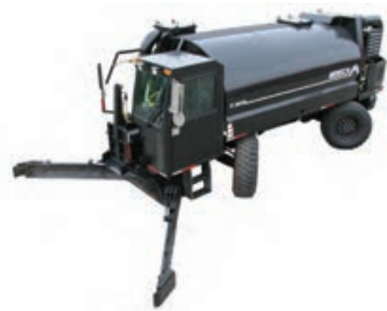
ماشین جمع آوری کود با مخزن خلأ

با استفاده از این مخازن، نیازی به طراحی‌های پرهزینه برای ایجاد شبکه‌های یک پارچه جمع آوری کود نیست. این مخازن به راحتی جایگزین پمپ‌ها، اوگرها (مارپیچ‌ها) و کانال‌های بتنی حمل کود از سالن‌ها به حوضچه‌های نگهداری کود می‌شوند.