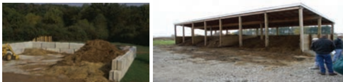
انبار نگهداری و ذخیره کود

شرایط مساعدی را برای تکثیر و تداوم عوامل بیماری‌زا در خارج از بدن موجود مهیا می‌کند و این عوامل توسط باد، آب، پرندگان و ... به سایر نقاط منتقل شده و باعث ایجاد خطر برای پرندگان و انسان‌ها می‌شوند. برخی از عوامل بیماری‌زای موجود در کود شامل باکتری‌های کمپیلوباکتر، سالمونلا، ای‌کلای و ویروس آنفلوانزا هستند. کود مرغی یکی از عوامل تهدیدکننده در گسترش بیماری‌های طیور در ایران است؛ بنابراین باید کود را به‌طور صحیح و درست در محل انبار نگهداری کود ذخیره کرد.