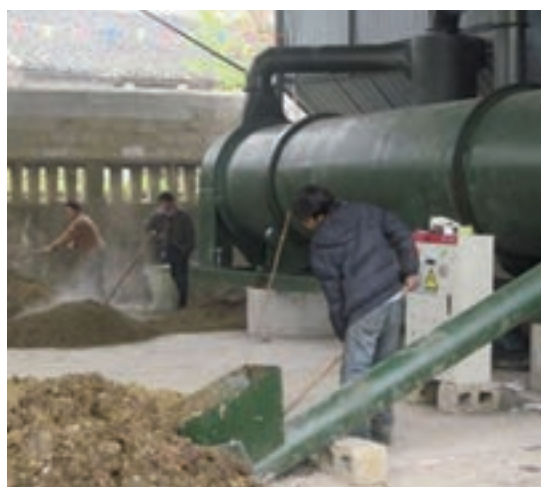
خشک کردن کود مرغ با سیستم خشک کن علامت اخطار: عدم رعایت اصول ایمنی