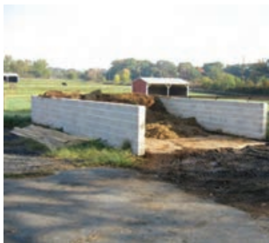
خشک کردن کود به روش طبیعی

تجهیزات مختلفی برای خشک کردن مکانیکی کود در بازار وجود دارد که طی آن کود مرغ پس از خشک شدن تبدیل به پلت یا بلوک شده و در اختیار مصرف کنندگان قرار می گیرد.