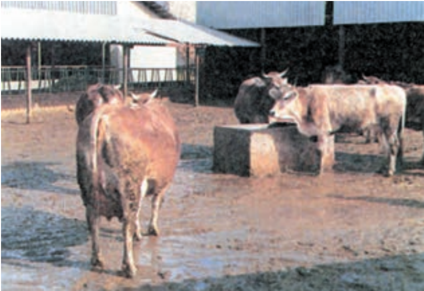
شکل ۳-۵ نمای یک اصطلب نیمه باز با آبشخور آن

به محل آب خوردن حیوان، آبشخور می گویند انواع آبشخورهای مورد استفاده در گاوداریها عبارتند از آبشخور معمولی و آبشخور اتوماتیک. آبشخورهای اتوماتیک با توجه به صرفه جویی عمده ای که در مصرف آب به وجود می آورند امروزه در گاوداریهای مدرن زیاد مورد استفاده قرار می گیرند.