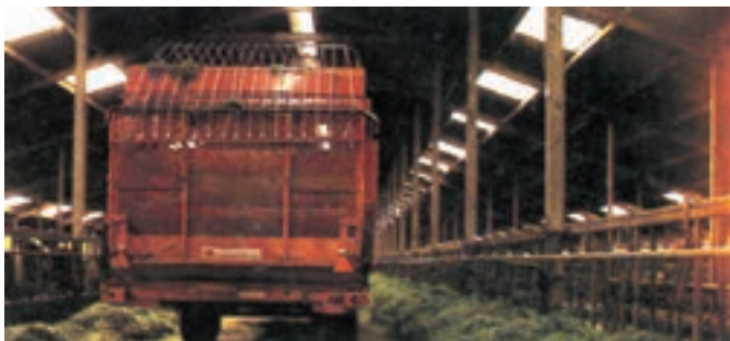
شکل ۶-۳ نمای پنجره‌های سقفی در اصطبل

۲- اصطبل باز: اینگونه اصطبلها از چهار طرف کاملاً باز بوده و فقط سایبان به منظور استراحت دامها دارند.