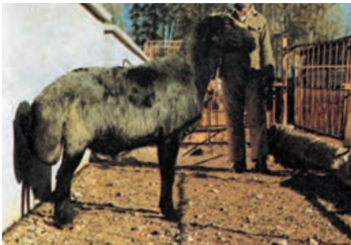
شکل ۴-۴ گوسفند شال