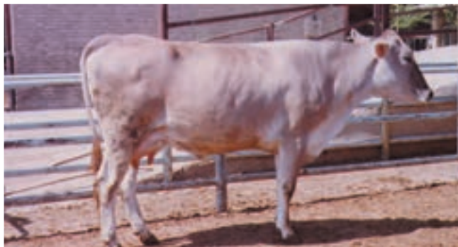
شکل ۱۵-۳ نژاد براون سوئیس

بوده و از خاکستری تا قهوه‌ای تغییر می‌نماید. گاو براون سوئیس با آب و هوای مناطق کوهستانی سازگاری خوبی دارد.