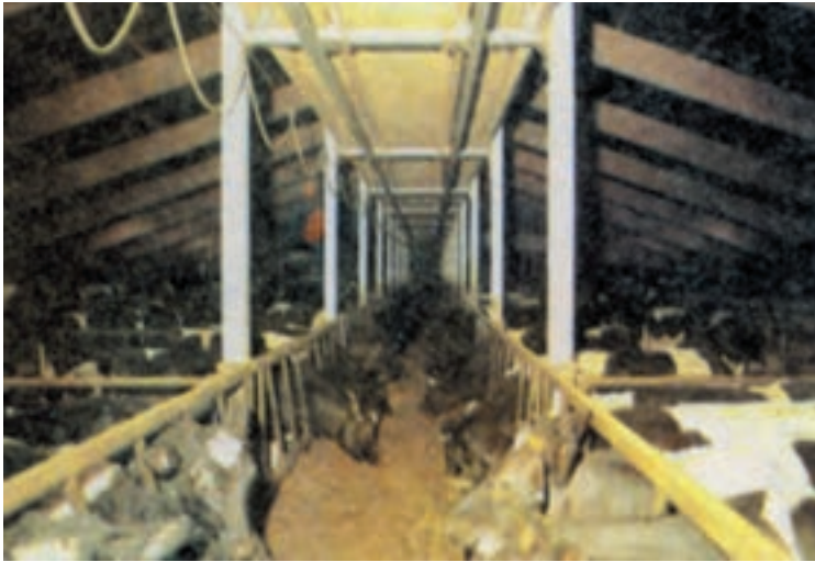
شکل ۳-۳ نحوه تغذیه دام در جایگاه سر به سر