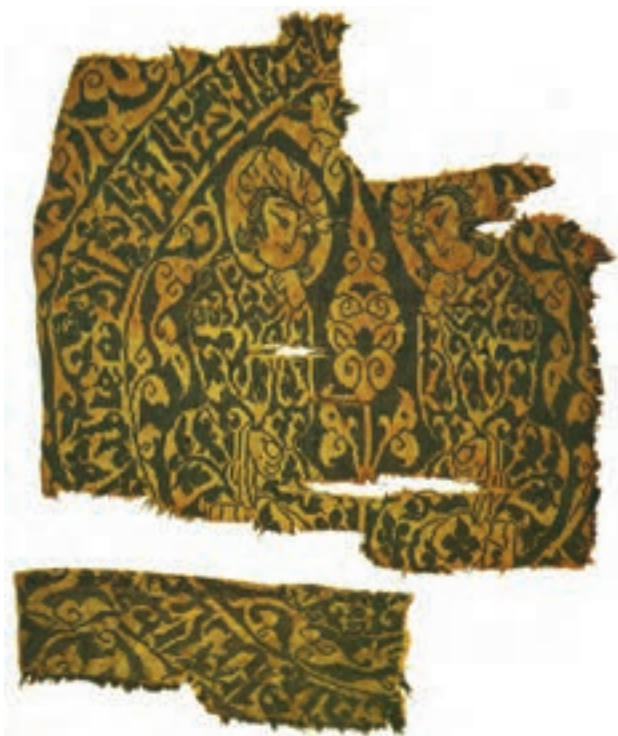
▲ شکل ۹-۱۳- نمونه پارچه آل بویه با طرح ساسانی، ابریشم

صورت‌های متین انسانی، نوعی وحدت موضوعی با بافت پارچه پدید آورده است (شکل ۹-۱۳). جنس اغلب این پارچه‌ها، ابریشمی و میراث‌دار هنر و سنت ساسانی است. از جمله نقش‌های منحصر به فرد، نقش شیر و طاووس در دو طرف درخت زندگی است که در دایره‌ای محاط شده (طاووس نشانه آسمان پرستاره) است. همچنین وجود برگ پهن با نقطه‌های درشت از سبک سفال‌های مینایی اقتباس شده است. وجود حشرات (پروانه) در این نوع نقش و بافت پارچه، نوعی بدعت و ابتکار در نقوش است. طرح دو طاووس و نخل با ساقه نازک که شاخ و برگش مانند چهره انسانی است از ابداعات هنرمندان دوره اسلامی به‌شمار می‌رود (شکل ۹-۱۴). این پارچه‌ها معمولاً در کاربردهای مختلف و با رنگ‌های متنوع که نشان دهنده مهارت بالای رنگرزی الیاف است، تولید می‌شده است.