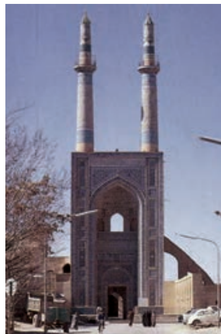
▲ شکل ۴-۱ مسجد جامع یزد