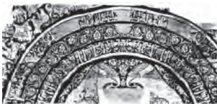
▲ شکل ۹-۱۴- بخشی از پارچه با طرح پرند

فلزکاران نیز در این دوره همه گونه اشیاء زیبا را به شیوه‌های گوناگون فلزکاری می‌ساختند و بیشترین شکل‌ها و نقش‌های به‌جا مانده نقوش جانوری، پرندگان و یا موجودات تلفیقی است. شاخص اصلی شکل ظروف در کاربردهای مختلف، نقش پرند و شاخه با تزیینات شبدری ۱ و ترنجی ۲ بوده است (شکل ۹-۱۵). همچنین بیشتر این نقوش بر روی گچ‌بری‌ها و سفالگری نیز دیده می‌شود. هنر سفالگری در این دوره نیز به تدریج از لحاظ کمیت و کیفیت پیشرفت کرد و به موازات هنر فلزکاری مفرغی به عالی‌ترین درجه خود نائل گردید. پخت سفال‌هایی خاص و نازک به نام «پوست تخم مرغی» که با طرح‌های ظریف شاخ و برگ گیاهی تزیین شده و به وسیله لعاب شفاف قلیایی پوشانده شده بود، در این دوره به وجود آمد (شکل ۹-۱۶). وجود ظروف با تزیین مینایی ۳ که از نظر ظرافت و تنوع نقوش با نسخه‌های خطی این دوره قابل مقایسه است، بر همکاری نگارگران و سفالگران دلالت دارد. بیشترین