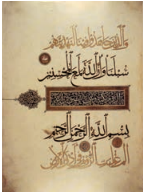
▲ شکل ۱۷-۱۰ - برگي از قرآن مجید

همچنین هنر کتاب آرایي و خوشنویسی در زمینه‌های گسترده‌ای رواج یافت و کتابت را به هنری فاخر مبدل ساخت. این تحول با حضور استادان شش‌گانه خوشنویسی - از شاگردان یاقوت مستعصمی - در سه منطقه مهم فارس، خراسان و آذربایجان شکل می‌گیرد. این خوشنویسان هنر خویش را در کاربردهای مختلف تزیین بناها و کتابت نسخه‌های خطی گسترش دادند (شکل ۱۷-۱۰). همچنین ابداع خط نستعلیق توسط میرعلی تیریزی نیز به دوره جلایریان بازمی‌گردد.