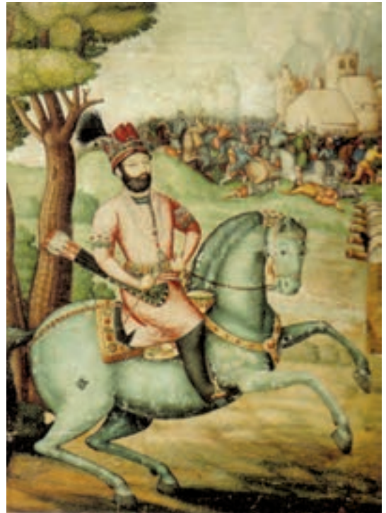
▲ شکل ۱-۱۳-الف - نادرشاه افشار، اثر علی بن عبدالبیگ علی قلی جبه دار