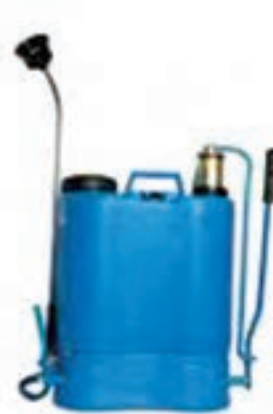
شکل ۲۷-۳- سم پاش کتابی پشتهی /هرمی