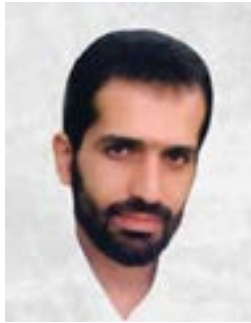
شهید مصطفی احمدی روشن (دانشمند انرژی هسته ای)