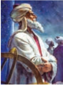
ابوریحان بیرونی (ریاضی دان و منجم)

به کمک تصویر با دوستان خود درباره ی این پیام قرآنی گفت و گو کنید.