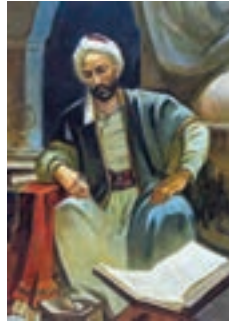
خواجه نصیرالدین طوسی (ریاضی دان، منجم، اندیشمند و سیاستمدار برجسته)