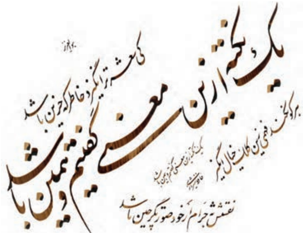
اثر محمدی تبار

مانند فردوسی در عرصه‌ی سخن و فرهنگ ایران پهلوانی بی‌همتاست که وقتی قرار بوده است بسراید، مضمونی بهتر و لازم‌تر از حماسه‌ی انسان عصر خود نیافته و همان را با صداقتی بی‌مانند در عرصه‌ی شعر خویش به نمایش گذاشته است. در این جا نمونه‌ای از شعر او را می‌آوریم.