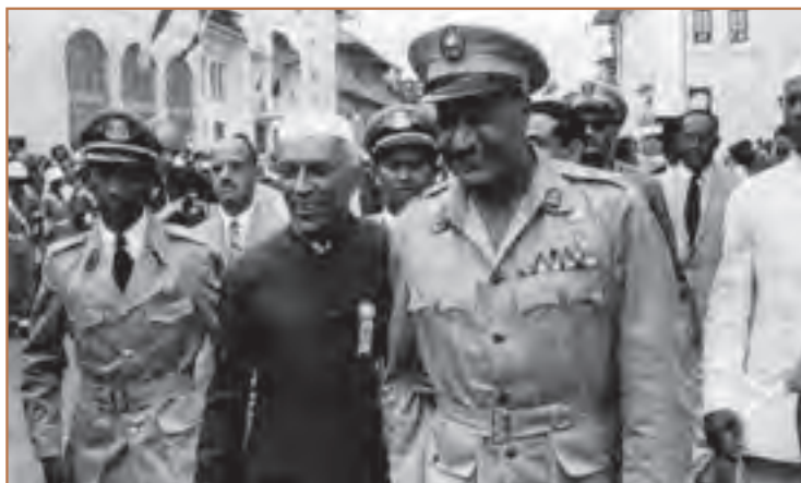
ناصر رئیس‌جمهوری مصر (سمت راست) و نهرو نخست‌وزیر هند از پایه‌گذاران جنبش غیر متعهدا

در این میان کشورهایی نیز بودند که عضویت هیچ یک از بلوک بندی‌های نظامی شرق و غرب را قبول نکردند و به جنبش غیر متعهد معروف شدند. هدف کشورهای غیر متعهد مبارزه با هرگونه سلطه استعماری در جهان بود. پایه‌گذاران این جنبش جمال عبدالناصر از مصر، احمد سوکارنو از اندونزی و جواهر لعل نهرو از هندوستان بودند که در کنفرانس «باندونگ» ۴ در اندونزی، اصولی را که باید غیر متعهدا رعایت کنند، انتشار دادند. پس از مدتی مارشال تیتو – با آن که کمونیست بود، خود را از سلطه شوروی خلاص کرد – و فیدل کاسترو رهبر کوبا، نیز به این جنبش پیوستند.