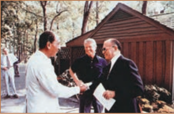
آیا می‌دانید این تصویر مربوط به چیست؟