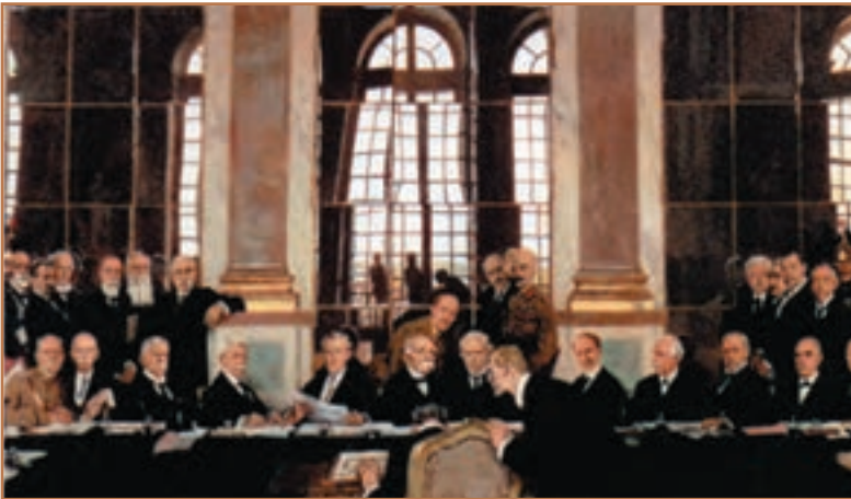
صحنه‌ای از کنفرانس ورسای

بعد از صلح ورسای، متفقین مجارستان را از اتریش جدا کردند و به آن استقلال دادند. امپراتوری عثمانی نیز تجزیه شد. انگلستان و فرانسه، سرزمین‌های عرب‌نشین آن امپراتوری را میان خود تقسیم کردند و از باقیمانده قلمرو عثمانی، کشور ترکیه به‌وجود آمد.