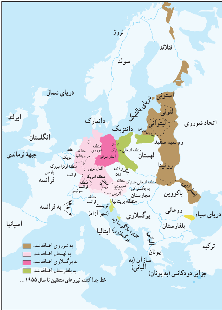
تحولات ارضی در اروپا پس از جنگ جهانی دوم