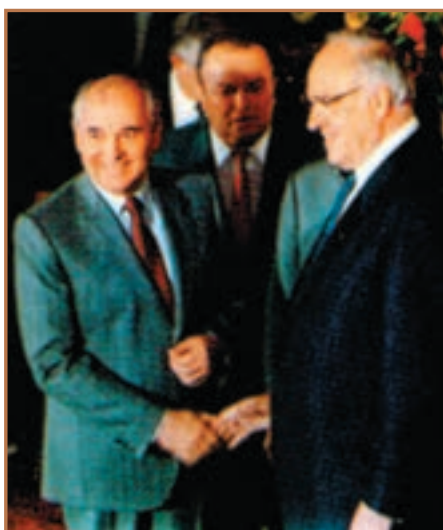
گورباچف (سمت چپ) رئیس جمهور روسیه در ملاقات با هلموت کُهل صدراعظم آلمان

گورباچف، در نتیجه اعمال این سیاست ها، در داخل کشورش دچار طغیان یلتسین شد. یلتسین اصرار داشت که چون گورباچف در سیاست های خود شکست خورده است، باید استعفا دهد. لذا در شب ۲۵ دسامبر ۱۹۹۱ گورباچف استعفا کرد.