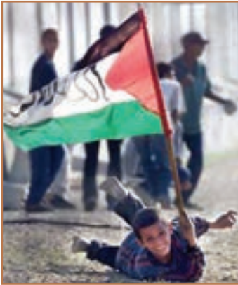
«انتفاضه» جلوهٔ امید و ایمان جوانان فلسطینی

درمانده کرده و موجب شده که توافق‌های عرفات و اسرائیل به نتیجهٔ قطعی، نرسد. اسرائیل غاصب با حملات وحشیانهٔ خود، که به شهادت زنان و کودکان بی‌دفاع فلسطینی منجر شده می‌کوشد که انتفاضه را خاموش کند؛ اما در سال‌های اخیر که بیداری اسلامی رو به گسترش نهاده، اسرائیل ناکام مانده است و روزبه‌روز در منطقه منزوی‌تر می‌شود.