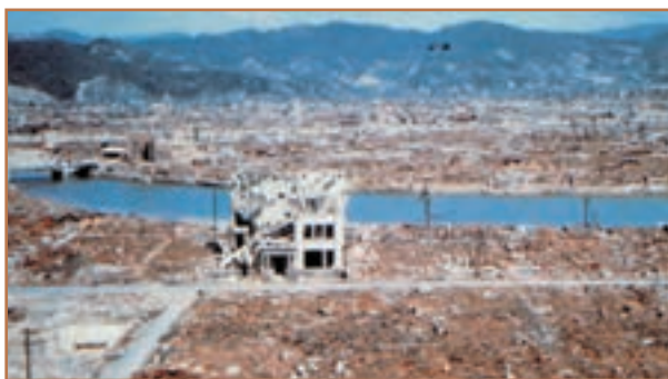
هیروشیما پس از اصابت بمب اتمی آمریکا

در سال ۱۹۳۸ م. دو تن از دانشمندان بزرگ فیزیک در آلمان به نام‌های اتوهان ۱ و فریتس اشترازمن ۲ دریافتند که می‌توان از ماده‌ای به نام اورانیوم بمب اتمی ساخت. اینشتین که همکار آنها بود، از آلمان به آمریکا رفت و به روزولت رئیس‌جمهور آمریکا اطلاع داد که به زودی آلمان صاحب بمب اتمی خواهد شد. به دنبال این ماجرا، به دستور رئیس‌جمهور آمریکا دانشمندی به نام اوپن‌هایمر ۳ که قبلاً در دانشگاه‌های آلمان تحصیل کرده بود و با دو فیزیکدان فوق و نظریاتشان آشنایی کامل داشت، در قالب یک طرح سری به نام «مانهاتان»، شروع به کار کرد تا آن‌که توانست اولین بمب اتمی را در ژوئیه ۱۹۴۵ م. در نزدیک نیومکزیکو آزمایش کند. اوپن‌هایمر دو بمب اتمی دیگر نیز ساخت که ارتش آمریکا آنها را روی شهرهای هیروشیما و ناگازاکی انداخت و این دو شهر را به کلی ویران کرد. گفتنی است آمریکایی‌ها در سال ۱۹۴۲ م. پایگاه‌های تحقیقاتی اتمی آلمان را بمباران کرده بودند.