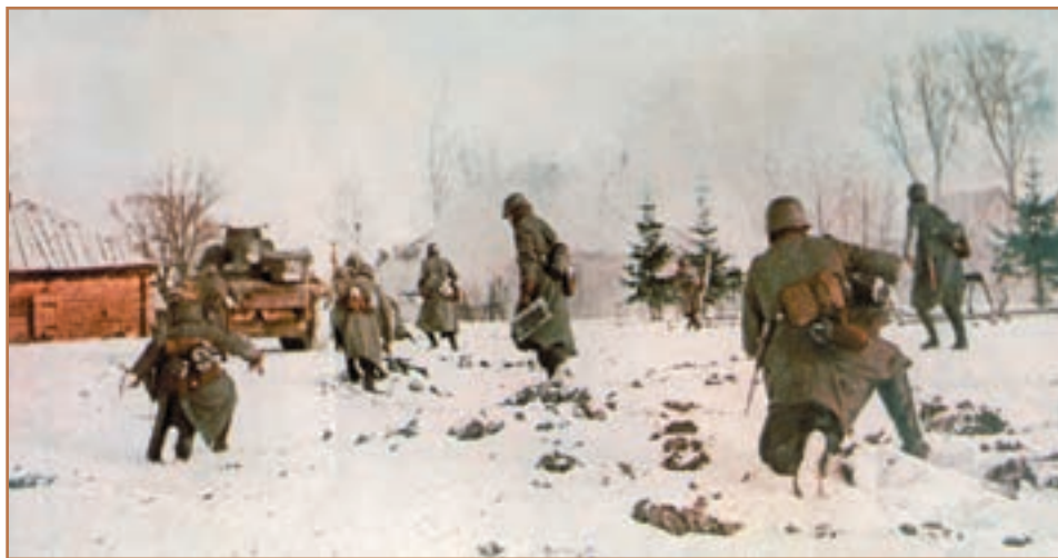
محاصره روسیه توسط ارتش هیتلر

ارتش آلمان با اینکه در جبهه غرب با انگلستان درگیر یک نبرد سنگین هوایی بود، در ۱۹۴۱ م. به طور ناگهانی و غیرمنتظره به شوروی حمله کرد و به سوی مسکو حرکت کرد ولی مسکو، پایتخت شوروی، سرسختانه ایستادگی کرد. استالین به رغم اینکه کمونیست و اصولاً با دین مخالف بود، کلیساها را باز کرد و مردم را در اجرای مراسم دینی آزاد گذاشت. او این جنگ را یک جنگ میهنی اعلام کرد تا همه مردم بر ضد آلمان بسیج شوند. در همین سال دو حادثه روی داد که به نفع شوروی تمام شد. نخست اینکه نیروی دریایی آلمان به کشتی‌های آمریکایی حمله کرد؛ دوم اینکه ناوگان آمریکا در بندر پرل هاربور ۲ توسط ژاپنی‌ها که متحد آلمان بودند، مورد حمله قرار گرفت؛ بنابراین، آمریکا مستقیماً علیه دولت‌های محور وارد جنگ شد. متفقین از طریق اشغال نظامی ایران ۳ ، کمک‌های تسلیحاتی و تدارکاتی زیادی را روانه شوروی کردند ۴ . ابتدا پیشروی نیروهای آلمان در خاک شوروی متوقف و سپس شکست و عقب‌نشینی آنان آغاز شد. مقاومت مردم شوروی و جانبازی آنها در راه میهن نیز در این پیروزی نقش مؤثری داشت.