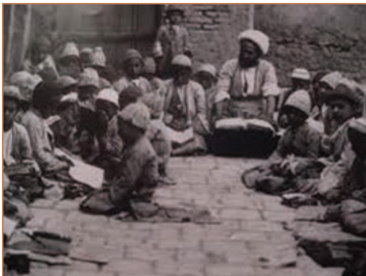
مکتب‌خانه دورهٔ قاجار

۲- اعزام دانشجو به خارج: پس از شکست‌های سیاسی و نظامی حکومت قاجار از دولت‌های اروپایی و بروز نشانه‌های عقب‌ماندگی علمی و فنی ایران نسبت به اروپا، عباس میرزا ولیعهد فتحعلی‌شاه درصدد چاره‌جویی برآمد. بنابراین، در چندین نوبت تعدادی از فرزندان خانواده‌های سرشناس را برای تحصیل علوم و فنون نظامی، علوم طبیعی و پزشکی، مهندسی، کاغذسازی و چاپ به کشورهای انگلستان، فرانسه و روسیه اعزام کرد. محمد شاه نیز سیاست پدر را در اعزام دانشجویان ایرانی به اروپا برای کسب مهارت‌های علمی و فنی ادامه داد. در آن زمان برای اولین بار عده‌ای از خانواده‌های ثروتمند پسران خویش را با هزینهٔ شخصی برای تحصیل به اروپا فرستادند.