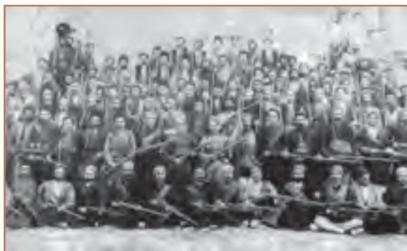
باقرخان در میان جمعی از مشروطه‌خواهان تبریز

دلیرانه شکست خوردند. مأموران شاه مجلس را به توپ بستند و تعدادی از نمایندگان مجلس از جمله آیت‌الله طباطبایی و آیت‌الله بهبهانی را به خارج از تهران تبعید کردند. شماری نیز به سفارت انگلستان پناهنده شدند. چند تن از مشروطه خواهان سرسخت از جمله میرزا جهانگیر خان صوراسرافیل، ملک‌المتکلمین و سید جمال‌الدین واعظ نیز به دستور محمدعلی‌شاه به قتل رسیدند. بدین ترتیب، بار دیگر استبداد به جای مشروطیت نشست و این دوره که یک‌سال و یک‌ماه طول کشید، دوره «استبداد صغیر» نامیده شد.