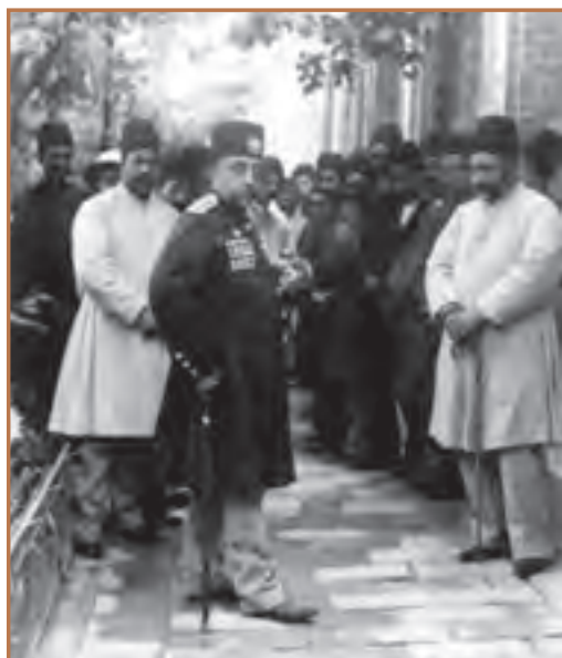
مظفرالدین شاه قاجار و جمعی از درباریان

ناصرالدین شاه در آستانه پنجاهمین سال سلطنت خود توسط میرزا رضا کرمانی مورد هدف قرار گرفت و کشته شد. با قتل وی، پسرش مظفرالدین میرزا به سلطنت رسید. در دوره سلطنت ناصرالدین شاه، زمینه‌های بیداری مردم به تدریج فراهم شد و در دوره سلطنت مظفرالدین شاه، ایران دچار یک تحول سیاسی شد.