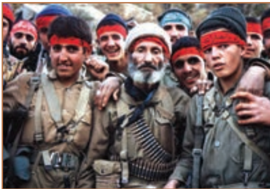
بیر و جوان بسیجی مصمم در دفاع از ایران زمین

بیشترین حضور مردمی در صحنه‌های نبرد در قالب نیروهای بسیجی و جهاد سازندگی انجام می‌گرفت. نیروهای مردمی در کنار دیگر نیروهای نظامی کمک فراوانی در پیشبرد جنگ و کسب پیروزی در نبردهای زمینی داشتند.