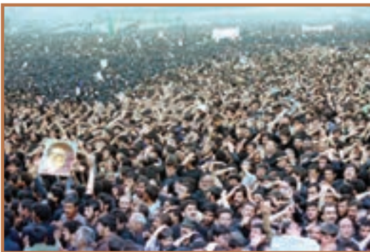
وداع باشکوه ملت با امام و رهبر خویش

امام خمینی (ره) در شامگاه ۱۳ خرداد ۱۳۶۸ بعد از یک دوره بیماری در ۸۷ سالگی دارفانی را وداع کرد و به دیدار حق شتافت. خبر ارتحال امام صبح روز بعد توسط حجت‌الاسلام والمسلمین سید احمد خمینی فرزند انقلابی ایشان به اطلاع مردم ایران و مسلمانان جهان رسید. دو روز بعد، پیکر مطهر امام شهیدان در میان حزن و اندوه میلیون‌ها نفر از تشییع‌کنندگان در بهشت زهراي تهران به خاک سپرده شد.