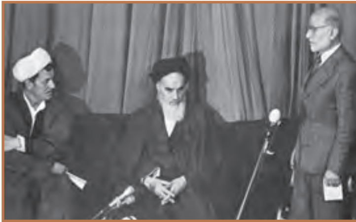
مراسم تنفیذ حکم بازرگان