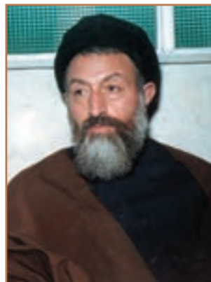
شهید آیت الله بهشتی

۳- حمله نظامی آمریکا به ایران: تسخیر سفارت آمریکا در تهران و دستگیری و بازداشت مأموران آمریکایی در ایران، دولت آمریکا را در شرایط نامناسبی قرار داد. از این رو در اردیبهشت ۱۳۵۹، آمریکا با طراحی یک عملیات پیچیده نظامی، اقدام به پیاده کردن نیروی نظامی در صحرای طبس کرد. مأموریت این گروه زبده نظامی تسخیر چند مرکز در تهران و بیرون بردن آمریکاییان بازداشتی از ایران بود. اما با عنایت خداوند، طوفان شن و کاهش دید خلبانان آمریکایی باعث سقوط چند فروند بالگرد نظامی و کشته شدن تعدادی از نیروهای مهاجم شد. بقیه نیز با به جای گذاشتن اسناد و مدارک مجبور به فرار شدند. ۱