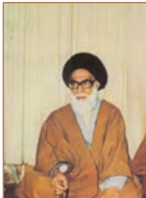
شهید آیت الله دستغیب