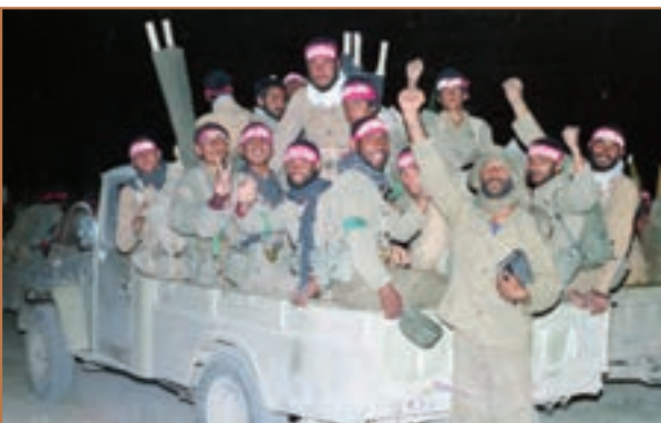
شور و صلابت در دفاع از میهن اسلامی

پس از عزل بنی صدر از فرماندهی کل قوا، امام خمینی خود فرماندهی کل قوا را برعهده گرفت. ویژگی مهم فرماندهی ایشان در آن مقطع زمانی، تحقیر دشمن و ترغیب و تشویق مردم و مسئولان به مقابله با نیروهای متجاوز بود. امام با تمسک به مفاهیم جهاد و شهادت و یادآوری حماسه عاشورا، میدان نبرد را به صحنه نمایش رشادت و شجاعت جوانان ایرانی تبدیل کرد. در نتیجه هدایت و رهبری حضرت امام، جلوه‌های زیبایی از ایثار و فداکاری در راه دین و میهن به نمایش گذاشته شد. امام خمینی شهادت طلبی جوانان را نشانه‌ای از عنایت خداوند بزرگ دانسته و با اشاره به انحطاط اخلاقی دوران پهلوی، فرمودند: « جوان‌هایی که می‌رفت به کلی از دست اسلام و مسلمین بروند، خداوند به ما برگرداند و آنها را ... [چنان] متعهد کرد که الان برای شهادت داوطلب می‌روند و در جبهه‌ها در حال جنگ تکبیر می‌گویند و نماز می‌خوانند و در شب‌ها با خدا مناجات می‌کنند». ۱