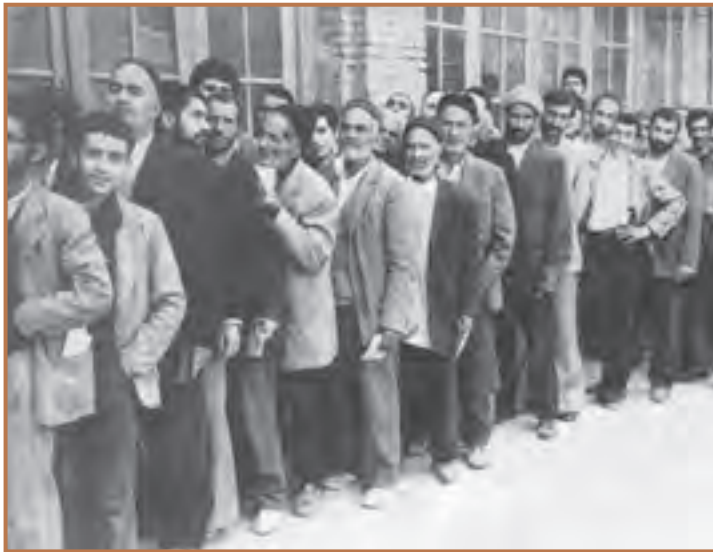
استقبال مردم از همه‌پرسی جمهوری اسلامی ایران

در تاریخ ۱۳ آبان ۱۳۵۸ سفارت آمریکا توسط دانشجویان پیرو خط امام تسخیر شد اما مهندس بازرگان که از این اقدام ناخشنود بود، استعفا کرد و امام (ره) نیز استعفای وی را پذیرفت. دانشجویان تداوم دشمنی دولت آمریکا با انقلاب اسلامی، ورود محمدرضا شاه به آمریکا و افزایش دخالت سفیر و سایر مأموران سفارت آمریکا در امور داخلی ایران را از دلایل تسخیر سفارت آن کشور اعلام کردند و پس از آن سفارت آمریکا در تهران، لانه جاسوسی نامیده شد. امام خمینی (ره)