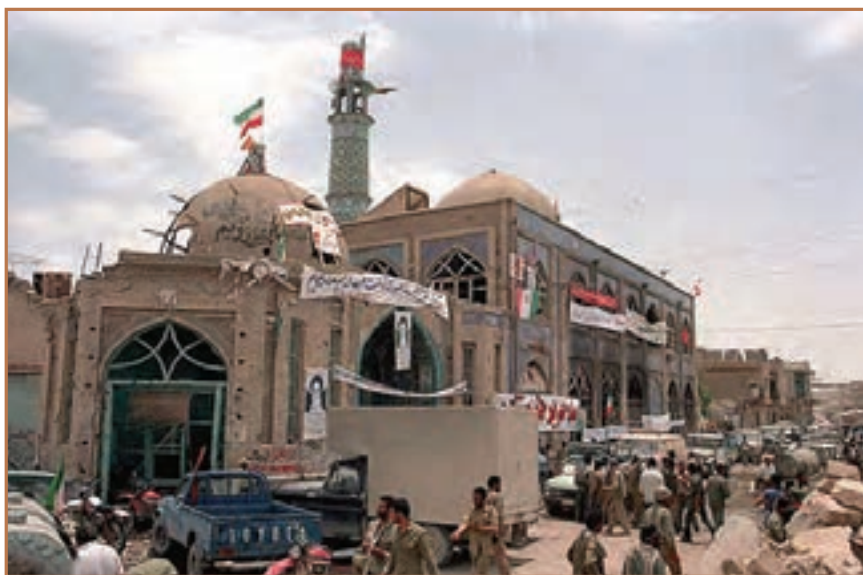
خرمشهر پس از آزادی از اسارت دشمن

امام خمینی به عنوان فرمانده کل قوا، ابتدا فرمان شکستن محاصره آبادان را صادر کرد؛ نیروهای ارتشی به همراه رزمندگان سپاهی و بسیجی، با یک عملیات برق آسا، آبادان را از محاصره نیروهای متجاوز صدام نجات دادند. ۱ دلاور مردان ایران زمین سپس در چندین رشته عملیات غرور آفرین که مهم ترین آنها فتح المبین ۲ و بیت المقدس ۳ بودند، صدها کیلومتر مربع از خاک ایران را از اشغال ارتش بعثی آزاد کردند. اوج حماسه شجاعت و رشادت ملت ایران در دوران دفاع مقدس، روز سوم خرداد ۱۳۶۱ در عملیات بیت المقدس تجلی یافت. روزی که رزمندگان ایران با درایت و شجاعت خود خرمشهر عزیز را از اشغال دشمنی که بر روی دیوار خرابه های آن نوشته بود «ما آمده ایم تا بمانیم»، آزاد کردند.