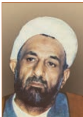
شهید آیت الله قدوسی

رسیدند. در ادامه آیت الله قدوسی دادستان کل کشور و امامان جمعه چندین شهر؛ آیت الله مدنی، آیت الله دستغیب، آیت الله صدوقی و آیت الله اشرفی اصفهانی توسط مجاهدین خلق به شهادت رسیدند. افزون بر مسئولان نظام، هزاران نفر از مردم عادی نیز به دست اعضای این سازمان تروریستی به شهادت رسیدند.