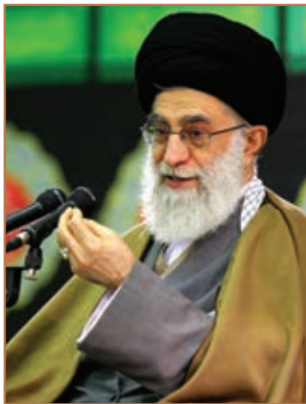
حضرت آیت‌الله خامنه‌ای رهبر معظم انقلاب اسلامی

بلافاصله پس از عروج ملکوتی بنیان‌گذار جمهوری اسلامی ایران، مجلس خبرگان رهبری تشکیل جلسه داد و به اتفاق آراء حضرت آیت‌الله سیدعلی خامنه‌ای را به دلیل داشتن شرایط و ویژگی‌های مندرج در اصل یکصد و نهم قانون اساسی جمهوری اسلامی ایران ۱ به مقام رهبری برگزید. حضرت آیت‌الله خامنه‌ای از ابتدای نهضت تا پیروزی انقلاب اسلامی، به عنوان شاگرد و پیرو حضرت امام خمینی (رحمة‌الله علیه) حضور و نقش فعالی در مبارزه با رژیم پهلوی داشتند؛ از این رو، بارها دستگیر، زندانی و تبعید شدند. ایشان در دوران جمهوری اسلامی و در شرایطی که کشور گرفتار توطئه‌های پیچیده دشمنان خارجی و ضدانقلاب داخلی و نیز جنگ تحمیلی بود، همچون یآوری بصیر و ثابت قدم در خدمت انقلاب و حضرت امام (رحمة‌الله علیه) بودند و مسئولیت‌های خطیری را از جمله دو دوره ریاست جمهوری عهده‌دار شدند. معظم‌له در تیر ۱۳۶۰، هدف حمله تروریستی گروهک منافقین قرار گرفته، به شدت جراحت برداشتند و به شرف جانبازی انقلاب اسلامی نایل آمدند. خبرگان ملت بر اساس چنین ویژگی‌ها و سوابقی، ایشان را برای رهبری انقلاب اسلامی، صالح، شایسته و لایق تشخیص دادند.