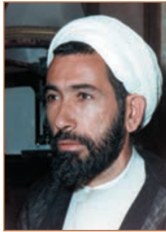
شهید دکتر محمد جواد باهنر