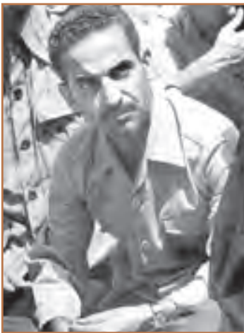
شهید محمد علی رجایی

یک ماه بعد از شهادت رجایی و باهنر مردم ایران به پای صندوق‌های رأی رفتند و حضرت آیت الله سیدعلی خامنه‌ای را به عنوان سومین رئیس جمهوری نظام جمهوری اسلامی ایران انتخاب کردند. ایشان