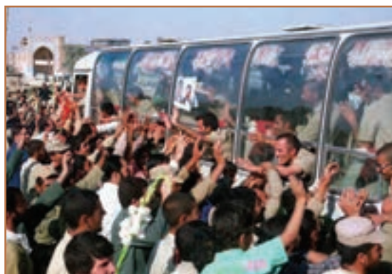
بازگشت آزادگان به میهن اسلامی

در سال ۱۳۷۰ ش. نیز سازمان ملل متحد رسماً، صدام رئیس رژیم بعثی عراق را به عنوان متجاوز و آغازکننده جنگ معرفی کرد. به این ترتیب جنگ هشت ساله‌ای که صدام به منظور سرنگونی جمهوری اسلامی آغاز کرده بود، با شکست مفتضحانه خود او به پایان رسید.