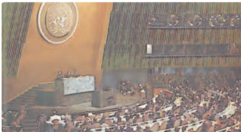
سازمان ملل متحد