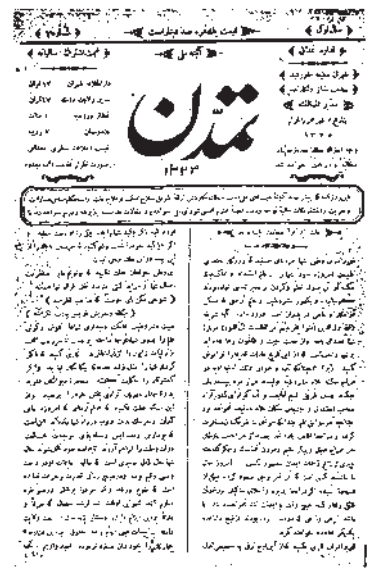
روزنامه فیهستان از نشریات دور با انقلاب مشروطه

۳- شتاب‌زدگی: یکی از مشکلات مهم در مورد مندرجات نشریات این است که چون با سرعت و عجله تهیه و چاپ می‌شوند، امکان بروز اشتباه در آنها زیاد است. به دلیل اهمیت مسأله زمان در تولید نشریات و به‌ویژه روزنامه‌ها، دست‌اندرکاران آنها به ناچار فرصت کافی برای تحقیق و بررسی پیرامون درستی یا نادرستی همه اخبار و جزئیات آنها را ندارند. عجله و محدودیت وقت همچنین موجب می‌شود که اشتباهات چاپی در نشریات راه یابد. بنابراین در بسیاری مواقع اخبار موجود در نشریات با وجود تازه و دست‌اول بودن، کامل نیستند.