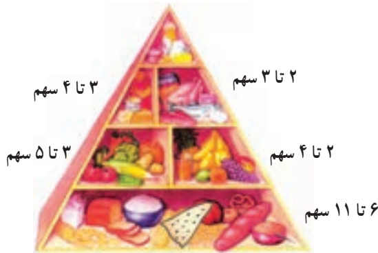
هرم غذایی نوجوان

نمونه‌ی رژیم غذایی برای افراد در دوره‌ی بلوغ