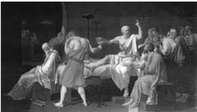
مرگ سقراط اثر نقاش فرانسوی «ژاک دیوید» که در سال ۱۷۸۷ به پایان رسانده است.

سرانجام روز موعود فرارسید، همسر و فرزندان سقراط برای آخرین دیدار به زندان آمدند. سقراط برای آنکه آنها شاهد مرگ او نباشند زودتر از دیگران در میان شیون و زاری با آنها وداع کرد و آنها را به بیرون از محوطه‌ زندان فرستاد. اینک او بود و تنی چند از یاران نزدیک و باوفایش؛ آن لحظه‌ شوم، نزدیک و نزدیک تر می‌شد. سقراط از جابرخواست و برای شست‌وشو به اتاق مجاور رفت. دوستانش هرکدام در گوشه‌ای زانوی غم به بغل گرفته بودند و در سکوتی اندوهبار، افول آفتاب را در افق نظاره می‌کردند. سقراط پس از استحمام به میان یاران بازگشت، بین آنها گفت‌وگوی مختصری گذشت. همان دم زندانبان وارد شد و به سقراط گفت: «من تو را نجیب‌ترین و شریف‌ترین کسی می‌دانم که تاکنون در این زندان با او سروکار داشته‌ام، آنها وقتی حکم نوشیدن زهر را از من می‌شنیدند خشمگین می‌شدند و به من ناسزا می‌گفتند، ولی می‌دانم که تو بر من خشم نمی‌گیری و مرا سرزنش نمی‌کنی، سعی کن این مرحله را نیز با متانت و بردباری تحمل کنی.» این را گفت و در حالی که اشک از دیدگان فرومی‌ریخت از در بیرون رفت. سقراط به دوستان گفت: «چه مرد خوبی است، در تمام مدتی که در زندان بودم به دیدن من می‌آمد و اکنون هم به حال من افسوس می‌خورد. ای کریتون سخن او را می‌پذیریم، بگو تا جام زهر را بیاورند.»