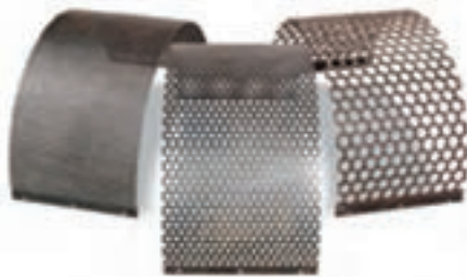
شکل ۳-۳ انواع غربال (توری)