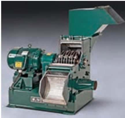
شکل ۲-۳ آسیاب چکشی