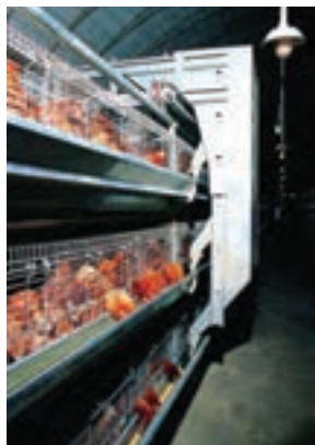
تصویر ۹-۴- دان خوری خودکار

آب خوری های چکه ای و فنجانای می توانند به نحوی نصب شوند که مرغ های دو قفس مجاور از آن استفاده کنند. آب خوری چکه ای مرسوم ترین نوع آب خوری در سیستم قفس است. میزان هدر رفتن آب در این سیستم به حداقل می رسد. به ازای هر ۶ تا ۸ قطعه مرغ تخم گذار باید یک عدد آب خوری چکه ای و به ازای هر ۱۰ تا ۱۲ قطعه مرغ تخم گذار یک عدد آب خوری فنجانای در نظر بگیرید ۴ (تصاویر ۹-۴ و ۱۰-۴).