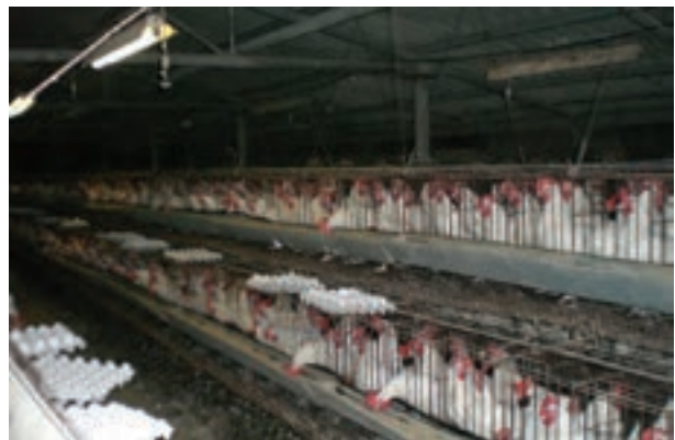
تصویر ۷-۴- جمع آوری تخم مرغ به روش دستی