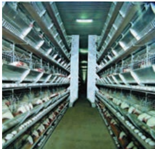
تصویر ۸-۴- جمع آوری تخم مرغ به روش خودکار