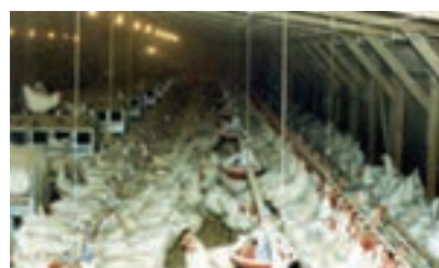
تصویر ۱۱-۴- انواع لانه تخم‌گذاری