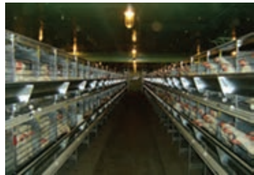
تصویر ۴-۴ - انواع قفس باتری