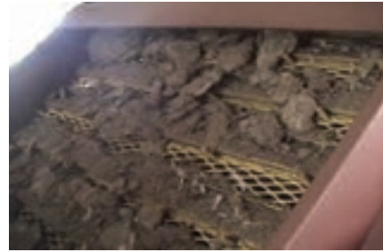
تصویر ۳-۷ کود در حال تخلیه از ماشین‌آلات مکانیکی

نوار نقاله: در قفس‌های دارای نوار نقاله، کود در زیر قفس بر روی صفحه‌ای از جنس پلاستیک ضخیم یا برزنت می‌ریزد. صفحه به صورت نوار بی‌انتهایی است که روزانه یک بار به حرکت درمی‌آید. در انتهای سالن روی هر نوار یک تیغه به صورت ثابت نصب شده است. تیغه کود را می‌تراشد و در چاله می‌ریزد.