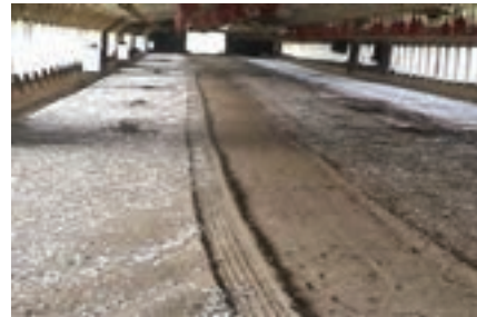
تصویر ۴-۷ تخلیه‌ی قسمتی از کود سالن پرورش به روش مکانیکی