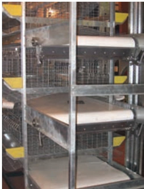
تصویر ۶-۷ انواع نوار نقاله