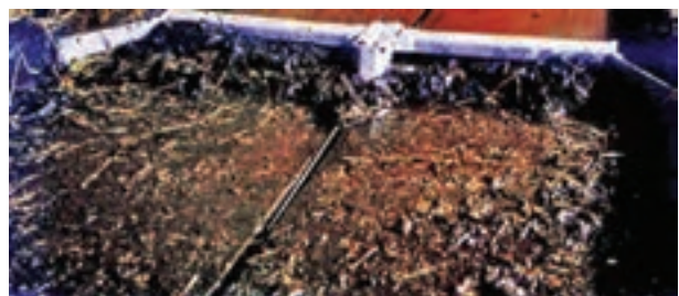
تصویر ۹-۷- تیغه‌ی جمع‌آوری کود