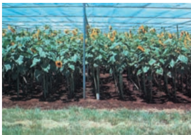
شکل ۱۳-۵- (راست) آفتابگردان در محیط بدون ازت - (چپ) مصرف ۱۸۰ کیلوگرم در هکتار ازت