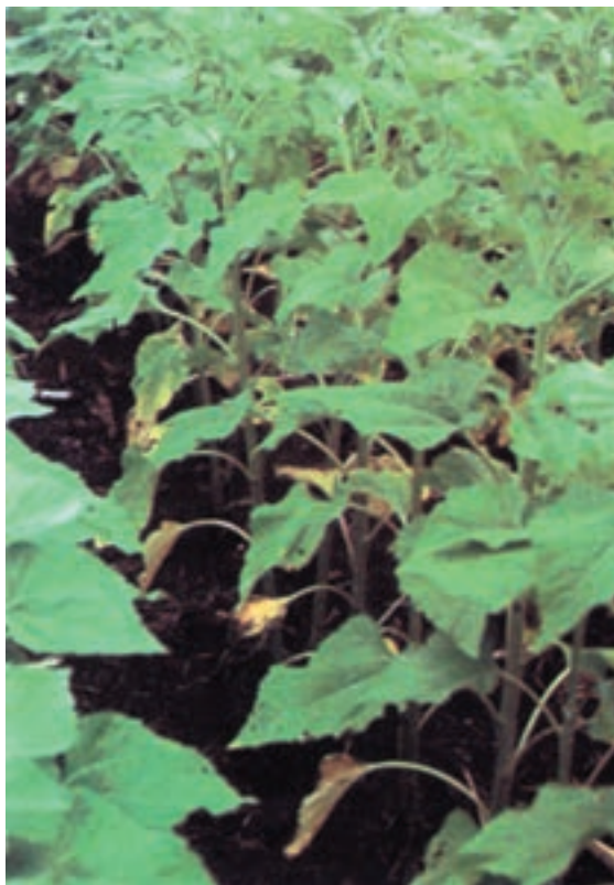
شکل ۱۴-۵- رنگ پریدگی برگهای پایین بر اثر کمبود ازت