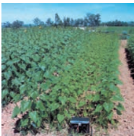
شکل ۱۲-۵- کمبود ازت در آفتابگردان