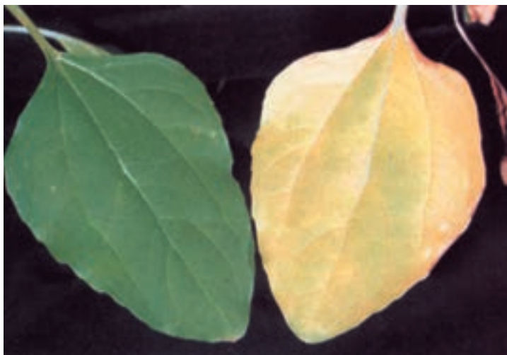
شکل ۱۵-۵- (راست) ازت غیرکافی - (چپ) ازت کافی در برگهای پایین آفتابگردان