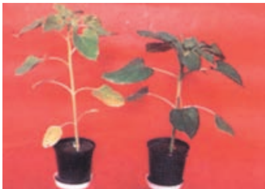
شکل ۱۶-۵- (چپ) ساقه نازک به دلیل کمبود ازت - (راست) ازت کافی