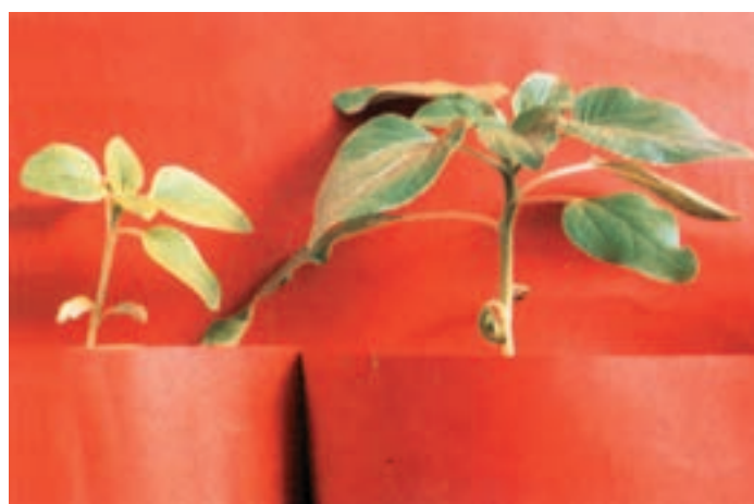
شکل ۱۱-۵- (راست) دارای ازت کافی در محلول غذایی (چپ) کمبود ازت در محلول غذایی