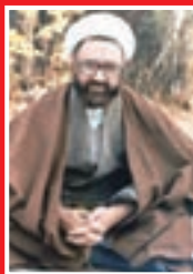
استاد شهید مطهری