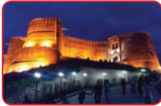
قلعه فلک الافلاک در خرم آباد یکی از اماکن مستحکم در دوران قدیم ایران