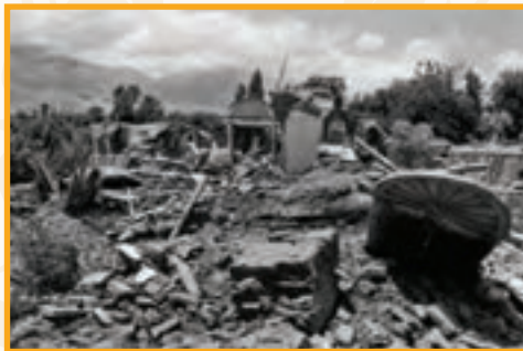
● زلزله رودبار : ساعت ۳۰ دقیقه باامداد روز ۳۱ خرداد ۱۳۶۹ ۷/۴ در مقیاس ریشتر