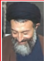
شهید دکتر بهشتی