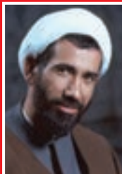
شهید دکتر باهنر