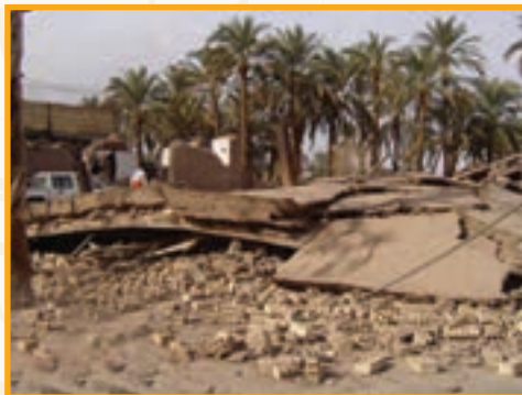
● زلزله بم : ساعت ۵/۲۶ باامداد روز ۵ دیماه ۱۳۸۲ ۶/۵ در مقیاس ریشتر