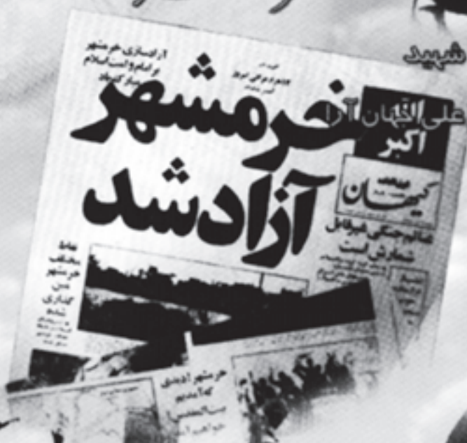
شهید محمد علی القبان آکبر