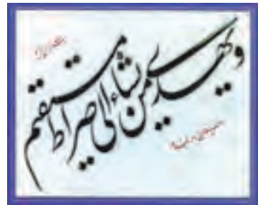
سوره یونس آیه ۲۵