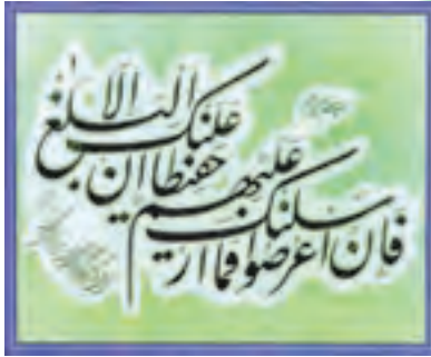
سوره شوری آیه ۴۸

پس از پیروزی انقلاب اسلامی، به دلیل درخواست‌های مکرر قرآن دوستان و قرآن پژوهان، رسانه‌های متنوع قرآنی در کشور ایجاد شده و رشد خوبی داشته است. برای آشنایی و استفاده شما دانش‌آموزان عزیز برخی از این رسانه‌ها معرفی می‌شود.