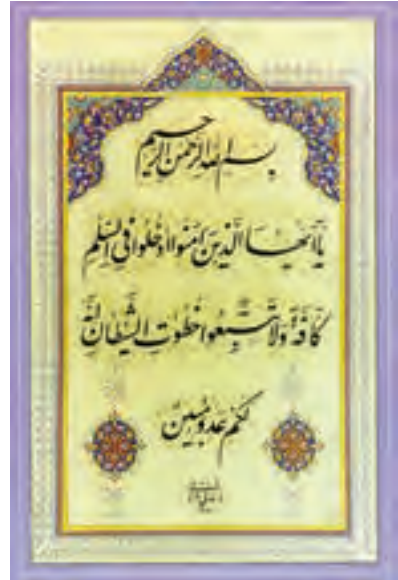
سوره بقره آیه ۲۰۸

یکی از تفاسیر بسیار خوب، تفسیر نمونه نام دارد که با همکاری جمعی از دانشمندان و زیر نظر آیت الله مکارم شیرازی در ۲۷ جلد تألیف شده است.