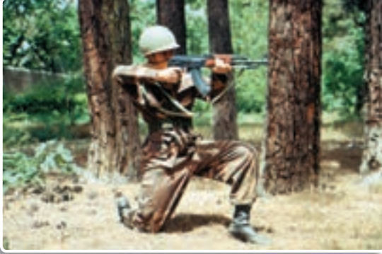
تصویر ۹-۱۲- حالت به زانو