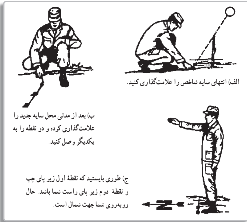
تصویر ۵-۹- روش جهت یابی به کمک سایه شاخص

۲- جهت یابی به کمک سایه شاخص : شاخص، چوب، میله یا هر شیء نسبتاً صاف و به طول تقریبی یک متر است که به صورت عمودی در زمینی مسطح نصب می‌شود. در این روش، پس از نصب شاخص، انتهای سایه آن را روی زمین با یک سنگ علامت گذاری می‌کنیم. پس از حدود پانزده تا بیست دقیقه محل جدید سایه شاخص را دوباره علامت گذاری می‌کنیم. حال اگر این دو نقطه را به یکدیگر وصل کنیم و طوری بایستیم که پای چپ روی نقطه اول و پای راست روی نقطه دوم باشد، روبه‌روی ما شمال و پشت سرمان نیز جنوب خواهد بود.