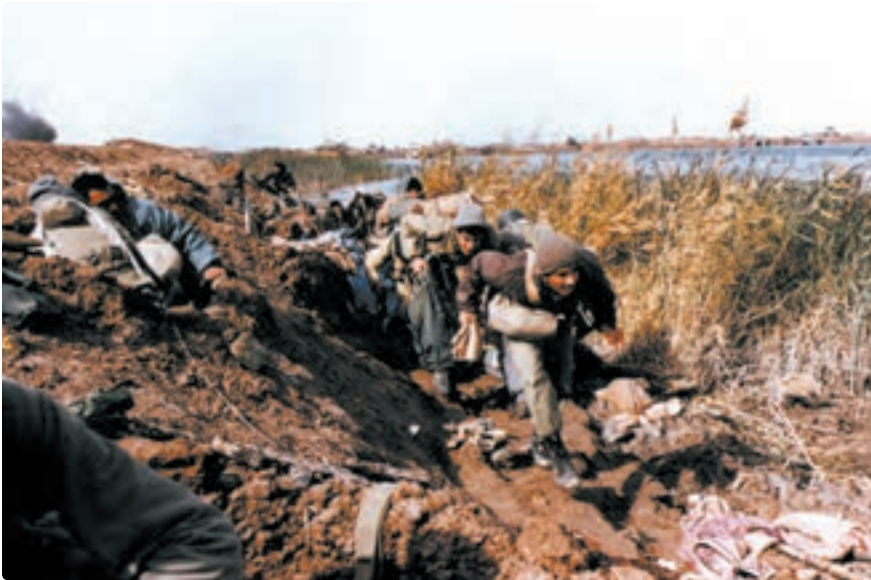
تصویر ۱-۹- دفاع رزمندگان در پشت یک خاکریز

۳- خاکریز: در مناطق باز و دشت‌ها، جهت درامان ماندن نفرات از دید و تیر دشمن، به وسیله ماشین‌آلات راه‌سازی، خاک را به ارتفاع حداقل ۲ متر در جلوی نیروهای خودی جمع می‌کنند که به آن خاکریز می‌گویند.