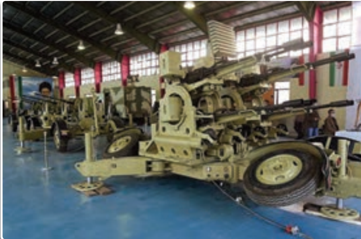
تصویر ۱-۸- سامانه دفاع هوایی مصباح

در یک تعریف ساده اقتدار به معنی آن است که فرد یا حکومت از چنان مقبولیتی برخوردار باشد که نظر او در موضوع یا مسائلی که پیش می‌آید، حرف آخر باشد و دیگران از آن اطاعت کنند.