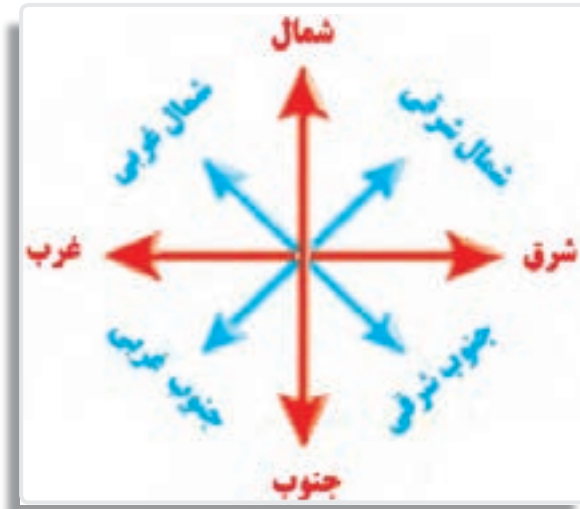
تصویر ۳-۹- جهت‌های اصلی و فرعی

۲- جهت‌های فرعی ۲ : به جهت‌هایی گفته می‌شود که در بین چهار جهت اصلی واقع شده‌اند. در تصویر زیر جهات اصلی و فرعی نمایش داده شده‌اند.