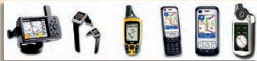
تصویر ۴-۹- انواع دستگاه‌های سامانه تعیین موقعیت جغرافیایی GPS

GPS مخفف سه کلمه Geographic Positioning Systems به معنی سامانه تعیین موقعیت جغرافیایی است. این سامانه از مجموعه ماهواره‌های موقعیت‌یاب جغرافیایی تشکیل شده که موقعیت پدیده‌های مختلف را بر روی کره زمین شناسایی و به کاربران مخابره می‌کند. کاربران با در اختیار داشتن گیرنده‌های قوی آنتن‌دار یا گیرنده‌های دستی موسوم به GPS در هر نقطه‌ای از کره زمین، حتی در حال حرکت می‌توانند موقعیت دقیق خود را دریافت کنند. گیرنده‌ها پس از برقراری ارتباط با ماهواره‌ها در فضا، مشخص می‌کنند که اکنون گیرنده در چه طول و عرض جغرافیایی و در چه ارتفاعی از سطح دریا قرار دارد و یا در چه سمتی و با چه سرعتی در حال حرکت است. این سامانه برای ردیابی یا راهبری کشتی‌ها، هواپیماها، خودروها کمک مؤثری می‌کند.