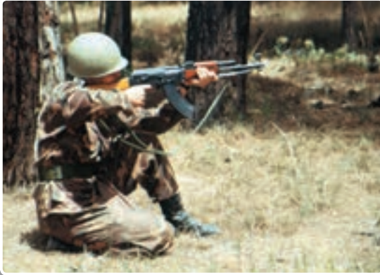
تصویر ۹-۱۳- حالت نشسته