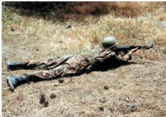
تصویر ۹-۱۴- حالت درازکش