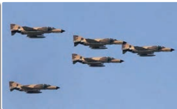
تصویر ۲-۸- رزمایش هوایی ارتش جمهوری اسلامی ایران مظهر اقتدار دفاعی ایران

خارجی در استان‌های مختلف کشور و نقاط حساس مرزی با حمایت بیگانگان و مزدورانی چون صدام (رئیس جمهور معدوم عراق) علیه این حکومت نوپا شورش کردند تا بلکه مانع به ثمر رسیدن انقلاب اسلامی شوند. ترور، کودتا، ادعاهای خودمختاری، بمب‌گذاری و سرانجام تهاجم گسترده صدام در خط مرزی بیش از ۱۲۰۰ کیلومتر، ارتش تازه استقلال یافته و سپاه پاسداران تازه تأسیس ما را با آزمونی بسیار بزرگ مواجه کرد. دشمنان ایران و اسلام از این نکته غافل بودند که ارتش و سپاه پشتوانه‌ای بزرگ و مردمی دارند که مصداق عینی آن بسیج مستضعفین بود. مردم چون انقلاب اسلامی را از خودشان می‌دانستند، تحت رهبری و فرماندهی امام خمینی (ره) به میدان آمدند و با یاری نیروهای مسلح درس‌هایی بزرگ به تاریخ و جنایتکاران و متجاوزان دادند.