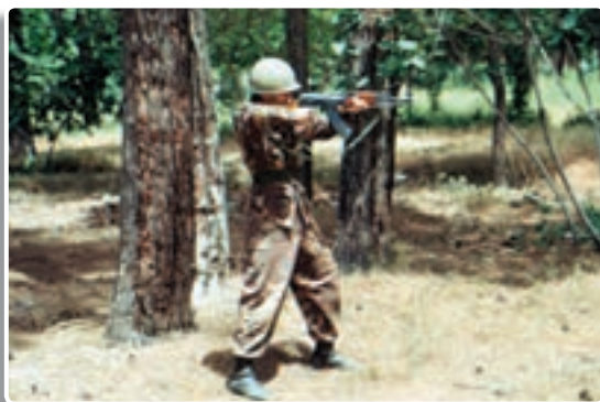
تصویر ۱۱-۹- حالت ایستاده