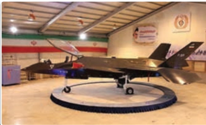
تصویر ۳-۸- هواپیمای جنگنده قاهر ساخت جمهوری اسلامی ایران