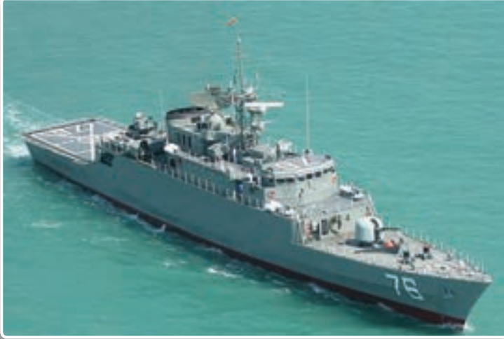
تصویر ۸-۴ - ناوشکن جماران مظهر اقتدار نیروی دریایی ارتش جمهوری اسلامی ایران