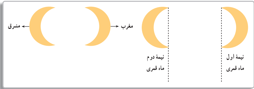
تصویر ۷-۹- روش جهت یابی به کمک ماه