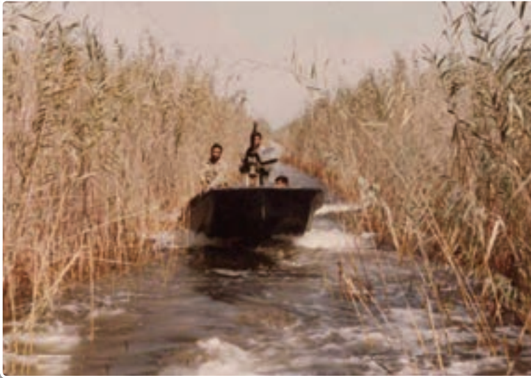
تصویر ۲-۹- رزمندگان در یکی از هورهای منطقه عملیاتی دوران دفاع مقدس

۴- هور: ماندن آب روی زمین را هور یا ماندآب می‌گویند. علت ماندن آب در این محیط نفوذناپذیری لایه‌های زیرین خاک است. معمولاً در هور علف و نی می‌روید و اطراف آن زیستگاه برخی جانوران و پرندگان می‌باشد؛ مانند هورالعظیم در خوزستان.