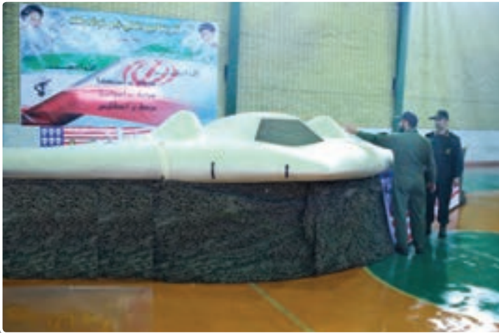
تصویر ۸-۵ - هواپیمای بدون سرنشین (بهباد) فوق پیشرفته جاسوسی آمریکا

شکار هواپیمای فوق پیشرفته جاسوسی آمریکا (RQ ۱۷۰) در سال ۱۳۹۰ توسط یگان سایبری سپاه پاسداران با همکاری ارتش جمهوری اسلامی ایران را به عنوان یکی از نمونه‌های اقتدار دفاعی کشور بررسی کنید.