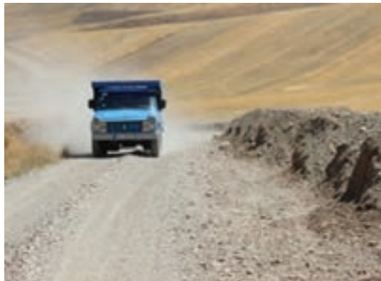
شکل ۱۴-۱- راه روستایی

■ شانه راه: بخشی از بدنه راه است که در دو طرف خط‌های عبور رفت و برگشت قرار داشته و برای توقف اضطراری وسایل نقلیه به کار می‌رود. شانه راه به دلیل افزایش فاصله دید در پیچ‌ها، نصب علائم راهنمایی و رانندگی، به وجود آوردن دید مناسب برای رانندگان، به وجود آوردن جایی برای انباشتن برف حاصل از برف‌روبی در راه به کار گرفته می‌شود.