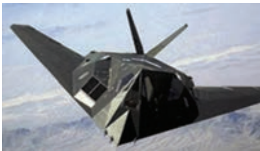
شکل ۱-۸- الهام از جغد برای ساخت هواپیمای بی صدا

استفاده از الگوی کلونی مورچه ها جهت اداره ترافیک شهری الهام از کرم خاکی در طراحی ماشین آلات حفاری تونل (TBM)