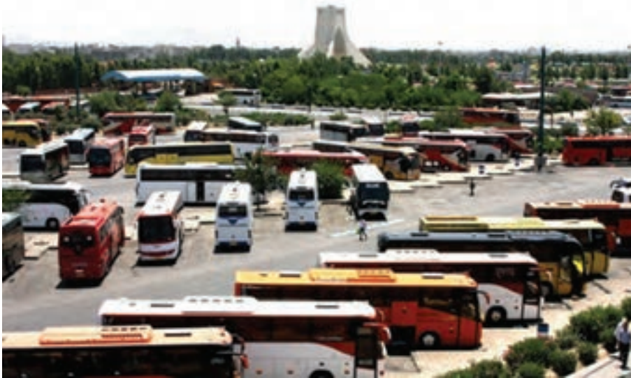
شکل ۱۳-۱-ب - نمایی از پایانه مسافری