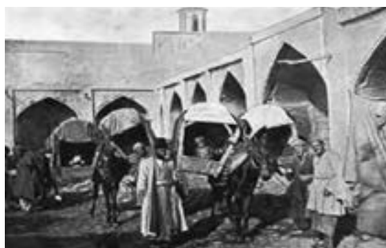
شکل ۴-۱- نمایی از کاروانسرا و چاپارخانه

جاده ابریشم ۱ از جمله راه‌های مهمی بوده که از اهمیت تاریخی زیادی برخوردار است. همچنین عنوان مهم‌ترین جاده در زمینه حمل‌ونقل کالا و مسافر و از قدیمی‌ترین مسیرهای مبادله کالای تجاری و دانش و فرهنگ بشری بوده و بین تمدن‌های یونانی و لاتین با آسیای شرقی، هندوستان و چین به مسافت ۱۲ هزار کیلومتری از روستای توان هوانگ چین تا شهر رم امتداد داشته است.