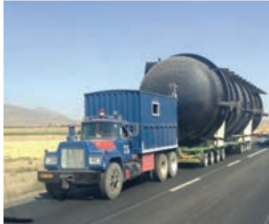
شکل ۱۶-۱- حمل بار ترافیکی

■ ایمنی جاده‌ای: تمهیداتی که برای ایمن بودن مردم، مسافران و راکبین در نظر گرفته می‌شود که از هرگونه آسیب جانی در امان باشند.