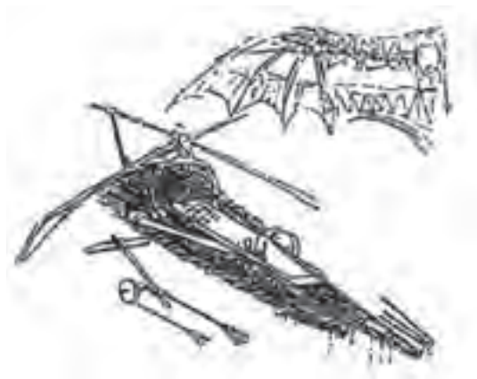
شکل ۱-۶- طراحی ماشین پرنده با الهام از پرندهگان

همواره خلقت منبع الهامی برای دانشمندان و طراحان بوده است. بسیاری از اختراعات کنونی موجود در جهان با الهام از طبیعت بیکران خداوند منان ساخته شده است. از آلبرت اینشتین ۱ نقل شده است که: به طبیعت با دقت نگاه کنید آنگاه جواب پرسش‌های خود را خواهید یافت. در بخش‌های مختلف حمل و نقل نیز دانشمندان با الهام از طبیعت دست به ساخت و طراحی وسایل و تجهیزاتی زده است که در ادامه به بخشی از آنها پرداخته شده است: