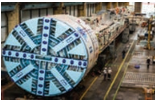
شکل ۱-۹- الهام از کرم خاکی برای ساخت دستگاه حفار تونل