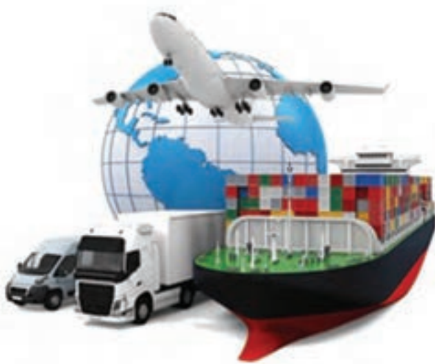
شکل ۱-۱- شیوه‌های حمل و نقل

اولین سؤالی که در این کتاب برای شما پیش می‌آید این است که حمل و نقل چیست؟ حمل و نقل به معنی جابه‌جایی مسافر یا بار از مبدأ به مقصد است. دسترسی انسان به کالا و خدمات از طریق شبکه جابه‌جایی (مسیرهای حمل و نقل) و وسایل جابه‌جاکننده (وسایل حمل و نقل) ایجاد می‌گردد.