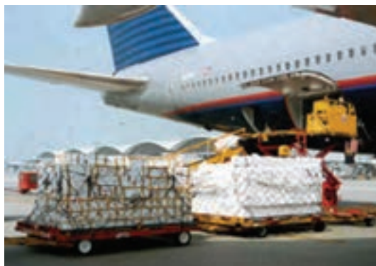
شکل ۱۸-۱- ترخیص کالا

۲- کیفیت زیرساخت‌ها: این شاخص مربوط به اندازه‌گیری کیفیت زیرساخت‌های کشور در حمل و نقل مانند راه‌ها، راه‌آهن، بنادر و فرودگاه‌ها و همچنین ارتباطات از راه دور و فناوری اطلاعات است.