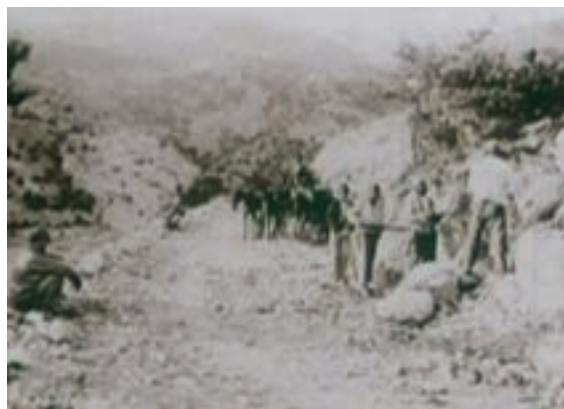
شکل ۵-۱- جاده ابریشم