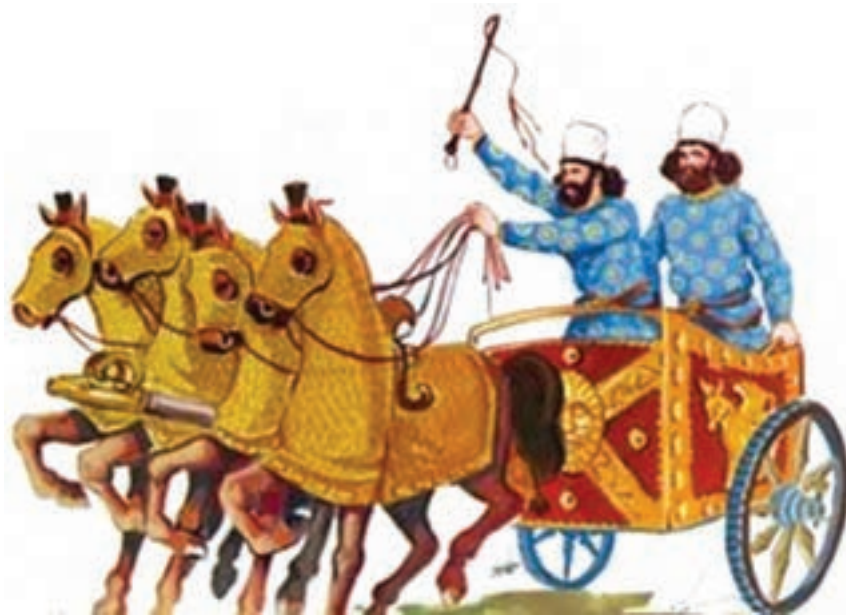
شکل ۱-۲- چاپارها در دوران هخامنشی

آیا تاکنون اندیشیده‌اید که راه‌ها چرا به وجود آمدند؟ چگونه به وجود آمدند؟ اولین جاده‌های محکم و امروزی را رومی‌ها ساختند. آنها برای جابه‌جایی سربازان و افراد و حمل و نقل کالا از جاده‌ها استفاده می‌کردند و به تدریج تشکیلات مرتبی برای حمل و نقل بار و مسافر ایجاد کردند. در ایران طی سال‌های ۴۰۰ تا ۵۰۰ قبل از میلاد، شبکه‌ای از راه‌ها به وجود آمد و پایتخت ایران با تمام ایالت‌ها ارتباط پیدا می‌کرد. در زمان‌های بسیار قدیم در کشور، چاپارها (نامه‌بر - پیک) در سراسر کشور فرامین، پیام و دستورات حکومتی را از نقطه‌ای به نقطه دیگر کشور می‌فرستادند (شکل ۱-۲).