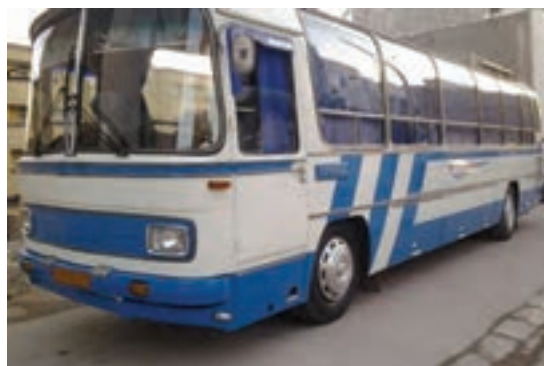
شکل ۱۲-۱. اتوبوس مسافربری