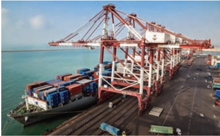
شکل ۱-۲۰- گمرک بندر شهید رجایی - بندرعباس

شود. هنگامی که یک کالا از گمرک کشور وارد و از داخل کشور عبور و از گمرک دیگری خارج می‌شود، از طریق عوارض گمرکی، عوارض جاده‌ای و سایر پرداخت‌ها، درآمدهای قابل توجهی را برای کشور ایجاد می‌نماید. همچنین افزایش مبادلات تجاری به‌خصوص در سطح بین‌المللی باعث انتقال فرهنگ و آیین هر کشور به کشورهای دیگر خواهد بود که این امر برای کشور عزیزمان و انتقال فرهنگ ایرانی - اسلامی بسیار مهم و ارزشمند است.