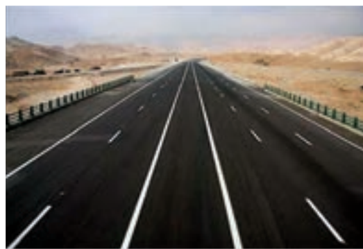
شکل ۱۹-۱- وجود زیر ساخت مناسب جاده‌ای و ریلی

۵- زمان تحویل بارها به مشتری در زمان برنامه‌ریزی شده یا زمان مورد انتظار: اندازه‌گیری به موقع زمان تحویل کالا با این الگو صورت می‌پذیرد. یکی از عوامل مهمی که در شرایط رقابتی بازار امروز جهان باید در نظر گرفته شود، تحویل به موقع کالا بوده و عدم تطابق زمان تحویل با برنامه از پیش تعیین شده غیر قابل قبول است.