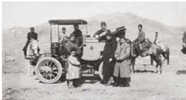
شکل ۳-۱- نمایی از اتومبیل کالسکه‌ای