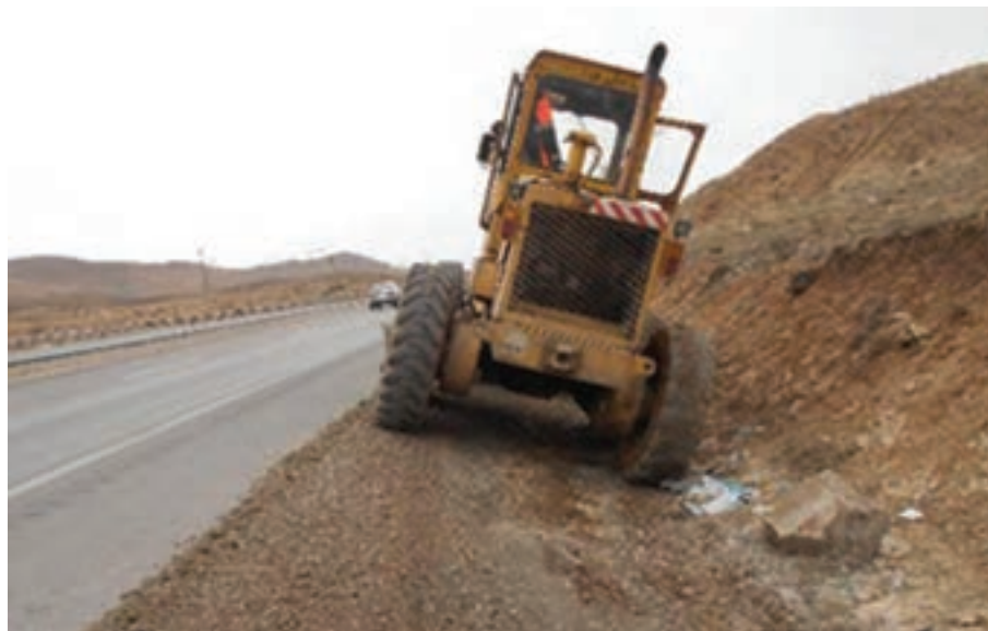
شکل ۱۵-۱- احداث شانه خاکی

■ شانه راه: بخشی از بدنه راه است که در دو طرف خط‌های عبور رفت و برگشت قرار داشته و برای توقف اضطراری وسایل نقلیه به کار می‌رود. شانه راه به دلیل افزایش فاصله دید در پیچ‌ها، نصب علائم راهنمایی و رانندگی، به وجود آوردن دید مناسب برای رانندگان، به وجود آوردن جایی برای انباشتن برف حاصل از برف‌روبی در راه به کار گرفته می‌شود.