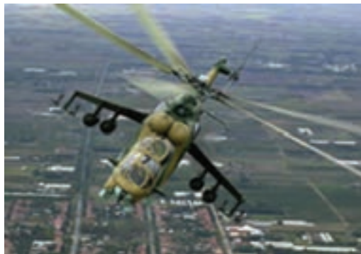
شکل ۱-۷- الهام از سنجاقک برای ساخت بالگرد

الگو برداری از بال جغد برای ساخت هواپیمای بی صدا، بال جغد دارای ساختارهایی است که به این پرنده اجازه می دهد بدون هیچ صدایی پرواز کند محققان از این موضوع الگو برداری کرده و هواپیماهایی که صدایی ندارند را تولید کرده اند (شکل ۱-۸).