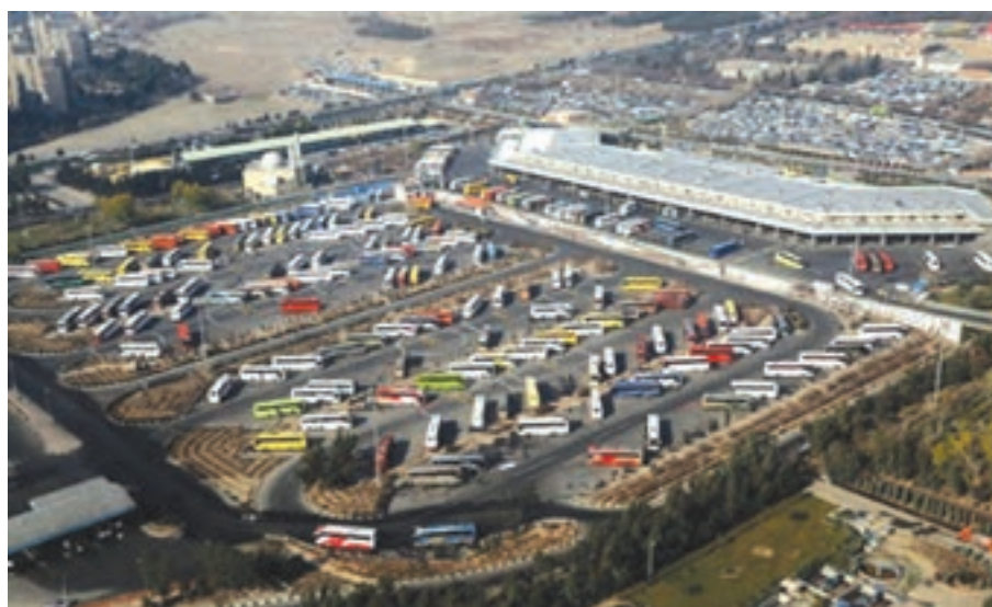
شکل ۱۳-۱. الف - نمایی از پایانه مسافربری