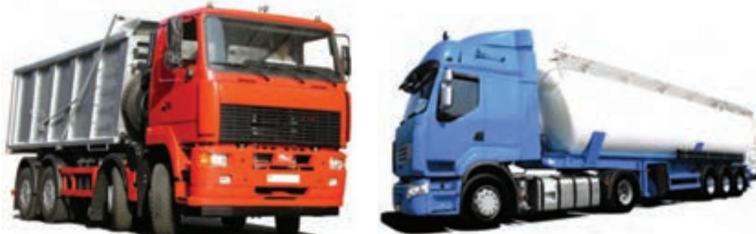
شکل ۱-۱۱- حمل و نقل جاده‌ای