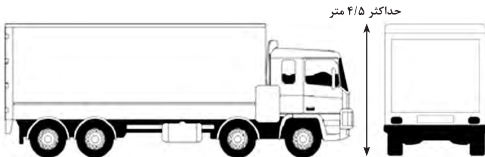
شکل ۲-۴- حداکثر ارتفاع مجاز وسایل نقلیه حمل بار

منظور از ارتفاع وسیله نقلیه با بار، فاصله شاقولی یا عمود بر سطح افقی از سطح جاده تا بالاترین نقطه بار یا بارگیر می‌باشد. حداکثر ارتفاع مجاز انواع وسایل نقلیه باربری برای انواع وسایل نقلیه طبق آیین‌نامه حداکثر ۴/۵ متر تعیین شده است. البته در برخی از راه‌های کشور این محدودیت ممکن است کاهش یا افزایش یابد. لازم به ذکر است علاوه بر این مقررات، آیین‌نامه‌های دیگری نیز در مورد نحوه بارگیری و ارتفاع مجاز بارگیری نسبت به ارتفاع دیواره‌های بارگیر نیز وجود دارد.