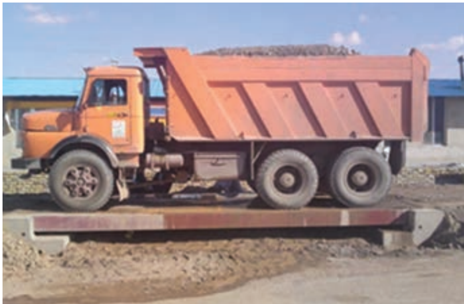
شکل ۹-۴- باسکول توزین کامیون