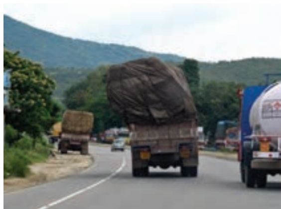
شکل ۱۱-۴- عدم تعادل و انحراف کامیون در جاده به دلیل بار زیاد

بار غیر مجاز (تناژ بیشتر از حد مجاز) می‌تواند موجب بروز خطر و مشکل در حمل و نقل جاده‌ای گردد. به صورت کلی هر وسیله نقلیه در زمان طراحی و ساخت با توجه به میزان ظرفیت مجاز، طراحی و ساخته می‌شود و کلیه اجزای محرکه و ایمنی آن بر همان اساس تولید می‌گردد. بنابراین در صورت عدم رعایت شرایط مندرج در کارت مشخصات وسیله نقلیه به نوعی عملکرد این اجزا نیز تحت تأثیر قرار می‌گیرد. یکی از مهم‌ترین این اجزا سیستم ترمز وسیله نقلیه است. به‌عنوان مثال عملکرد یک کارگر ساختمانی در زمان حمل بار توسط یک گاری چرخ‌دار را در نظر بگیرید. به‌طور قطع، اگر میزان بار قابل حمل توسط کارگر با آن چرخ، ۱۰۰ کیلوگرم باشد، آن کارگر باید نیروی لازم در حمل گاری را در سرازیری‌ها و سربالایی‌ها داشته باشد. در صورتی که میزان بار بیش از این مقدار باشد، به‌طور قطع علاوه بر امکان بروز آسیب بر جسم کارگر (در مورد وسیله نقلیه استهلاک بیشتر) امکان بروز حادثه به شدت