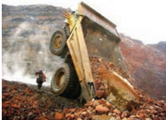
شکل ۱۰-۴- وازگونی کامیون بدلیل بار زیاد

در ادامه مطالب برای درک بهتر موضوع به دلایل وضع محدودیت‌های مربوط به وزن با جزئیات بیشتری پرداخته شده است.