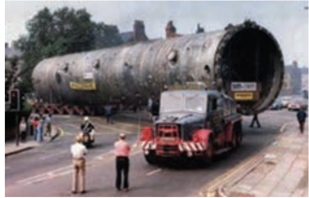
شکل ۸-۴- حمل بارهای غیر متعارف