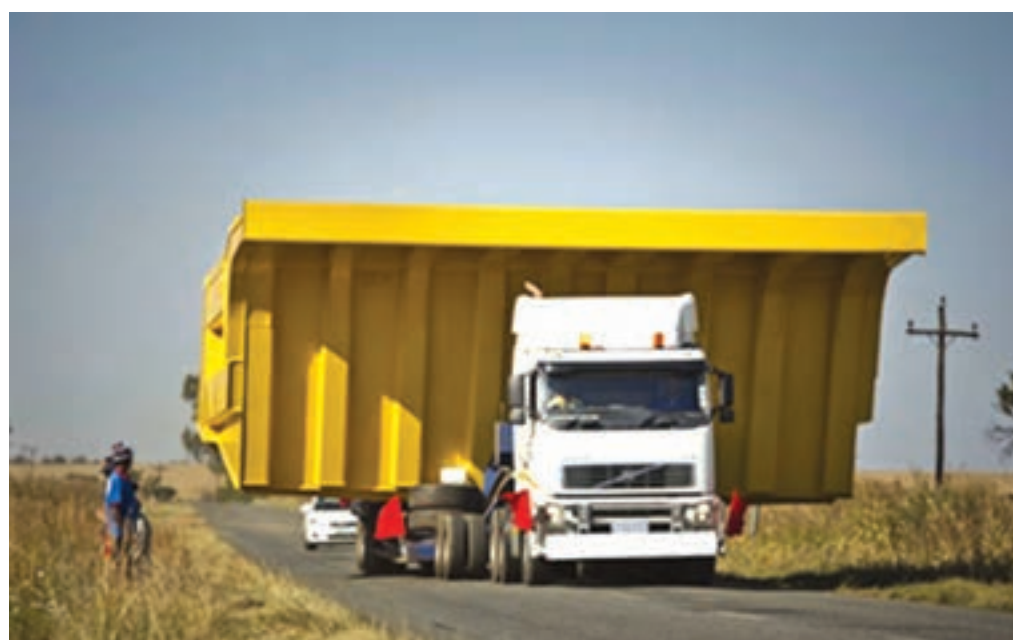
شکل ۷-۴- کاهش دید برای وسایل نقلیه در جاده

بارگیری بیش از ارتفاع و عرض مجاز موجب کاهش شدید سرعت وسیله نقلیه به خصوص در قوس‌ها، و کاهش قابلیت کنترل و تعادل وسیله نقلیه است.