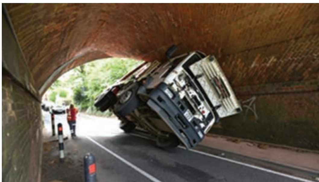
شکل ۴-۵- برخورد کامیون با تونل به دلیل افزایش ارتفاع

■ احتمال برخورد با تجهیزات نصب شده در ارتفاع کم در راه