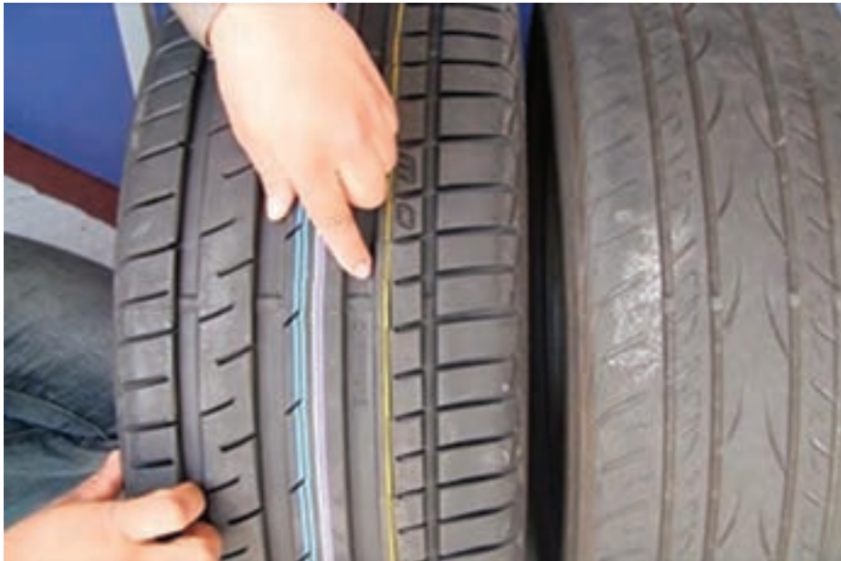
شکل ۱۳-۴- مقایسه فرسایش لاستیک‌ها در اثر وزن غیرمجاز بار