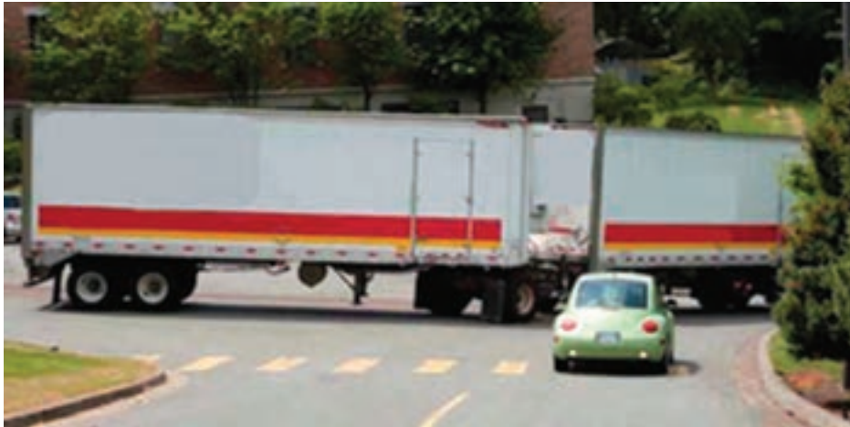
شکل ۱-۴- مشکلات وسایل نقلیه طویل

منظور از ارتفاع وسیله نقلیه با بار، فاصله شاقولی یا عمود بر سطح افقی از سطح جاده تا بالاترین نقطه بار یا بارگیر می‌باشد. حداکثر ارتفاع مجاز انواع وسایل نقلیه باربری برای انواع وسایل نقلیه طبق آیین‌نامه حداکثر ۴/۵ متر تعیین شده است. البته در برخی از راه‌های کشور این محدودیت ممکن است کاهش یا افزایش یابد. لازم به ذکر است علاوه بر این مقررات، آیین‌نامه‌های دیگری نیز در مورد نحوه بارگیری و ارتفاع مجاز بارگیری نسبت به ارتفاع دیواره‌های بارگیر نیز وجود دارد.