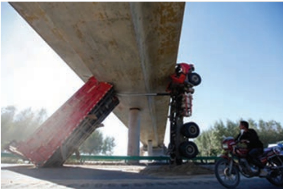
شکل ۴-۶- برخورد کامیون با پل و تجهیزات پل