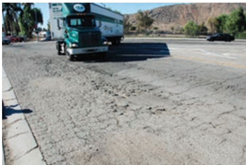
شکل ۱۲-۴- نمونه‌هایی از خرابی‌های روسازی ناشی از ترمز یا وزن زیاد وسایل نقلیه سنگین