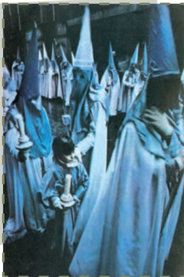
در پایان تسخیر مجدد اسپانیا به وسیله فردیناندو و ایزابلا (۱۴۹۲ م) محاکم تفتیش عقاید و تعقیب مسلمانان و کلیمیان به پا شد. حکم این دادگاه‌ها را جلادان داوطلبی که چهره خود را می پوشاندند، به موقع اجرا می گذاشتند.