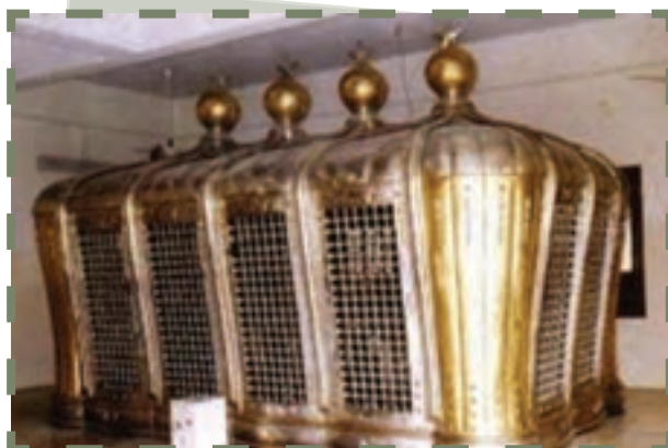
بارگاه و ضریح مطهر امامان علیهم السلام در قبرستان بقیع که در سال ۱۳۴۴ ق به دستور وهابیان ویران شد.