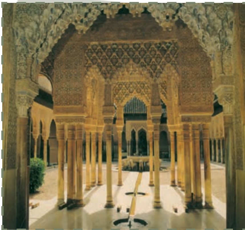
کاخ حمراء غرناطه

به نظر شما وضع غمبارِ مسلمانانِ اندلس ناشی از چه بود؟