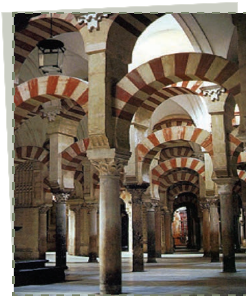
مسجد قرطبه اندلس

این خطوط به انجام رساندند. هنر سفالگری، ساختن سفالینه‌های زرین فام با اشکال پرنندگان و حیوانات، از ابتکارات هنر اندلسی است. همچنین منسوجات و فرش‌های زیبا و کنده‌کاری بر روی عاج، و نیز تزئینات بر روی اشیای فلزی، از دیگر جلوه‌های هنر اندلسی است. اندلس اسلامی در عرصه معماری نیز شکوفا بود. از نمونه‌های شگفت‌معماری این دوره، به این آثار می‌توان اشاره کرد: مسجد قرطبه، مدینه الزهراء در نزدیکی قرطبه، قصر جعفریه در سَرَقُسطَه، قصر کاستیلخو در نزدیکی مُرْسِیه، مسجد بزرگ اِشْبیلیه، مدینه الحمراء و قلعه‌های نظامی فراوان.