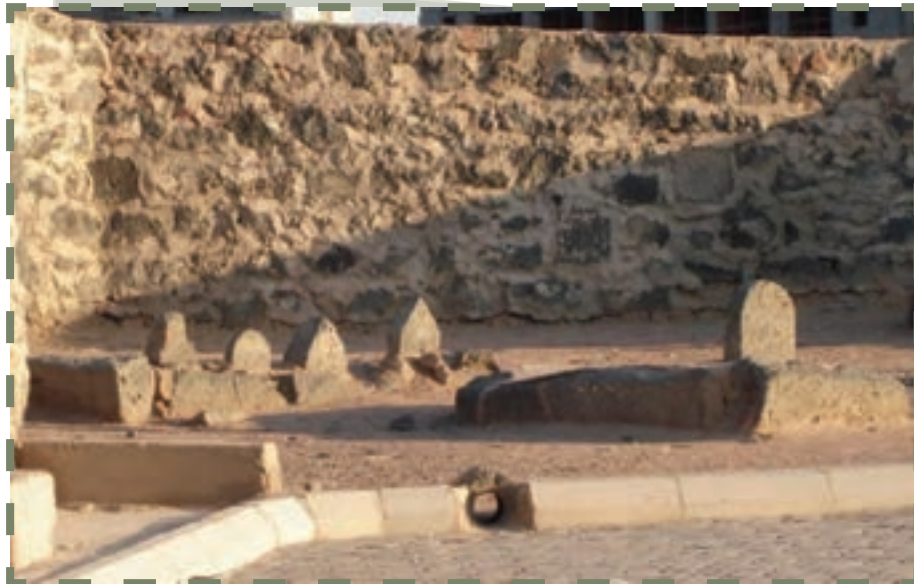
قبر امامان مدفون در بقیع پس از تخریب بارگاه مطهر آنان توسط وهابیان

نیز نامیده‌اند. بنابراین، می‌توان عوامل نامیده شدن مذهب اثنی‌عشری به مذهب جعفری را به طور خلاصه چنین بیان کرد: