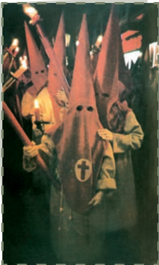
برادران هم عقیده در تظاهرات هفته مقدس

آنان، مسلمانان را مجبور به ترک کیش اسلام و قبول آیین مسیحیت می کردند، در غیر این صورت، به سختی شکنجه و زنده زنده در آتش سوزانده می شدند! اسقف اعظم شهر طلیطله فتوا داد که همه اعراب غیرمسیحی را با زن و فرزندان از دم تیغ شمشیر