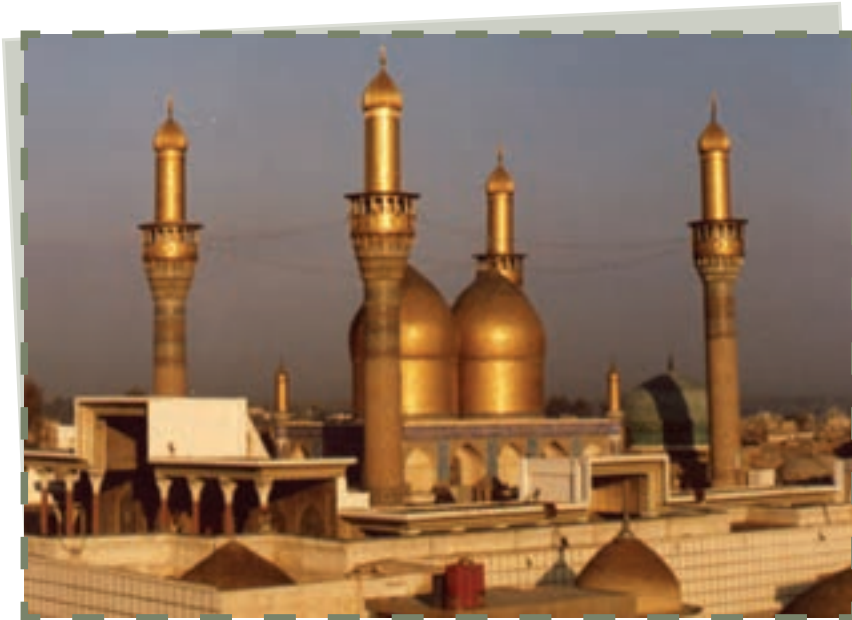
بارگاه امام کاظم و امام جواد علیهما السلام در کاظمین

یعنی تا سال ۱۶۹ق، در مدینه به تدریس، نقل حدیث و تربیت شاگردان مشغول بود و از طریق نمایندگانش با شیعیان در مناطق مختلف ارتباط داشت. در همین دوره، مهدی عباسی که احتمالاً اتفاق‌های فراوان امام به تهیدستان، وی را به وحشت انداخته و تصور می‌کرد امام قیامی را برضد او ترتیب خواهد داد، اقدام به حبس آن حضرت کرد، اما پس از آنکه امیرالمؤمنین علی علیه السلام در عالم رؤیا او را مورد عتاب قرار داد، امام را آزاد کرد.