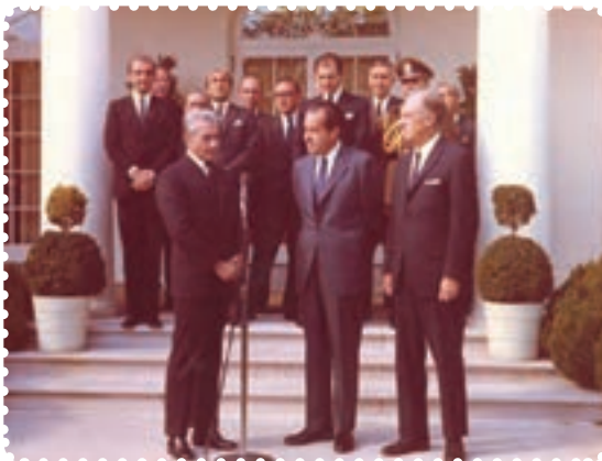
محمد رضا شاه در دیدار با نیکسون رئیس‌جمهور آمریکا

زندانی و تبعید کردن روحانیان، دانشمندان، فرهنگیان، استادان دانشگاه و نویسندگان پیامدهای منفی بسیاری برای رژیم داشت. براساس اعلام سازمان عفو بین‌المللی، ایران در سال‌های مذکور از نظر تعداد زندانیان سیاسی، مقام سوم را در جهان داشت. ۱