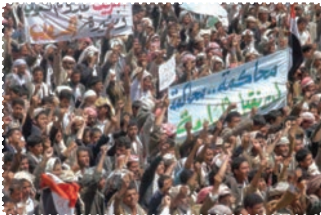
قیام مردم مسلمان یمن

کرد. سرانجام پس از ماه‌ها درگیری نظامی با سقوط طرابلس، حکومت قذافی سرنگون و خود او کشته شد. نکته جالب در مورد قذافی این است که وضعیت او بیش از هر دیکتاتوری به صدام شبیه بود. ت) بیداری اسلامی در یمن: جمهوری یمن در جنوب شبه جزیره عربستان واقع است و دارای نژادهای عرب (۸۶ درصد)، ترک، هندی، ایرانی و سومالیایی است. بیش از ۵۰ درصد یمنی‌ها شیعی مذهب‌اند که غالباً در منطقه صعده و شمال یمن ساکن‌اند. البته عمده شیعیان یمن زیدی‌اند که بعد از امام سجاد (ع)، زید بن علی (ع) را امام می‌دانند. مردم یمن در پی انقلاب‌های گوناگون در کشورهای اسلامی، اعتراضات و تظاهرات گسترده‌ای را در شهرهای مختلف علیه رژیم دیکتاتوری علی عبدالله