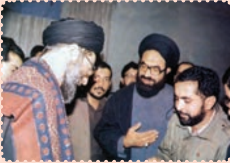
شهید عارف حسینی در محضر رهبر انقلاب اسلامی حضرت آیت الله خامنه‌ای

نهایت فعالیت‌های فکری و سیاسی وی باعث شد که دشمنان اسلام و تشیع وی را در مرداد ۱۳۶۷ به شهادت برسانند.