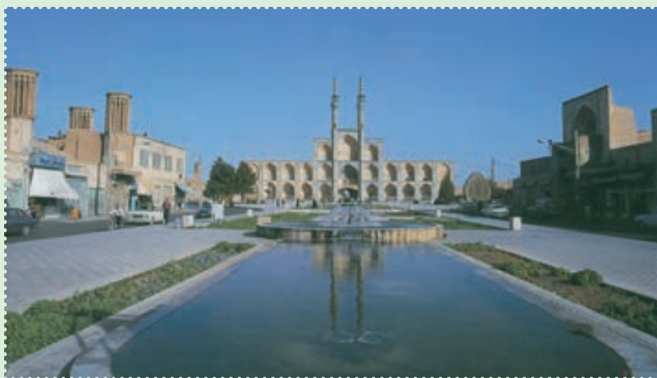
میدان تاریخی امیر چخماق در مرکز شهر یزد

با آنکه مغولان در آغاز ویرانی های بسیاری به همراه آوردند، ولی بر اثر آشنایی با فرهنگ ایران و اسلام، از طریق آنان فرهنگ، هنر و تمدن ایران و اسلام رواج یافت. پس از پایان حکومت ایلخانان، حکومت های ملوک الطوائفی و محلی متعددی چون تیموریان، آل جلائر، آل مظفر، سرداران و آل کرت، اتابکان، قراقویونلوها و آق قویونلوها طی قرن های هشتم و نهم قمری بر ایران حکومت کردند، اما هیچ کدام نتوانستند یکپارچگی ایران را حفظ کنند. سرانجام در سال ۹۰۷ق، حکومت صفوی توانست پس از