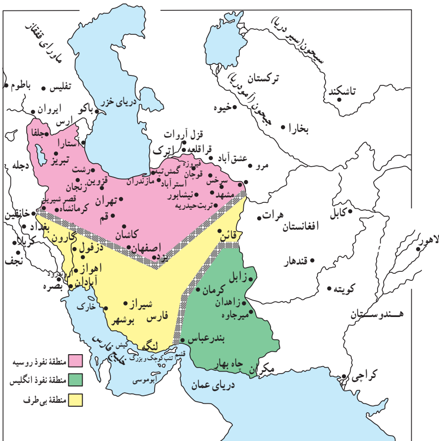
نقشه تقسیم ایران براساس قرارداد ۱۹۰۷

افغانستان که دارای ارزش حیاتی برای دفاع از هند بود، قلمرو نفوذ انگلستان مقرر گردید. قسمت سوم که شامل کویرها و بیابان‌های بی‌آب و علف بود، منطقه بی‌طرف و متعلق به ایران شناخته شد. منظور از این کار هم آن بود که دو دولت تا حدودی از یکدیگر فاصله بگیرند و از برخوردهای احتمالی بین آنها، جلوگیری شود.