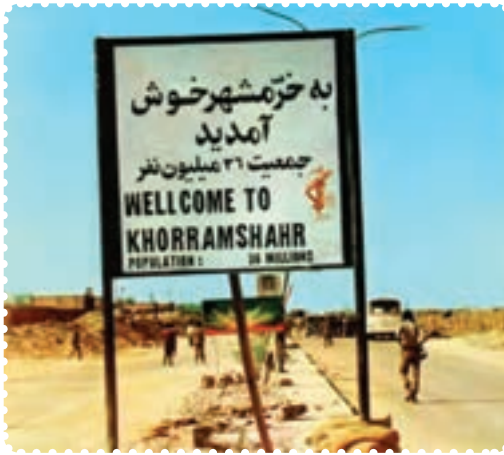
ورودی شهر خرمشهر در زمان جنگ تحمیلی

کمک به دفاع ملی دریغ نورزیدند. پس از چند هفته، دشمن متجاوز دریافت که خیال تصرف ایران، خام