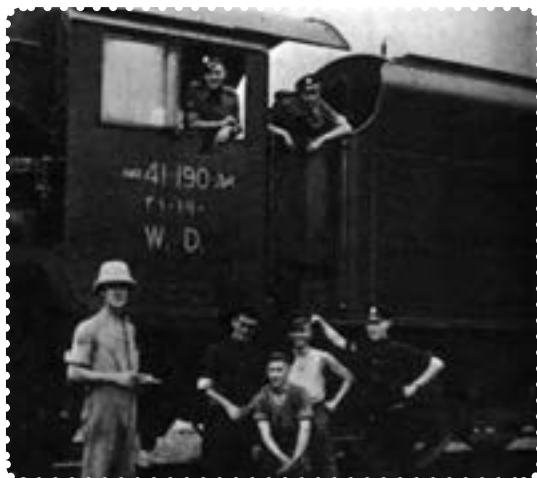
اشغالگران از راه آهن ایران برای مقاصد نظامی خود استفاده می‌کردند.

سرانجام در سوم شهریور ماه ۱۳۲۰/۲۵ اوت ۱۹۴۱ سفیران انگلیس و شوروی، طی