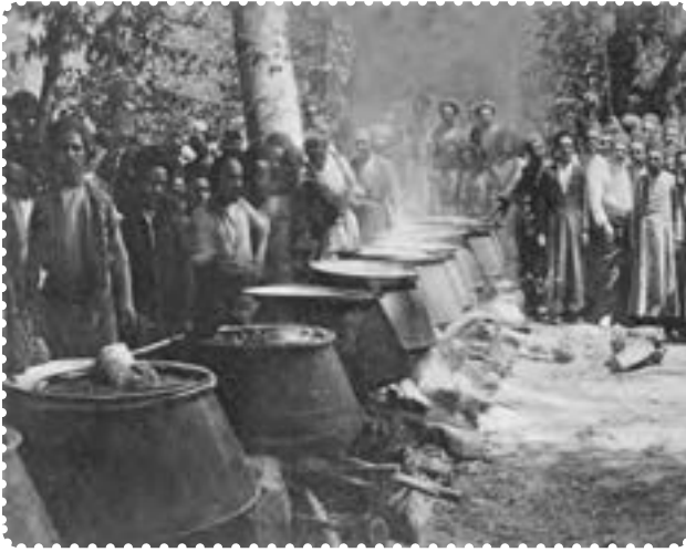
دیگ‌های غذا در سفارت انگلیس برای مشروطه خواهان

بدون پناهندگی به سفارت انگلستان، می‌توانستند به خواسته‌های خود دست یابند. دولت انگلستان بر خلاف دولت روسیه که از دربار حمایت می‌کرد، به ظاهر پشتیبان نهضت مشروطه بود. انگلستان، برای نیل به مقاصد و منافع استعماری‌اش این سیاست را در پیش گرفته بود. اما کسانی که از سیاست پیچیده استعمار انگلستان درک روشنی نداشتند