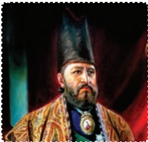
میرزا تقی‌خان امیرکبیر

کوتاه صدارت، برای حفظ تمامیت ارضی و مبارزه با دخالت بیگانگان، تلاش زیادی کرد. در روزگار او، سیاست داخلی و خارجی ایران به شدت تحت تأثیر دولت‌های بیگانه، به‌ویژه روسیه و انگلیس قرار