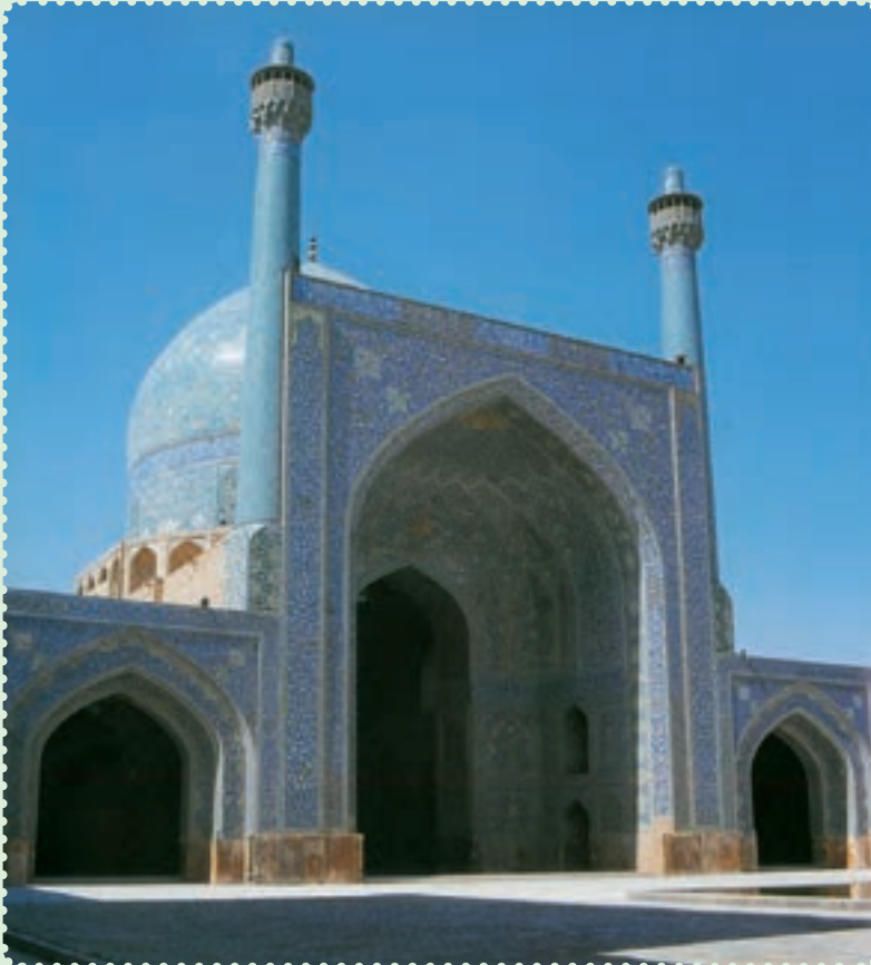
مسجد امام از آثار دوره صفوی در اصفهان

صفویان حکومتی تشکیل دادند که بیش از دو سده دوام یافت. در پرتو این حکومت مقتدر، علاوه بر برقراری امنیت و رونق اقتصادی، پیشرفت بازرگانی و کشاورزی و صنعت، تشکیل ارتش منظم و سیاست خارجی مقتدرانه، آنها توانستند فرهنگ و تمدن ایران و اسلام را بار دیگر شکوفا کنند. هنر و معماری در این دوره نیز از نظر کمی و کیفی توسعه و تحول یافت. اصفهان، پایتخت صفویان، دارای مجموعه‌ای از معماری عصر صفوی است که نشان می‌دهد، معماری ایرانی