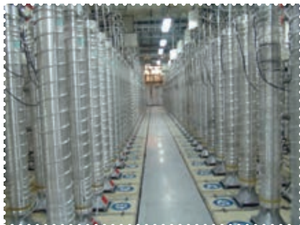
تأسیسات هسته ای نظنز

دستیابی به فناوری هسته ای صلح آمیز، یکی از عظیم ترین و افتخار آمیزترین دستاوردهای فنی و علمی انقلاب اسلامی است. دسترسی به چرخه سوخت هسته ای، یعنی فرایند تبدیل اورانیوم طبیعی به