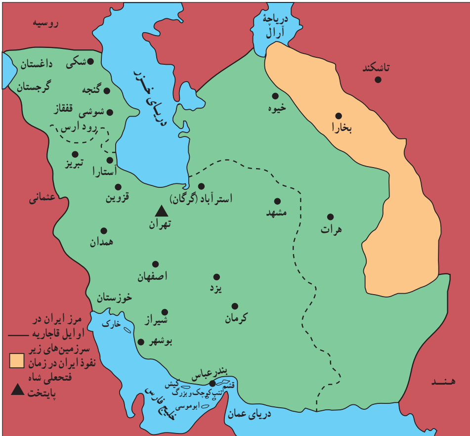
قلمرو ایران (در اوایل قاجاریه)

هجوم سیاسی-نظامی دولت‌های استعمارگر اروپایی، زمینه‌ساز بیداری اسلامی در ایران شد. عالمان دین برای مبارزه با نفوذ بیگانگان و مخالفت با سلطه استعماری از قواعد قرآنی و اسلامی مانند «قاعدة نفی سبیل»، «جهاد» و «فتوا» بهره بردند. عالمانی همچون آیت‌الله شیخ جعفر نجفی کاشف الغطاء و آیت‌الله سید محمد مجاهد، که مقیم عتبات عالیات بودند، و ملا احمد نراقی و برخی از علمای ایران علیه روس‌ها فتوای جهاد دادند، و بعضی از آنها خود نیز در جبهه‌های جنگ شرکت کردند. این امر موجب شد که مردم ایران و حتی شهرهای نجف و کربلا، مشتاقانه در مناطق اشغالی به مقابله با روس‌ها پردازند و جلوی پیشروی آنان را بگیرند.