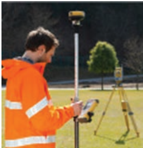
شکل ۷-۳- پیااده کردن تک نفره با RPU

سیستم تک نفره‌ای که در بالا شرح داده شد، برای پیااده کردن یک نقطه در جهت و فاصله معین از نقطه کنترلی که توتال استیشن در آن نصب شده به کار می‌رود. نقشه بردار دائماً صفحه نمایش RPU را که موقعیت او را نشان می‌دهد قرائت می‌کند. لذا آن قدر تغییر مکان می‌دهد تا در جهت و فاصله