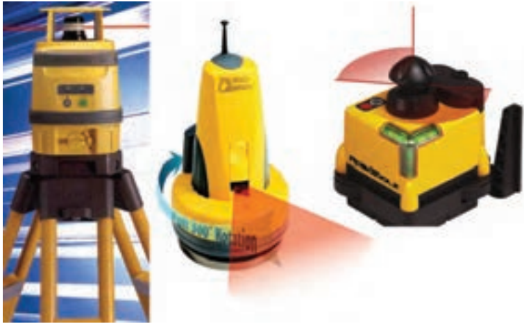
شکل ۷-۵ - تراز یاب چرخنده

پیاده کردن نقاط با GPS و PDA : همانند نقشه برداری تک نفره با RPU در اینجا به جای به کارگیری توتال استیشن برای تعیین موقعیت شاخص، از یک GPS استفاده می شود. برای این منظور آنتن GPS روی شاخص نصب شده و توسط کاربر در نقاط مورد نظر قرار داده می شود. GPS به صورت آنی نقاط را تعیین موقعیت نموده و نتیجه را روی صفحه کامپیوتر نمایشگر که روی شاخص نصب شده است به نام (PDA (Personal Data Assisstant در کنار نقشه طرح نمایش می دهد. کاربر با نگاه به طرح آن قدر جا به جا می شود تا روی نقطه مورد نظر قرار گیرد. البته برای افزایش دقت در این روش، نیاز به دو گیرنده GPS می باشد که توضیح آن در فصل ششم ارائه شده است.