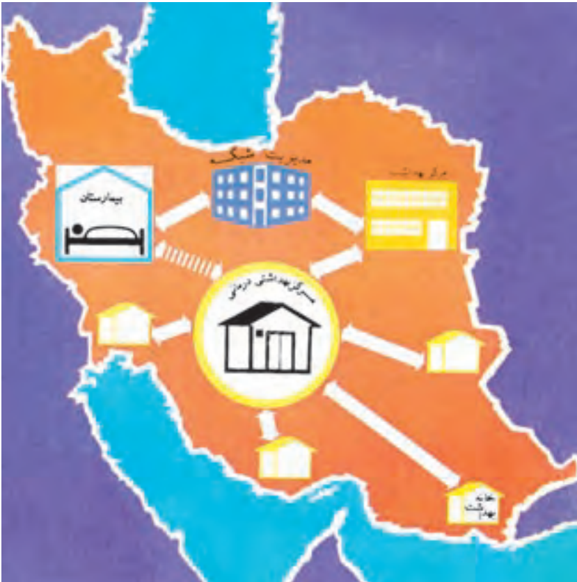
شکل ۴-۲- نظام عرضه خدمات بهداشتی