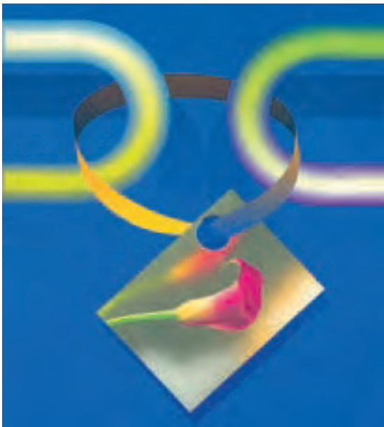
شکل ۶-۲- رابطین بهداشت

رابطین بهداشتی، نیروهای داوطلب مردمی هستند که، در راستای اصل مشارکت مردم در تأمین و ارتقای سلامت جامعه، داوطلبانه قدم در این راه گذاشته اند. این افراد، پس از طی دوره های آموزشی و کسب اطلاعات لازم، به عنوان «رابط بهداشتی» در کنار زندگی روزمره فعالیت می نمایند.