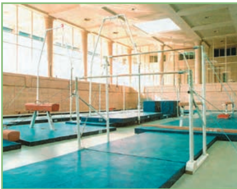
شکل ۲-۸ تجهیزات و وسایل مورد نیاز رشته ی ژیمناستیک

وسایل و تجهیزات بازی: برای آقایان، خرک حلقه، دارحلقه، خرک پرش، و پیش تخته، بارفیکس، پارالل، زمین با ابعاد و اندازه و جنس مخصوص (به ویژه برای حرکات زمینی)؛ و برای بانوان، چوب موازنه، خرک پرش و پیش تخته، پارالل بانوان (بارفیکس بانوان)، زمین با ابعاد و اندازه و جنس مخصوص (تشک)، در برگزاری مسابقات ژیمناستیک ضروری هستند (شکل ۲-۸).