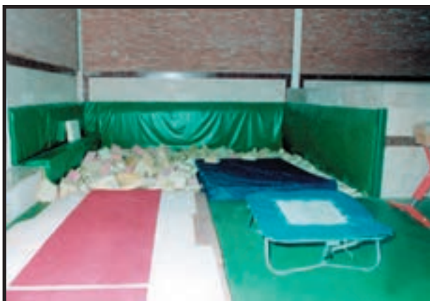
شکل ۱-۱۰ — چاله‌ی ابر فضایی ایمن برای اجرای حرکات ژیمناستیک

— انبار کردن وسایل و تجهیزات قابل اشتعال: انبار کردن تشک‌های ژیمناستیک، کشتی و سایر رشته‌های ورزشی، خطراتی جدی را به دنبال دارند. توصیه‌های لازم برای طراح انبار شامل یک حصار مقاوم یک ساعته، دودسنج سیم‌کشی شده به تابلوی فرمان کنترل و باز نشدن درهای انبار به مسیرهای فرار است. چاله‌ی ابر، که در سالن‌های ژیمناستیک و مهدکودک از آن‌ها استفاده می‌شود، قابل اشتعال و خطرناک هستند (شکل ۱-۱۰).