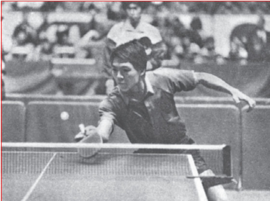
جیانگ جیالیانگ قهرمان جهان در حال دراپ شات

استپ بلوک (استپ ریسو): یکی دیگر از انواع فنون دفاعی در مقابل ضربه‌های حمله‌ای است که مراحل و کلیات نحوه‌ی اجرای آن مشابه فن بلوک است، اما باید در لحظه‌ی تماس توپ با راکت، راکت را کمی به عقب بکشید تا از فشار توپ و سرعت برگشت آن کم شود. با انجام این عمل ریتم عادی رفت و برگشت توپ به هم می‌خورد و یک برگشت غیرقابل انتظار به طرف حریف فرستاده می‌شود.