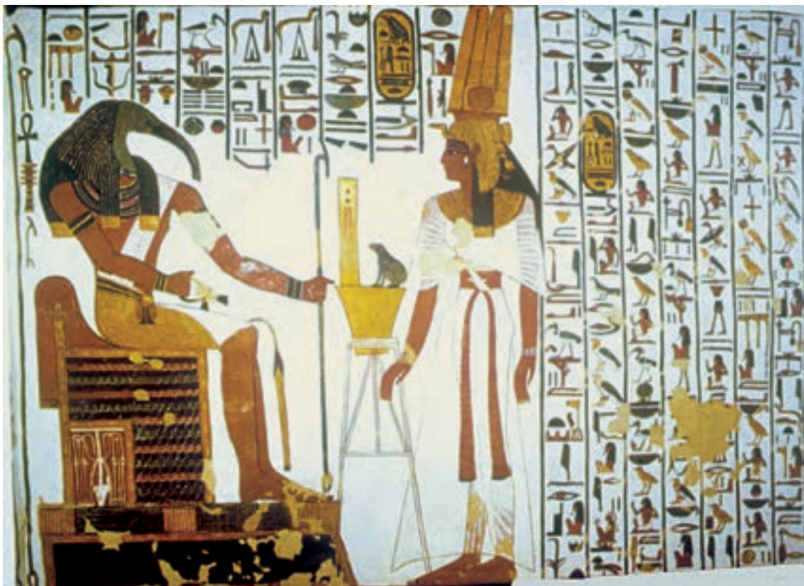
تصویر ۳-۶- نِفرتاری و خدای «توت» بخشی از دیوار نگاره، ابوسمبل، حدود ۱۲۵۵ ق. م خط هیروگلیف، علاوه بر انتقال مفاهیم به موازات دیوار نگاره‌ها، نقشی مؤثر در آراستن فضاها و داخلی بناهای مصری ایفا می‌کرد.

صحنه‌های نقاشی کم‌تر با زمان و مکان مشخصی ربط داشت و پس زمینه‌ها معمولاً دارای طرحی ساده و قراردادی بود. نقاش مصری پرسپکتیو را نمی‌شناخت و اغلب موضوع موردنظرش را در چند بخش ثبت می‌کرد. در نقاشی‌های به‌جا مانده، پایین‌ترین بخش نشان‌دهنده‌ی پیش زمینه است. در هر بخش اشیای عقب‌تر یا داخل اشیای دیگر و یا در بالای آن نشان داده می‌شوند. گاه نیز قطعات و یا پیکرهای جداگانه مراحل مختلف یک عمل را می‌نمایانند. در هر حال اصل بر آن بوده است که نمایش اشیاء و صحنه‌ها صورت توصیفی داشته باشد، نه چنان که در لحظه یا زمان و مکانی معین به نظر آید.