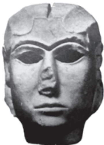
تصویر ۱-۳ سردیس زن، ۳۵۰۰ ق.م، مرمَر سفید، بلندی حدود ۲۰ سانتی‌متر محل نگهداری موزه عراق، بغداد

در بین‌النهرین تمایزی میان هنر و صنعت وجود نداشت و هنرمندان از احترام بالایی برخوردار بودند. آن‌ها مهارت خود را موهبت الهی می‌دانستند.