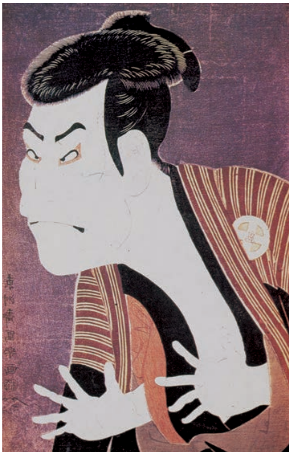
تصویر ۱۷-۳. بازیگر کابوکی باسমে، اواخر سده‌ی هجدهم میلادی. اثر توشوسای شاراکو