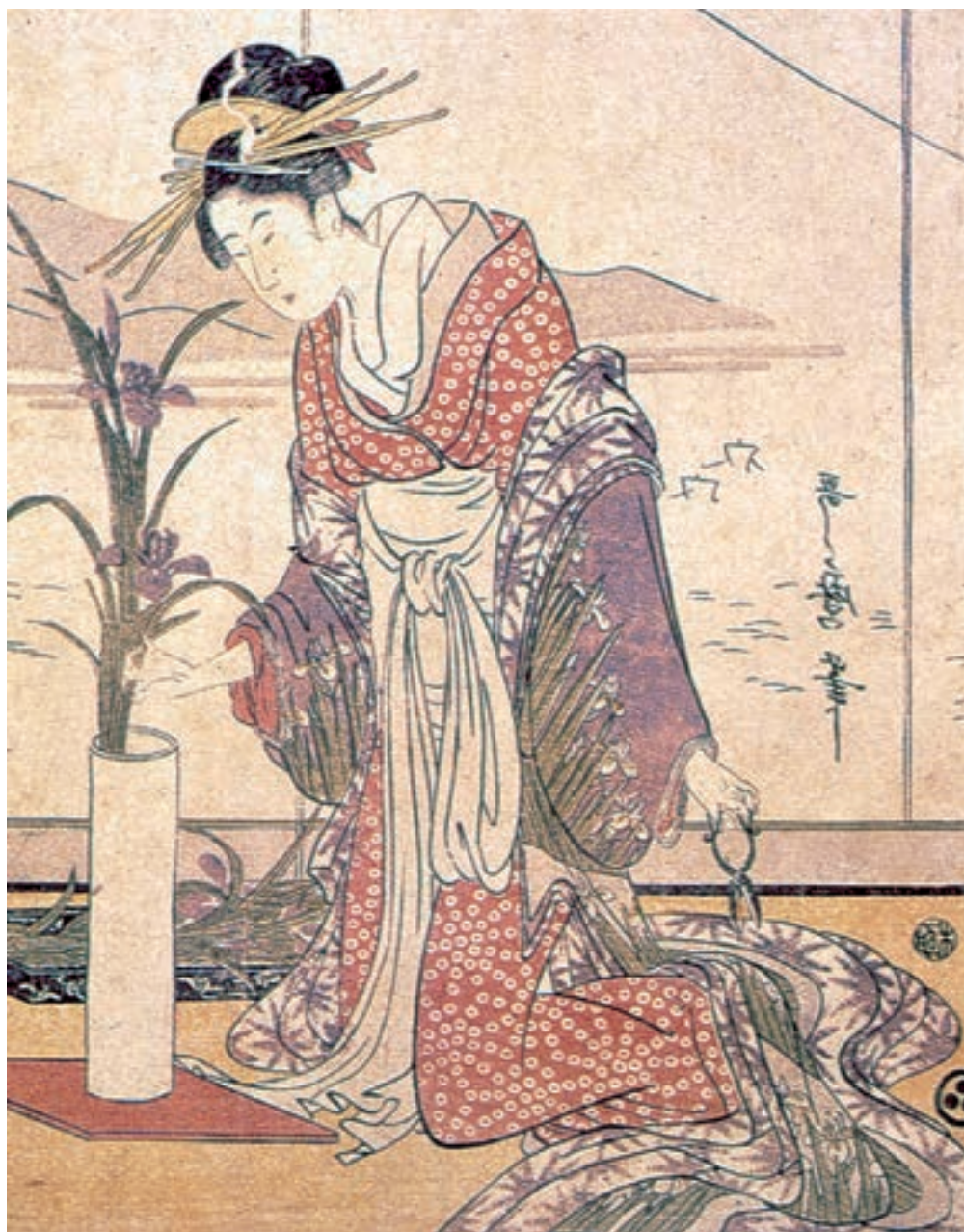
تصویر ۳-۱۶- گل آرایبی، باسمه، سده‌ی هجدهم میلادی، اثر گیتا گاو اوتامارو

باسمه‌های ژاپنی تأثیر عمیقی بر هنر اروپایی اواخر سده‌ی نوزدهم میلادی گذاشت. از میان هنرمندان قرن نوزدهم می‌توان به تولوز لوترک اشاره نمود ۱ که با تأثیرپذیری از باسمه‌های ژاپنی (تصاویر ۳-۱۶، ۳-۱۷ و ۳-۱۸) پوسترهای تبلیغاتی زیادی برای تماشاخانه‌ها و معرفی هنرپیشه‌ها چاپ و تکثیر نمود.