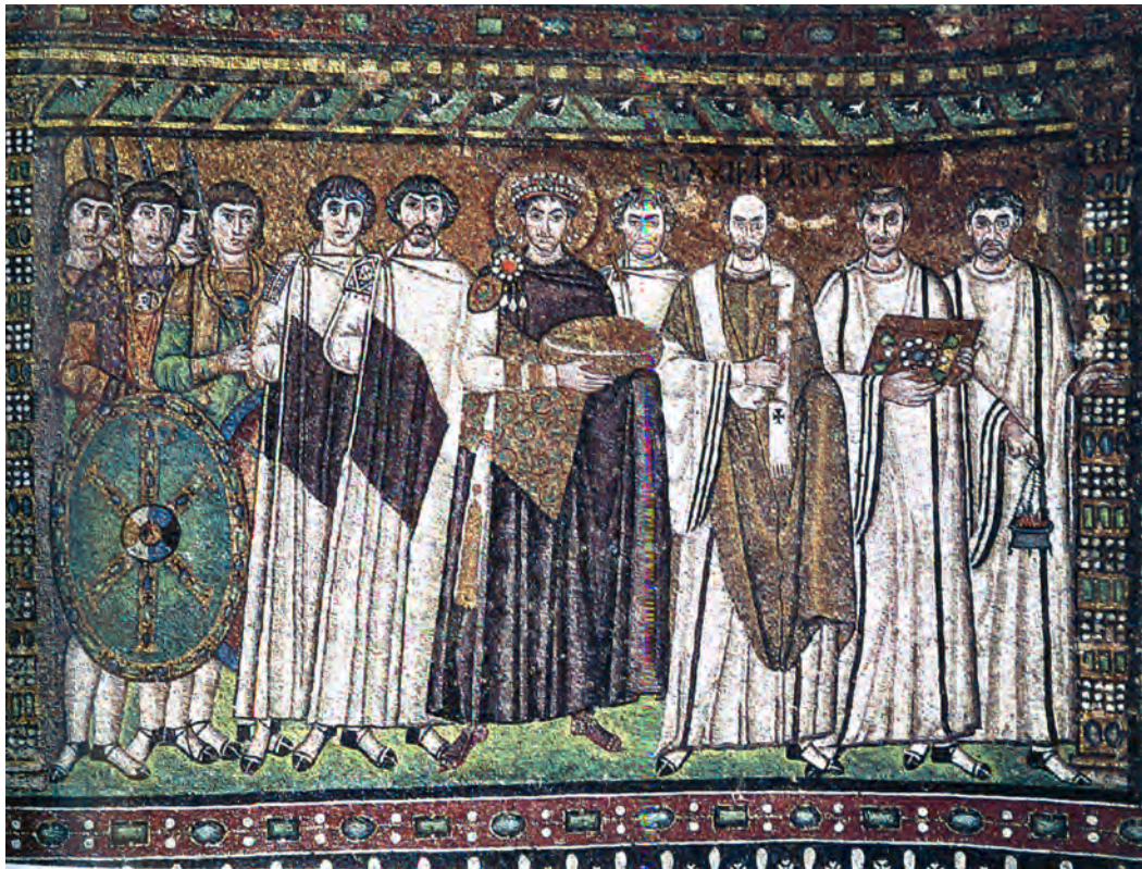
تصویر ۲۵-۴- دیوارنگاری به شیوهی موزائیک، بیزانس ژوستینیان و ملازمان، راونا حدود ۲۵۴۷ م