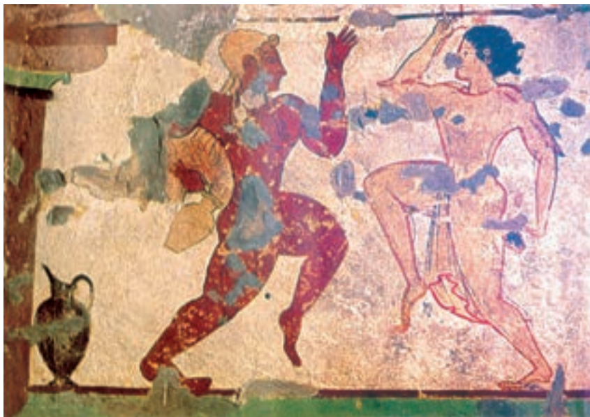
تصویر ۷-۴. هنر اتروریا، بخشی از یک نقاشی دیواری حدود ۴۸۰-۴۷۰ ق.م

امپراتوری روم باستان وارث دو تمدن پیش از خود بود. یکی تمدن اتروسک‌ها ۱ و دیگری تمدن یونان، که مهاجران یونانی در جنوب ایتالیا ایجاد کرده بودند. از این رو فرهنگ و هنر روم باستان عمدتاً بر پایه‌ی این دو تمدن بنا شد. هنر رومی، از لحاظ شکل، ادامه‌ی هنر یونان و به‌طور کلی تلفیقی از سنت‌های یونانی و اتروسک و سایر سنن هنری بیگانه بود. اما محتوای آن عمدتاً تبلیغات سیاسی در خدمت نظامی‌گری و سلطه‌جویی امپراتوری وسیع روم بود. محتوای تبلیغی و خصلت روایت‌گری هنری رومی را به‌ویژه در نقوش برجسته و مجسمه‌ها می‌توان دید. حال آن که نقاشی‌های ایشان بیش‌تر منعکس‌کننده‌ی شکوه و خوش‌گذرانی و طبیعت‌دوستی اشرافیت رومی است.