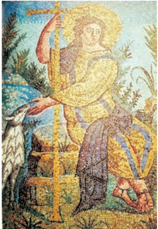
تصویر ۲۳-۴ دیوارنگاری به شیوه‌ی موزائیک حضرت مسیح در هیئت چوپان نیکوکار، راونا حدود ۴۲۵-۴۵۰ م