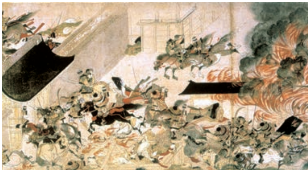
تصویر ۱۵-۳- سوزاندن کاخ سانجو، سده‌ی ۱۳ میلادی، بخشی از یک طومار افقی به طول ۶۸۵ سانتی‌متر. این طومار بزرگ بیانگر یک قیام اجتماعی است.

قطع رابطه با چین در اواخر سده‌ی نهم میلادی زمینه‌ای برای رشد نقاشی بومی فراهم ساخت. ژاپنی‌ها در نقاشی روی دیوارها یا بر سطح پرده‌های چند لته (پاراوان)، که برای آرایش کاخ‌های سلطنتی و کوشک‌های اشراف تهیه می‌شد، مناظری از سرزمین خویش را به تصویر می‌کشیدند. علاوه بر این، طی سده‌های ۱۱ و ۱۲ میلادی هم‌گام با رشد ادبیات ملی، آنان داستان‌های عامیانه و ادبی، مضمون‌های تاریخی و زندگی‌نامه‌ها را بر روی طومارهای افقی تصویرسازی می‌کردند. اگر چینیان نقاشی طوماری را عمدتاً برای منظره‌نگاری به کار می‌بردند، ژاپنی‌ها آن را به خدمت تجسم رویدادهای زندگی گرفتند، ترکیب‌بندی این طومارها برحسب جریان وقایع به چند بخش تقسیم می‌شود. قلم‌گیری نازک و سریع، رنگ‌های غالباً درخشان، و تجسم فضا از زاویه‌ی دید بالا از ویژگی‌های این طومارهای ژاپنی به‌شمار می‌رود. در این گونه نقاشی‌ها جلوه‌های طبیعت‌گرایانه و تزئین با هم آمیخته شده‌اند. (تصویر ۱۵-۳).