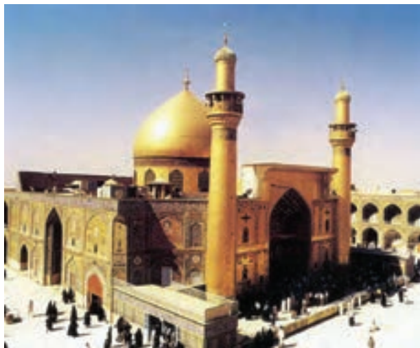
▲ شکل ۳-۱۲- بارگاه ملکوتی امام علی (ع) در نجف اشرف

ساخته شد (شکل ۲-۱۲). در این زمان به پاس بزرگداشت مذهب شیعه و بزرگان دین، تلاش بسیاری برای ساخت آرامگاه‌هایی در شأن بزرگان و ائمه به‌ویژه در کر بلا، سامرا و نجف اشرف صورت گرفت. در این مکان‌ها گنبدهایی بی‌بازی شکل همراه با گلدسته‌های استوانه‌ای بلند بنا شد (شکل ۳-۱۲).