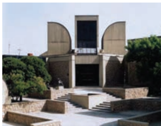
▲ شکل ۹-۱۴ د- موزه هنرهای معاصر، تهران، کامران دیبا