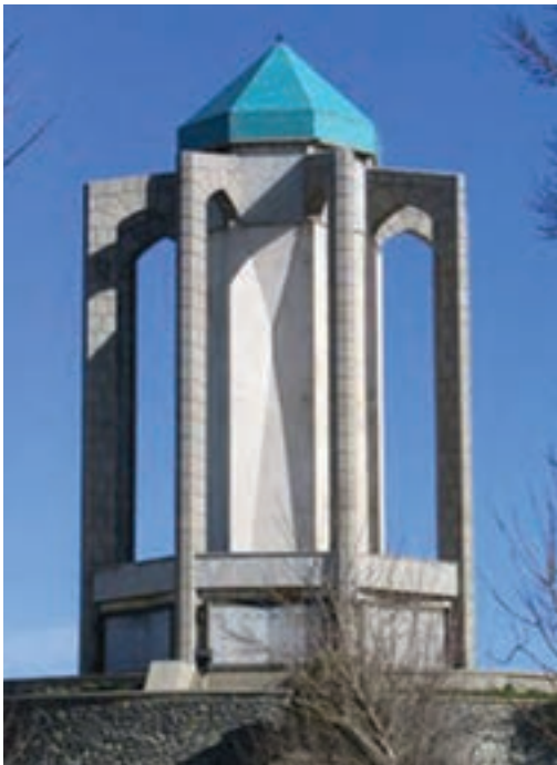
▲ شکل ۶-۱۴- آرامگاه باباطاهر، همدان، محسن فروغی

هنر اروپایی و شیوه‌های نوین آموزش هنر غلبه کرده و حاصل آن به وجود آمدن هنرکده هنرهای زیبا شد ۱ .