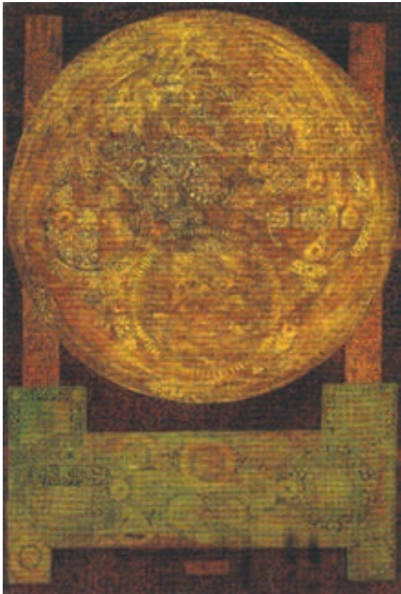
▲ شکل ۱۰-۱۴-ب - نقاشی، فرامرز پیل آرام، مواد ترکیبی