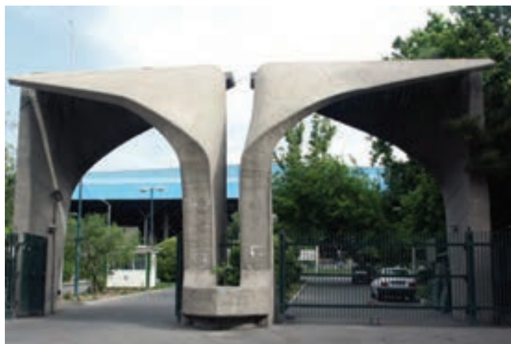
▲ شکل ۲-۱۴- سر در دانشگاه تهران

در این دوره تحولات علمی نیز با رویکرد جدید و تأسیس دانشگاه در ایران صورت می‌پذیرد (شکل ۲-۱۴) و سعی می‌شود تا جلوه‌هایی تازه در معرفی بزرگان ادب فارسی پدید آید و آرامگاه‌های باشکوهی از فردوسی، سعدی و حافظ ساخته شود (شکل ۳-۱۴ الف و ب و ج). در زمینه نقاشی و نگارگری نیز تحول بنیادینی شکل می‌گیرد و مدرسه صنایع مستظرفه به دو بخش هنرستان کمال‌الملک