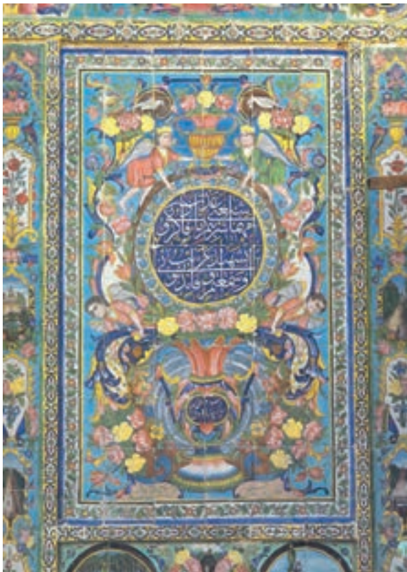
شکل ۱۲-۱۳- ب- کاشی کاری هفت رنگ، دوره قاجاریه