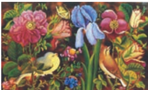
▲ شکل ۱۳-۱۴- نقاشی پشت شیشه، دوره قاجاریه