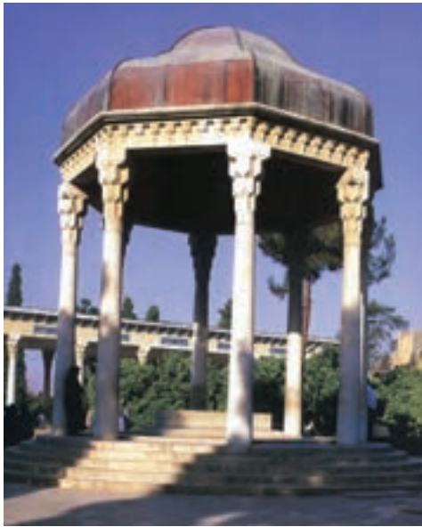
ج- حافظیه، شیراز، آندره گدار