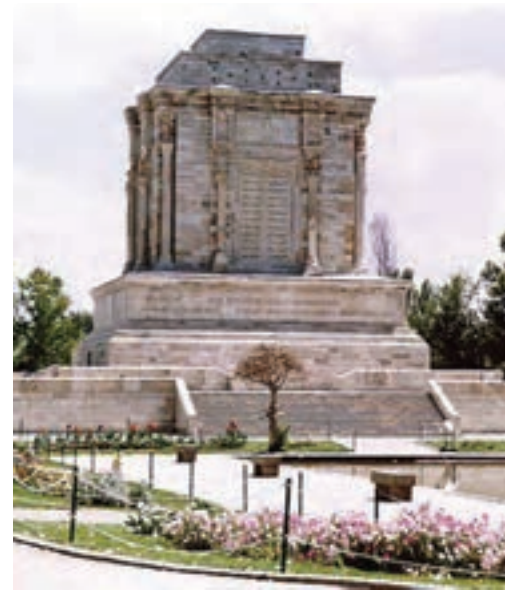
الف- آرامگاه فردوسی، توس، مشهد، لرزاده