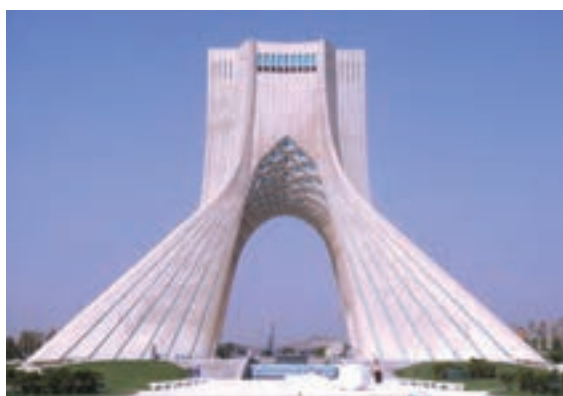
▲ شکل ۹-۱۴ ج- برج آزادی، تهران، حسین امانت