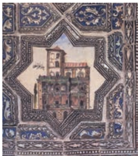
▲ شکل ۷-۱۳- کاشی‌کاری قاجاری