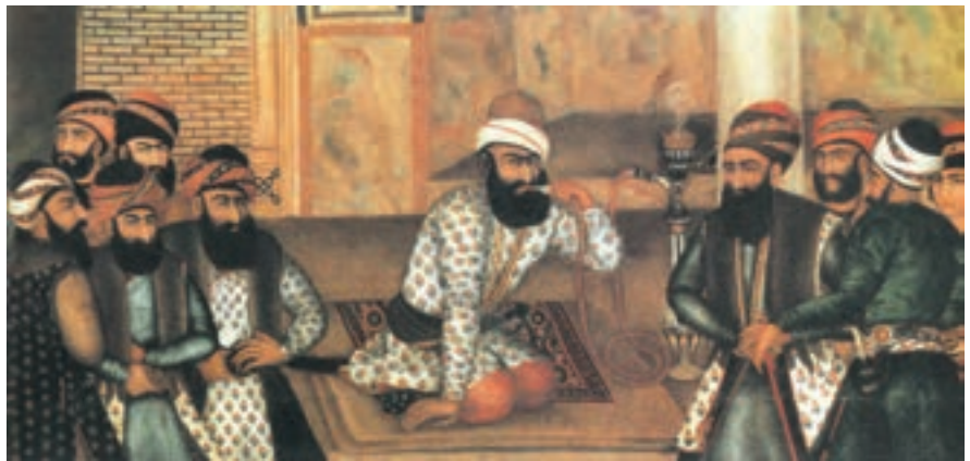
▶ شکل ۴-۱۳- نقاشی رنگ و روغن از چهره کریمخان زند

نقاشی‌های دوره زندیه که به «مکتب گل» شهرت یافته در بردارنده جنبه‌های مختلف با موضوعات متنوع و همچنین در بردارنده نقاشی‌های رنگ و روغنی با ابعاد بزرگ، نقاشی‌های لاک‌ی و روغنی و گل و مرغ می‌باشد (شکل ۴-۱۳). تحول اساسی در این دوره را بیشتر می‌توان در شیوه‌های جدید هنری به ویژه نقاشی بر اشیاء مختلف از جمله قاب آینه، صندوقچه‌های جواهر و ... دید (شکل ۵-۱۳).