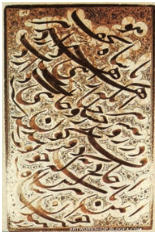
▲ شکل ۱۰-۱۳- سیاه مشق به خط نستعلیق

ارتباط روزافزون با غرب و حضور اندیشمندان ایرانی در این دوره که با فرهنگ اروپایی آشنا شده بودند باعث شد که زمینه مناسبی برای شکل‌گیری و کاربرد رسانه‌های جدیدی از جمله ایجاد روزنامه و مطبوعات، عکاسی و حتی سینما را به وجود آورد. هر چند تمایل به استفاده از عکاسی که بسیار سریع گسترش یافت، خود باعث ایجاد رکودی در نقاشی شد. این روند سریع سبب شد تا بسیاری از زمینه‌های فرهنگی و اجتماعی تحول بیشتری به سمت تجدد و نوگرایی بیابد (شکل ۱۳-۱۳ الف و ب).