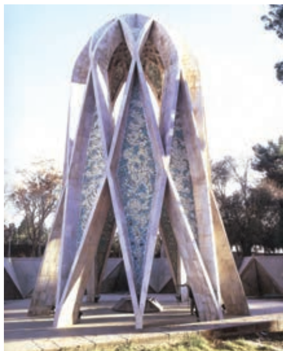
▲ شکل ۹-۱۴ الف- آرامگاه خیام، نیشابور، هوشنگ سیحون