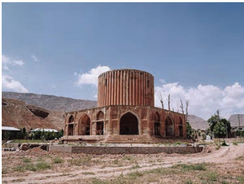
▲ شکل ۲-۱۳-کلات نادری، دوره افشاریه، خراسان