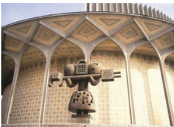
▲ شکل ۹-۱۴ هـ- تئاتر شهر، تهران، علی سردار افخمی