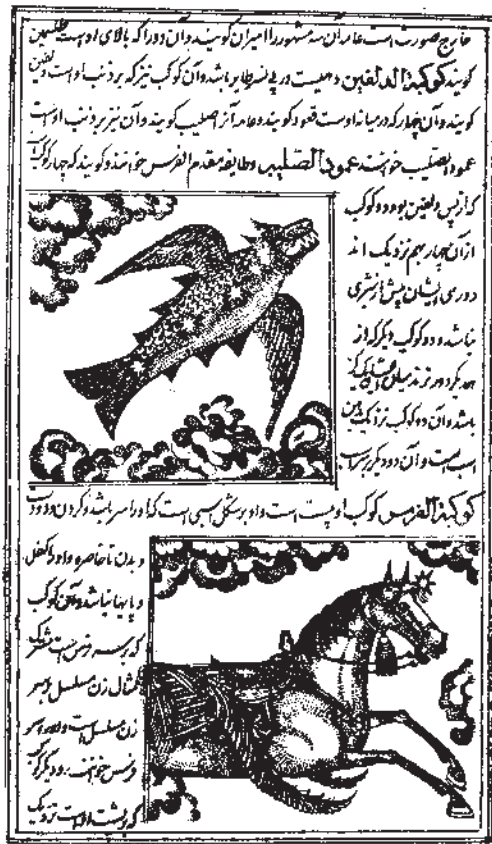
شکل ۱۱-۱۳- چاپ سنگی، کتاب عجایب المخلوقات