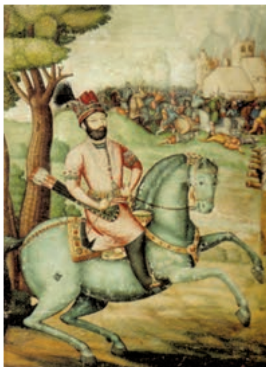
▲ شکل ۱-۱۳-الف - نادرشاه افشار، اثر علی بن عبدالبیگ علی قلی جبه دار