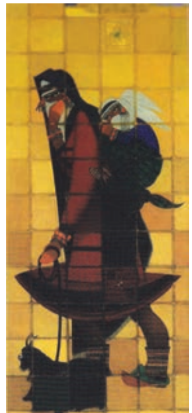
▲ شکل ۸-۱۴- زن قوچانی، جلیل ضیاءپور، رنگ و روغن روی بوم