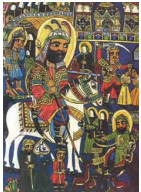
▲ شکل ۱۱-۱۴ - نقاشی عامیانه

دوره چهارم نوعی رویکرد هنری از سال ۱۳۶۰ به بعد است. تداوم هنر سنت‌گرایی دوره سوم است که با تحولاتی در جریان شکل‌گیری انقلاب اسلامی و دفاع مقدس با گرایشات مذهبی ادامه می‌یابد. حاصل این تحول به شکلی است که ارزش‌های انقلابی به‌گونه‌ای با ابزار هنری در جریان تحولات اخیر به هویتی کاملاً مشخص تبدیل می‌شود. نوعی انقلاب فرهنگی در عرصه‌های متفاوت ایجاد می‌شود که نتیجه آن را به‌عنوان هنر انقلابی، هنر جنگ، هنر دفاع مقدس و ... می‌دانیم (شکل ۱۲-۱۴).