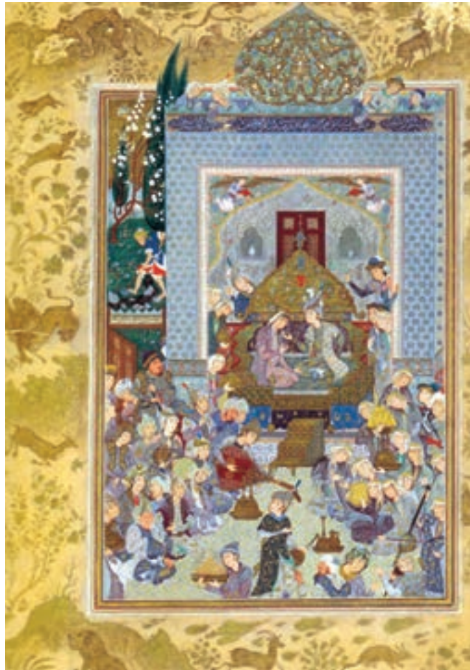
▲ شکل ۵-۱۴- گنبد ارغوانی، محمدهادی تجویدی، نگارگری