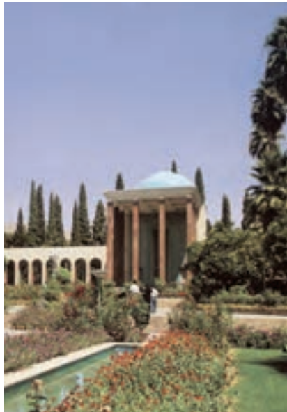
ب- سعدیه، شیراز، آندره گدار