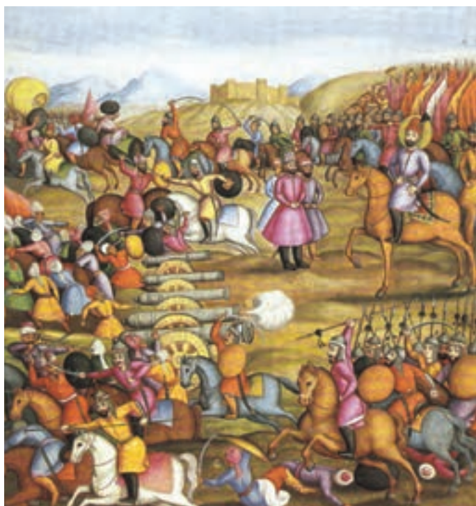
▲ شکل ۱-۱۳-ب - تصویری از کتاب تاریخ جهانگشای نادری (جنگ نادر با اشرف افغان)، ۱۱۷۱ هـ