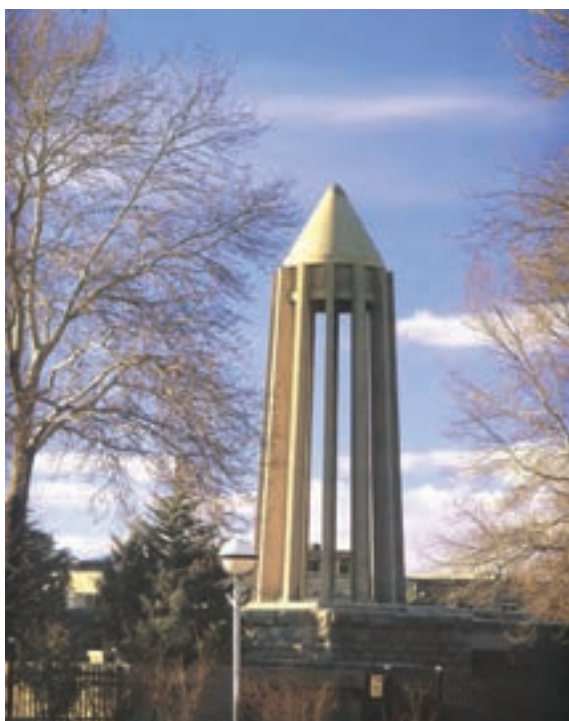
▲ شکل ۹-۱۴ ب- آرامگاه بوعلی سینا، همدان، هوشنگ سیحون