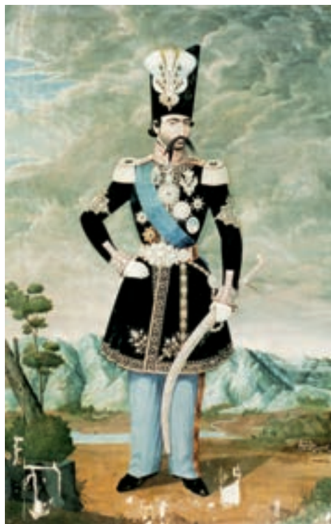
▲ شکل ۸-۱۳- چهره ناصرالدین شاه

پس از تأسیس مدرسه دارالفنون و دارالصنایع به‌عنوان اولین مرکز دولتی آموزش هنر نوعی گرایش کامل به هنر اروپایی به‌وجود می‌آید و تمایل به هنر اشرافی و درباری به اینگونه آثار روزه‌روز بیشتر می‌شود. تمایلات هنر اروپایی بیشتر در منظره‌سازی و صورت‌سازی و دور شدن از نگارگری ایران دیده می‌شود (شکل ۸-۱۳). تحولات معماری در این دوره نیز مانند نقاشی با تلفیق عناصر سنتی و شکل ظاهری معماری اروپایی می‌باشد (شکل ۹-۱۳).