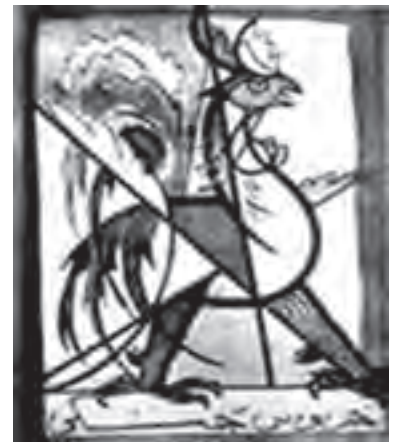
▲ شکل ۷-۱۴- نشانه انجمن خروس جنگی

تحول سنت‌گرایی در این دوره و نوعی توجه به ارزش‌های سنتی ایرانی باعث شد تا زمینه‌های فعالیت بیشتری در عرصه‌های هنری ایجاد شود. این تمایل باعث ایجاد نوعی فعالیت