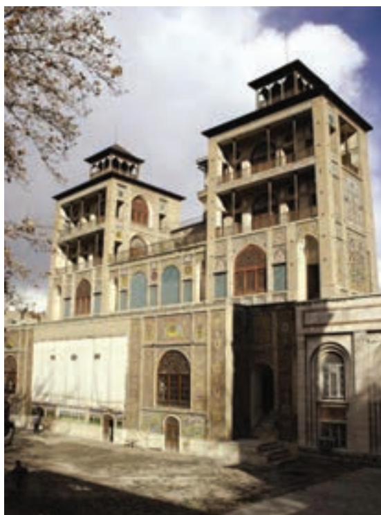
▲ شکل ۹-۱۳- شمس‌العماره، عمارت قاجاری، تهران

خوشنویسی این دوره که بیشتر به شیوه نستعلیق می‌باشد به دلیل کاربردهای جدید هنری به شکل سیاه مشق (شکل ۱۰-۱۳) و یا نوعی نگارش مناسب برای چاپ سنگی ۱ است (شکل ۱۱-۱۳).