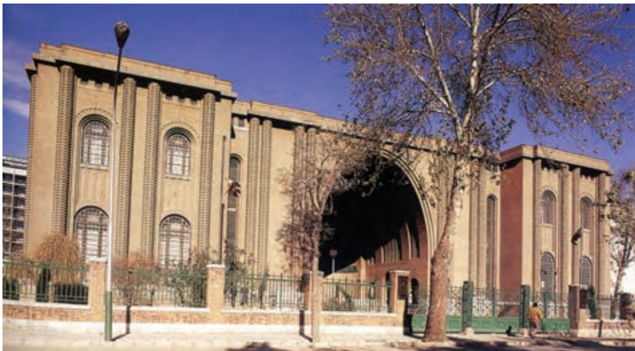
▲ شکل ۱-۱۴- سر در موزه ملی ایران، تهران، آندره گدار

بودند اما به لحاظ رویکرد باستان‌شناسی سعی داشتند تا طرح‌های معماری خود را به شیوه باستانی بسازند (شکل ۱-۱۴).