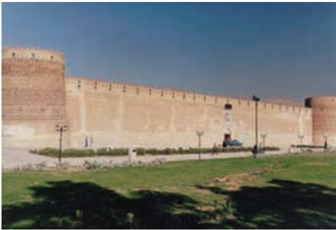
▲ شکل ۳-۱۳- ارگ کریمخان، شیراز

بنابراین زندیه با حفظ میراث هنری دوره صفویه با وجود اندک زمان حضور این سلسله توانست ویژگی‌های منحصر به فرد و خاصی را در هنر پدید آورد که در زمینه نقاشی، معماری و دیگر هنرها، شاخص باشد (شکل ۳-۱۳).