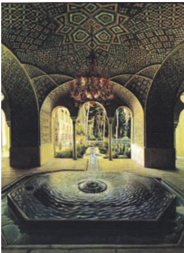
شکل ۱۶-۱۳- حوض‌خانه (کاخ گلستان)، کمال الملک (محمد غفاری)، رنگ و روغن روی بوم