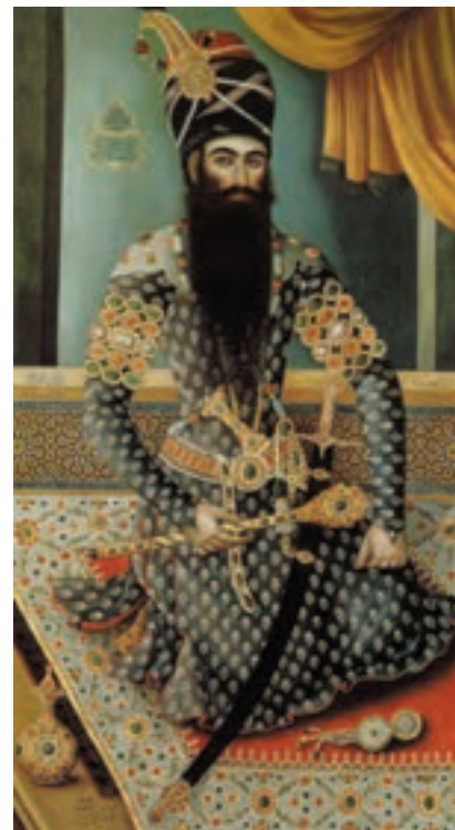
▲ شکل ۶-۱۳- شمایل‌نگاری (پیکرنگاری) فتحعلی شاه