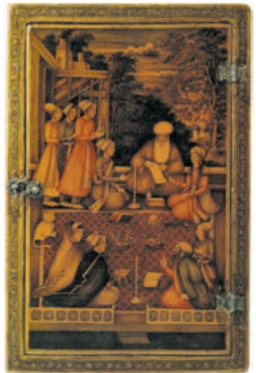
▶ شکل ۵-۱۳- قاب آینه، نقاشی لاک‌ی روغنی