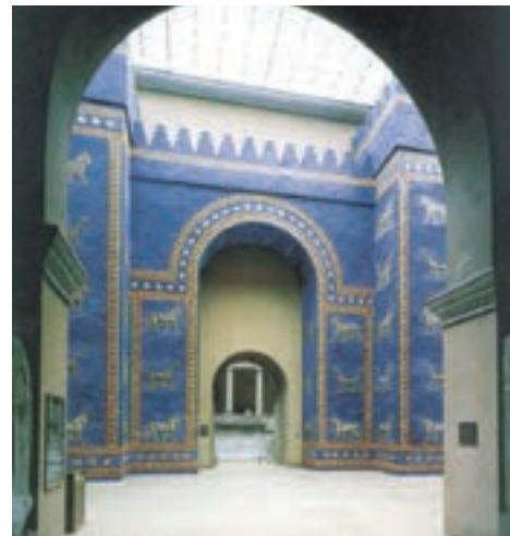
تصویر ۱۶ - بازسازی دروازه ایشدار، بابل، حدود ۵۷۵ پیش از میلاد، موزه دولتی برلین