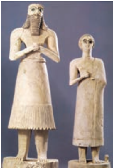
تصویر ۵- تندیس از جنس سنگ مرمر، ابو و همسرش، تل اسمر، حدود ۲۹۰۰ تا ۲۵۵۰ پیش از میلاد، موزه بغداد بلندترین تندیس ۷۵ سانتی متر

از معبد ابو ۱ در تل اسمر تعدادی تندیس از جنس سنگ مرمر در اندازه‌های مختلف کشف شد. بزرگ‌ترین آنها تندیس ابو (ایزد رویش گیاه) است. به عقیده سومریان خدایان در قالب تندیس خود حضور دارند و نیایشگران نیز می‌توانستند برای خود جانشینی داشته باشند که به‌جای آنها نیایش کند. صورت و بدن تندیس‌ها بسیار ساده ساخته شده تا از اهمیت چشم‌ها به‌عنوان دریاچه روح که در ساخت آنها بسیار تأکید شده، کاسته نشود. تندیس‌سازان سومری آثار خود را به شکل مخروط و استوانه با بازوها و ساق‌های استوانه‌ای می‌ساختند (تصویر ۵). آثار به‌دست آمده از قبور سلاطین اور، ما را با ذوق و ظرافت هنر سومری بیشتر آشنا می‌کند، در این قبور آثار مختلفی به دست آمد که دیدنی‌ترین آنها چنگ منقوش است، بر روی دسته چنگ تصاویر طنز گونه‌ای از رفتار حیوانات نقش شده است (تصویر ۶). ماهر سازان نیز هنرمندان ماهری بودند و انواع نقش‌ها را بر روی مهرها حکاکی می‌کردند (تصویر ۷).