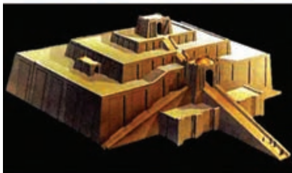
تصویر ۴- معبد (زیگورات) اور و ماکت آن، حدود ۲۰۳۰ سال پیش از میلاد، جنوب عراق