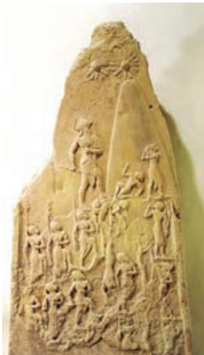
تصویر ۹- لوح پیروزی نارام سین، سنگ، حدود ۲۳۰۰-۲۲۰۰ قبل از میلاد، موزه لوور پاریس

در حدود ۲۴۰۰ قبل از میلاد اقوام سامی نژاد شمال میانرودان به جنوب آمدند و به رهبری سارگون ۱ حکومت اکّد را تأسیس کردند. سارگون و جانشینانش خود را پادشاه می خواندند و ادعای فرمانروایی بر سراسر میانرودان را داشتند، در زمان اکّدی ها، هنر سومری وظیفه تجلیل از پادشاه را نیز به عهده گرفت، جالب ترین اثر دوره اکّدی یک سردیس مفرغی است که چهره پادشاهی قدرتمند را مجسم می کند که نگاهی اطمینان بخش و با ابهت دارد ( تصویر ۸). از نارام سین ۲ نوه سارگون نیز یک لوح سنگی باقی مانده که در آن پیروزی نارام سین و سپاهش نقش شده است (تصویر ۹). در لوح نارام سین بزرگی اندازه شاه تأکید بر قدرتمندی و پیروزی او دارد.