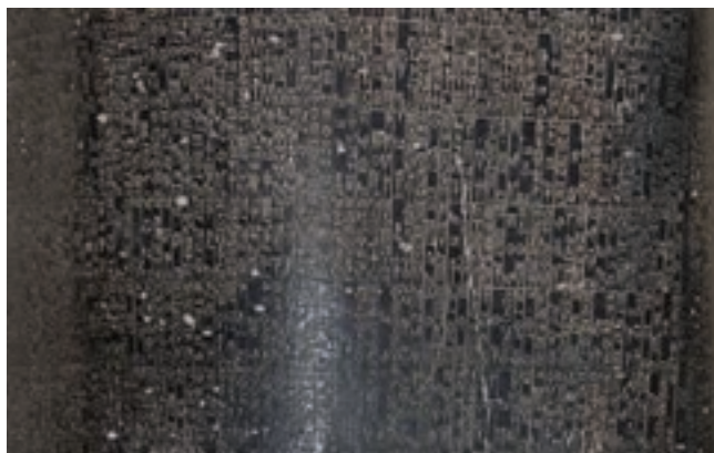
تصویر ۱۵ - ب - بخشی از خط نوشته لوح سنگی حمورابی