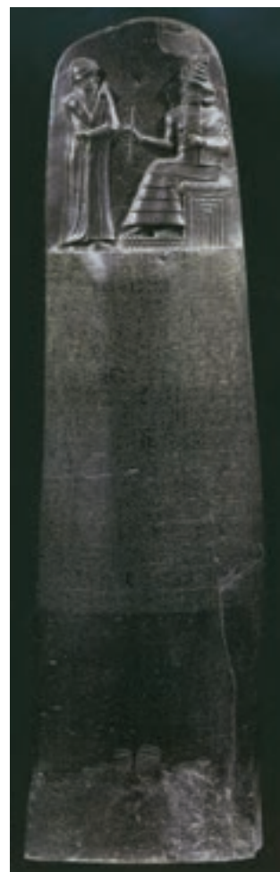
تصویر ۱۵ - الف - قانون نامه حمورابی، لوح سنگی، ارتفاع ۲۱۵ سانتی‌متر، حدود ۲۷۵۰ پیش از میلاد، موزه لوور، پاریس

همسایه همواره خواستار حجاران، نجاران، بنایان و آهنگران بابلی بودند و از آنها در کارهای ساختمانی استفاده می‌کردند. برخلاف آشوریان، هنر بابلی همچون هنر سومری - آکدی در خدمت مذهب و حکومت بود و هنرمندان به ساخت و تزیین معابد، تجسم خدایان و بازنمایی حکام و کارگزاران حکومت می‌پرداختند. بابلی‌ها در ساخت آجرهای لعاب‌دار بسیار توانا بودند و نمونه کار برجسته آنها آجرهای لعاب‌دار منقوش دروازه ایشدار است که از جمله شاهکارهای هنری جهان باستان محسوب می‌شود (تصویر ۱۶ و ۱۷).