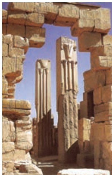
تصویر ۱۴- تزئینات معماری، معبد آمون، کارناک، حدود ۱۴۵۰ پیش از میلاد

نشان می‌دهند که مجموعه آن به نام کتاب مردگان شهرت یافته است (تصویر ۱۲). آخرین فرمانروایان قدرتمند مصر، رامسس دوم و سوم هستند که بار دیگر مصر را به اوج قدرت رساندند. یادگار برجسته معماری عهد آنها کاخ‌ها و معبد آمون در الاقصر است که دارای سردر، تالارهای ستوندار و حیاط است (تصویر ۱۳ و ۱۴).