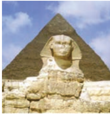
تصویر ۴- تندیس انسان - شیر (ابوالهول) و نمای هرم خنوس در پشت، جیزه، مصر، حدود ۲۵۳۰ پیش از میلاد