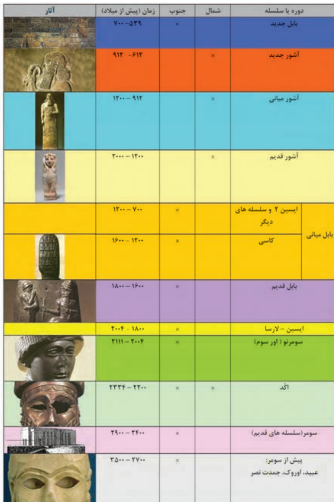
جدول گاهنگاری دوره‌ها و سلسله‌های میانرودان (بین النهرین)