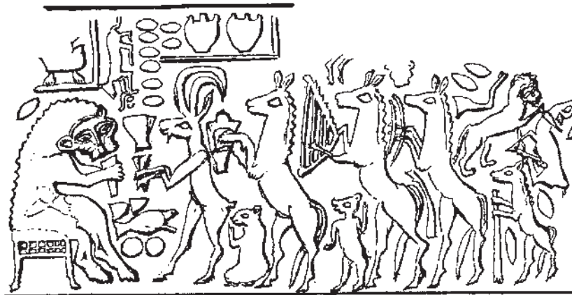
تصویر ۷- اثر مهر استوانه‌ای، پذیرایی از شیر، سومر، حدود ۲۶۵۰-۲۵۵۰ پیش از میلاد

تصویر ۶- الف- چنگ اور، مقابر سلاطین اور، حدود ۲۶۰۰ پیش از میلاد، موزه دانشگاه فیلادلفیا تصویر ۶- ب- بخشی از تصویر چنگ اور، سرگاو از کاسه چنگ اور طلا و سنگ لاجورد با چشمان مرصع، بلندی ۴۵ سانتی متر