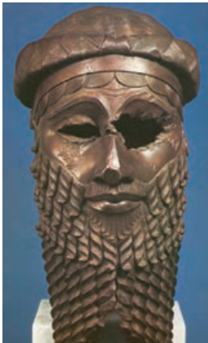
تصویر ۸- سر حاکم اکّدی (احتمالاً سارگون)، مفرغ، نینوا، حدود ۲۳۰۰ تا ۲۲۰۰ پیش از میلاد، موزه عراق