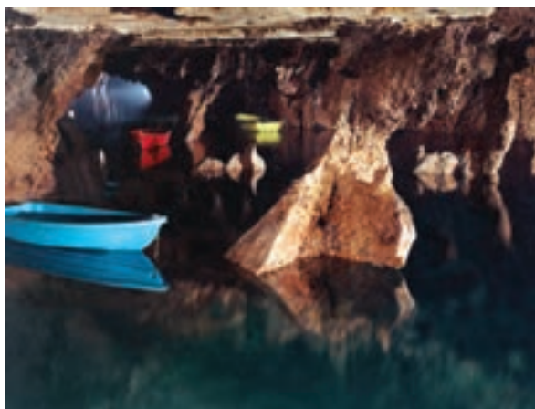
تصویر ۹-۶- لنز واید، غار علی صدر، همدان