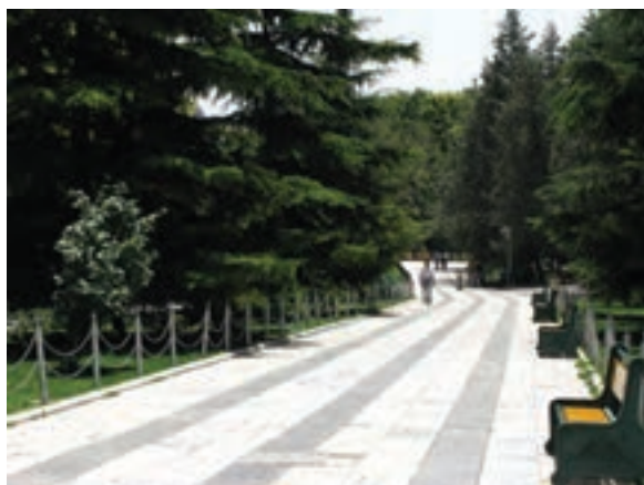
تصویر ۱۹-۶- پرسپکتیو لنز واید