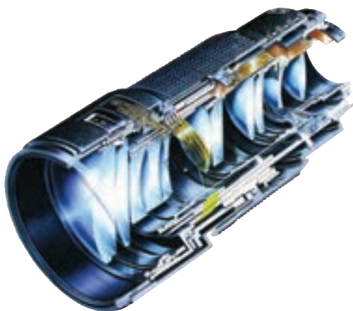
تصویر ۱-۶- تصویری از داخل یک لنز

تصویر تشکیل شده توسط یک عدسی ساده دارای معایب فراوانی است که برای از بین بردن این معایب چند عدسی همگرا و واگرا را با محاسبات دقیق و در فواصل معین از هم قرار می‌دهند، به این گونه عدسی‌ها عدسی مرکب می‌گویند. هر جا که کلمه لنز را به کار می‌بریم منظور مجموعه‌ای از عدسی‌هاست. (تصویر ۱-۶) برای بالا رفتن کیفیت تصویر و جلوگیری از اتلاف نور، روی عدسی‌های لنز را از مواد خاصی و به صورت لایه‌های بسیار نازکی می‌پوشانند علت این که وقتی به لنزها نگاه می‌کنیم سطح آنها را رنگی می‌بینیم همین است. (تصویر ۲-۶) حفاظت از این لایه‌ها بسیار مهم است تا آنجا که ممکن است، باید از کثیف شدن و در نتیجه پاک کردن لنزها خودداری نمود زیرا با از بین رفتن این پوشش‌های رنگی کیفیت لنزها افت خواهد کرد.