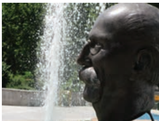
تصویر ۲۶-۶- لنز تله