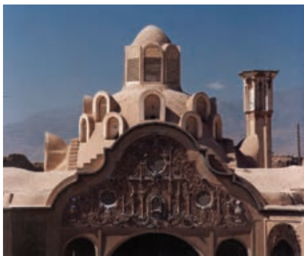
تصویر ۱۱-۶- لنز تله، خانه بروجردیها، کاشان