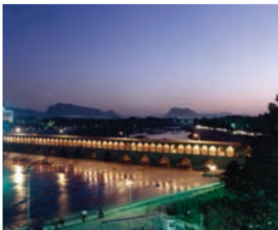
تصویر ۱۰-۶- لنز نرمال، سی و سه پل، اصفهان