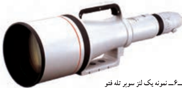
تصویر ۶-۶- نمونه یک لنز سوپر تله فتو