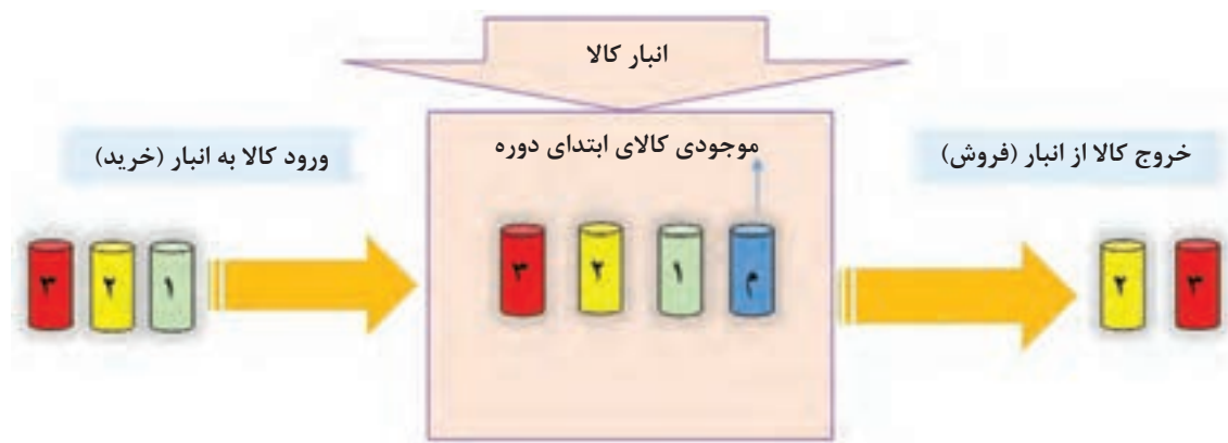
تصویر ۹-۳- جریان بهای تمام شده در روش اولین صادره از آخرین وارده

در این روش بر عکس روش FIFO، فرض بر این است که کالاها از محل آخرین خریدهایی که وارد انبار شده، خارج می‌شود و باقیمانده (موجودی پایان دوره) مربوط به قدیمی‌ترین خریدها (اولین خریدها) و موجودی ابتدای دوره می‌باشد. پس می‌توان نتیجه گرفت در این روش مبنای محاسبه بهای تمام شده کالاهای فروش رفته، قیمت آخرین خریدها و مبنای محاسبه بهای تمام شده موجودی کالای پایان دوره، می‌تواند قیمت خریدهای اول دوره و یا موجودی ابتدای دوره باشد. تصویر ۹-۳ به درک این مطلب کمک می‌کند.