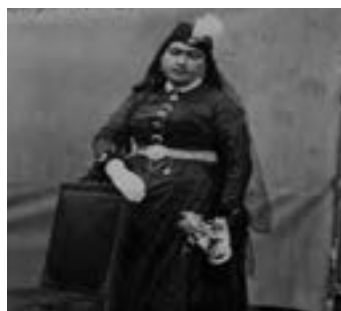
انیس الدوله همسر ناصرالدین‌شاه