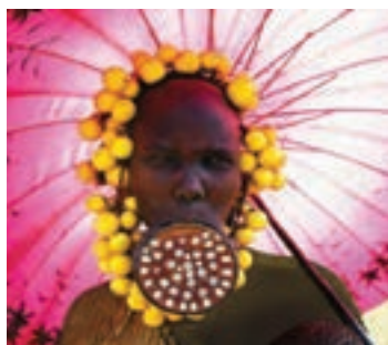
زنی از قبیله مرسی در اتیوپی

امروزه ما در دوره‌ای زندگی می‌کنیم که لاغر بودن به مهم‌ترین ویژگی پسند افراد تبدیل شده است و اکثر ما می‌خواهیم لاغر باشیم. در واقع تا قبل از سن شش سالگی کودکان از طریق پیام‌های تصویری یاد می‌گیرند که افراد چاق را به‌عنوان افراد زشت، تنبل، ناسالم، و... بشناسند. از تصاویر موجود می‌توان به معیارهای زیبایی در فرهنگ‌ها و دوره‌های تاریخی پیشین پی برد. این تصاویر نشان می‌دهند که زیبایی در آن فرهنگ و دوره چگونه بوده است. آرمان‌ها دربارهٔ زیبایی بر اساس توافقات اجتماعی ساخته می‌شود. به عنوان مثال، تصویر زنان زمان قاجار و تصاویر بستن پاهای دختران چینی با قالب چوبی در کودکی (برای کوچک ماندن پا و قدم کوتاه برداشتن)، نشان می‌دهد که چطور در قرون گذشته و در فرهنگ‌های مختلف معیارهای زیبایی متفاوت بوده است. زنان در مقابله با این فشار برای لاغر شدن از طریق رژیم گرفتن، واکنش نشان می‌دهند. بیشتر این رژیم‌ها برای حفظ ظاهر است تا سلامتی. درصد بالایی از افراد شکل بدن خود را دوست ندارند و رژیم گرفتن برای همهٔ سنین از نه سالگی تا کهنسالی به یک دغدغه تبدیل شده است. شگفت‌انگیز نیست که به این افراد مشاوره داده می‌شود که برای غذا خوردن احساس گناه کنند. پژوهشی نشان می‌دهد که در طول یک دهه تعداد مقالات در مورد رژیم گرفتن نسبت به دهه قبل دو برابر شده است و این نکته مهم است که رژیم گرفتن و ورزش نه با هدف سلامتی که با هدف زیبایی انجام می‌شود و سلامتی فقط به آن مشروعیت می‌دهد.