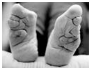
پاهای زنان چینی در گذشته