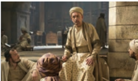
تحریف وقایع در فیلم‌های هالیوودی نمونه‌ای از بی‌اخلاقی رسانه‌ای

به اعتقاد بیشتر صاحب‌نظران حوزه رسانه، اخلاق رسانه‌ای اگرچه تابع اصول و قواعدی کلی و جهان‌شمول است، به سبب ریشه داشتن آن در مجموعه ارزش‌های درون جامعه، می‌تواند از جامعه و فرهنگی به جامعه و فرهنگ دیگر متفاوت و متغیّر باشد. از این رو تدوین اصول کلی اخلاق رسانه‌ای در هر فرهنگ و جامعه، تعاریف و محدوده‌های خاص خود را دارد.