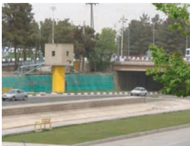
شکل ۱۸-۱- تصویر یکی از چاه های آب داخل رودخانه

۳- چاه های علی آباد: در حدود ۱۳ حلقه چاه در دشت علی آباد واقع در شمال غرب استان حفر شده است که بخشی از آب