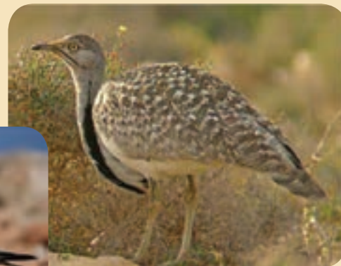
شکل ۲۶-۱- هوبره برنده‌ای در منطقه مسیله