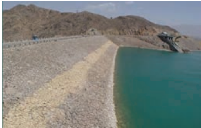
شکل ۱۵-۱- سد ۱۵ خرداد

سد ۱۵ خرداد: این سد در فاصله ۶۵ کیلومتری جنوب غربی شهر قم و در خارج از محدوده سیاسی استان قم روی قمرود ساخته شده است. هدف از ساخت این سد، تأمین آب آشامیدنی شهر قم، تأمین آب مورد نیاز زمین‌های کشاورزی و نیز مهار سیلاب است. این سد از دو قسمت، سد اصلی و بازوی خاکی تشکیل شده است. آب دریاچه سد به دلیل ورود برخی رودهای فرعی شور به قمرود و تبخیر زیاد سد، تا حدودی شور است (شکل ۱۵-۱).