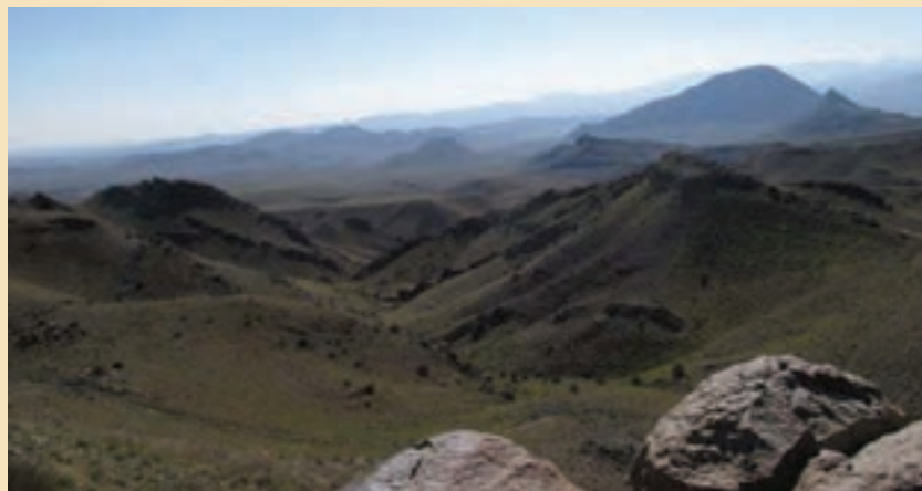
شکل ۱-۲۴- منطقه پلنگ دره

۱- منطقه حفاظت شده پلنگ دره : به شکل ۱-۲۴ توجه کنید. منطقه حفاظت شده پلنگ دره با وسعتی در حدود ۳۲۰۰۰ هکتار در جنوب غربی استان و در فاصله ۵۰ کیلومتری جنوب غربی شهر قم قرار دارد. وجود ارتفاعات از جمله کوه آله و سخت حصار از ویژگی‌های توپوگرافی منطقه محسوب می‌شود. وجود چشمه‌سارهای زیبا و مناظر طبیعی بدیع از ویژگی‌های گردشگری منطقه به حساب می‌آید. پوشش گیاهی غالب منطقه بیشتر شامل گز، بادام کوهی (بادامچه)، گون، ریواس و... می‌توان اشاره کرد. همچنین وجود گونه‌های متنوع جانوری مانند کبک، تیهو، بلدرچین، کل و بز، قوچ و میش، گرگ، گراز، شغال، روباه و زیستگاه پلنگ در سال‌های نه‌چندان دور از جاذبه‌های منطقه است که در صورت حفاظت بیشتر می‌تواند در زمره مناطق خاص از نظر تنوع زیستی کشور باشد.