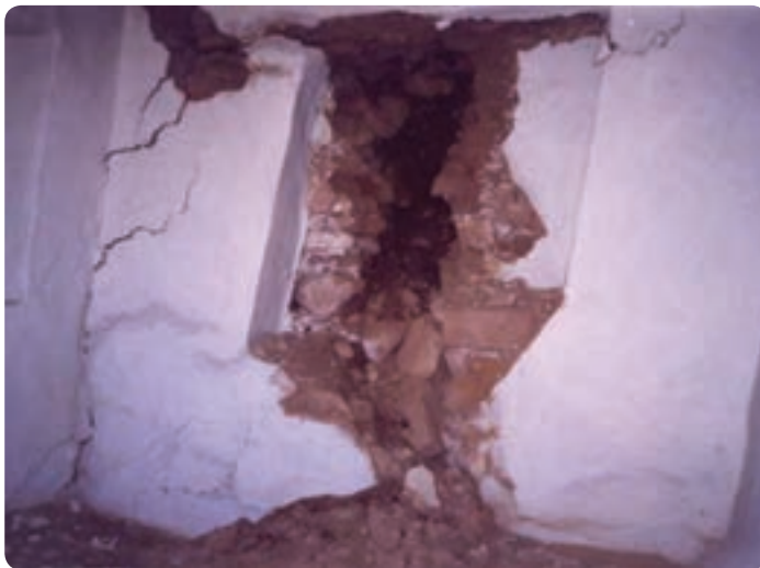
شکل ۴۶-۱- زمین لغزه در روستای بادله کوه، شهرستان دامغان