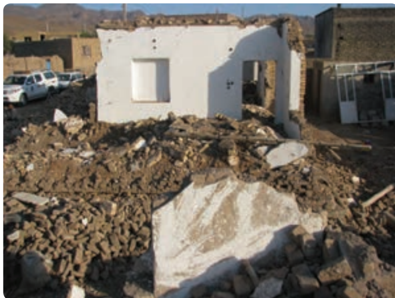
شکل ۴۲-۱. زلزله کوه زر - شهرستان دامغان

۱- گسل‌های اصلی (فعال یا خطرناک): گسل‌های اصلی به این دلیل خطرناک‌اند که بیشترین مراکز جمعیتی، اقتصادی و