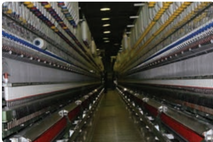
شکل ۴۸-۱- کارخانه ریسندگی شهرک صنعتی سمنان

ج) آلودگی صوتی: یکی از انواع آلودگی‌ها، آلودگی صوتی است. آلودگی صوتی؛ یعنی ایجاد سر و صدای اضافی ناشی از فعالیت‌های انسانی در محیط زندگی ما که منجر به ناراحتی‌های روحی، روانی و عصبی در انسان می‌شود. مهم‌ترین منابع آلودگی صوتی استان عبارت‌اند از: