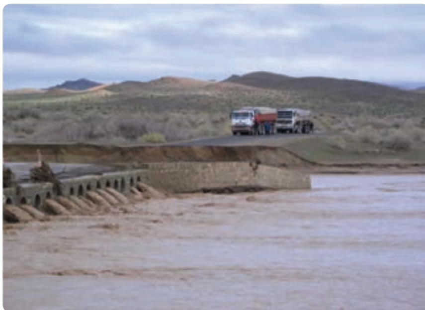
شکل ۴۳-۱- خسارت‌های ناشی از وقوع سیل در شهرستان شاهرود