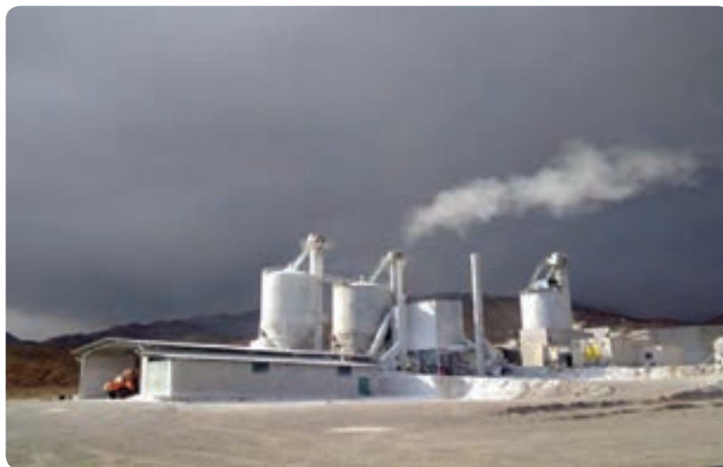
شکل ۴۷-۱- یکی از کارخانه‌های گچ در استان سمنان