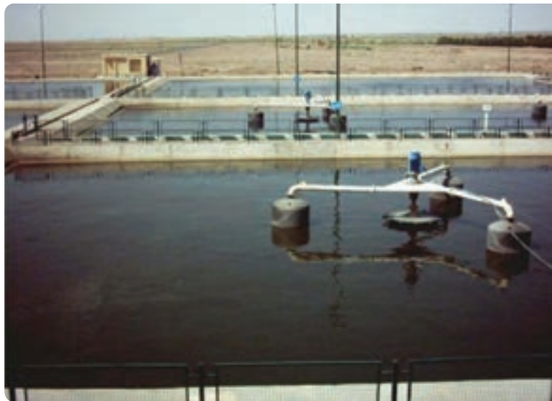
شکل ۴۹-۱. یکی از تصفیه‌خانه‌های فاضلاب شهرک‌های صنعتی استان