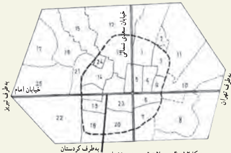
شکل ۱۲-۴- محلات قدیمی شهر زنجان