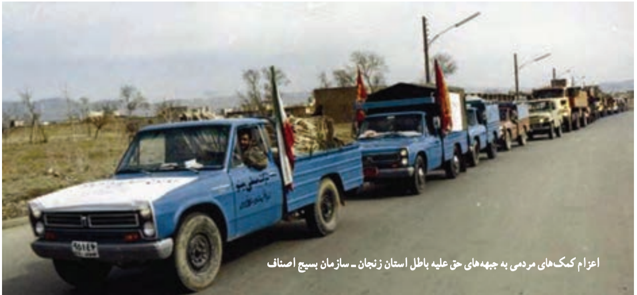
اعزام کمک‌های مردمی به جبهه‌های حق علیه باطل استان زنجان - سازمان بسیج اصناف