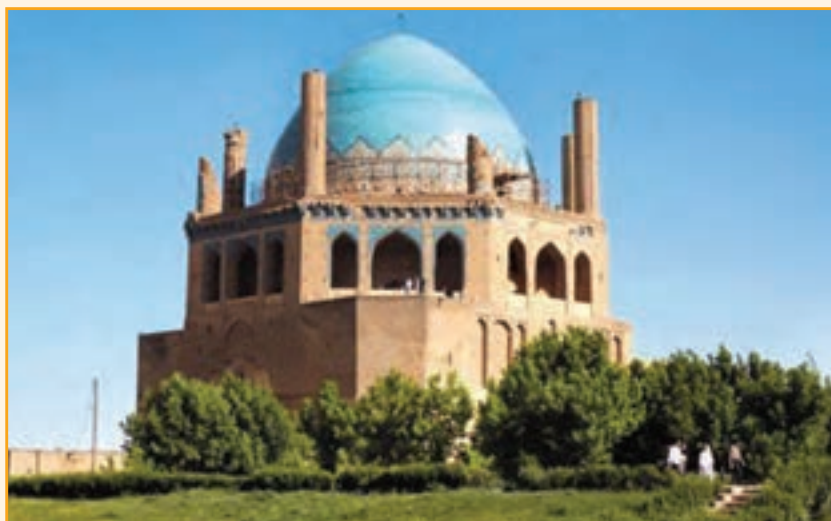
شکل ۱۳-۴- گنبد عظیم سلطانیه

در آن سرزمین وسیع در مدت ده سال بناهای سلطنتی و حکومتی، مساجد، خانقاه‌ها، داروخانه، حمام، کتابخانه، بازار، دکان‌ها و کارگاه‌های صنایع دستی و مراکز رفاهی چون کاروانسراها و آب‌انبارها و غیره را پدید آوردند. هر یک از بناها به گفته شاهدان به بهترین نوع هنری و ذوقی مزین به باغ‌ها و بوستان‌ها و چشمه‌ها و جویبارها در شهر جدید ایجاد شد.