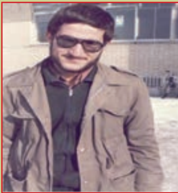
شهید حمید احدی فرمانده گردان