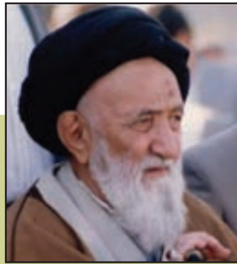
شکل ۱۸-۴- مرحوم آیت الله موسوی زنجانی