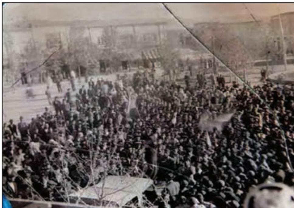
شکل ۹-۴- تصویری منحصر به فرد از حمایت مردم استان از نهضت ملی شدن نفت

لازم به ذکر است مردم استان بنا به شواهد موجود، در نهضت ملی شدن نفت ایران نیز حضوری همه‌جانبه و پرشور داشته‌اند.