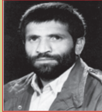
شهید میرزا علی رستم خانی فرمانده تیپ ۱ لشکر ۳۱ عاشورا