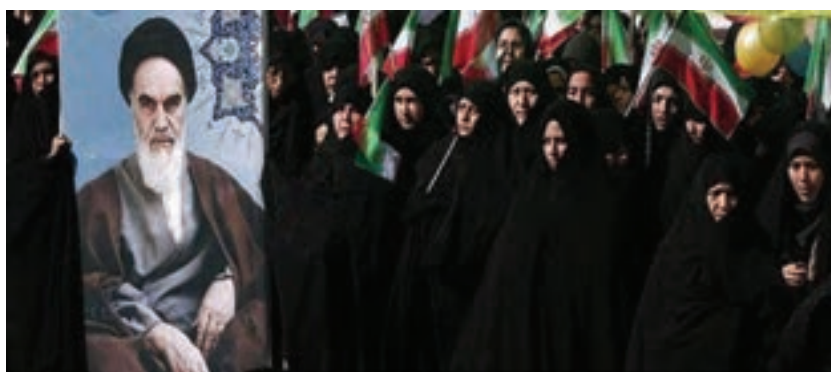
شکل ۱۰-۴- زنان در استان زنجان در پیروزی انقلاب نقش به‌سزایی داشتند