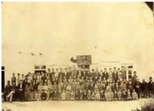
شکل ۸-۴- تصاویری از اولین مدارس استان