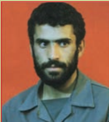
شهید کمال قشمی معاون گردان امام حسین (ع)