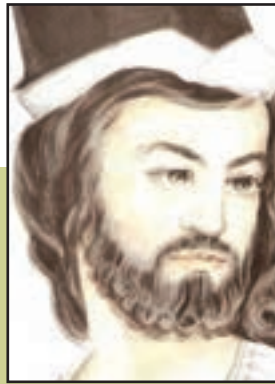
شکل ۱۷-۴- سهروردی (شیخ اشراق)