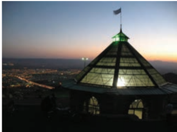
شکل ۲۷-۴- مزار شهدای گمنام

تیپ ۲ زرهی ارتش جمهوری اسلامی ایران از استان زنجان، با شرکت در عملیات‌های متعدد و رزم آفرینی و دفاع از کیان اسلامی و مستقر در غرب و جنوب کشور در طول جنگ به وظایف محوله خود عمل کرده و شهدا، جانبازان و آزادگان زیادی تقدیم کرده است.