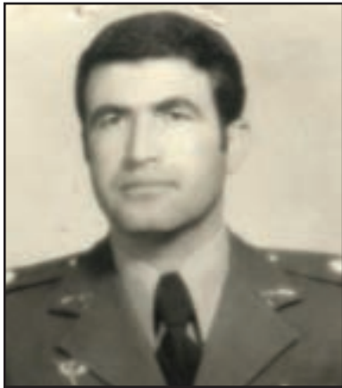
شکل ۲۶-۴- سرلشکر شهید مخبری