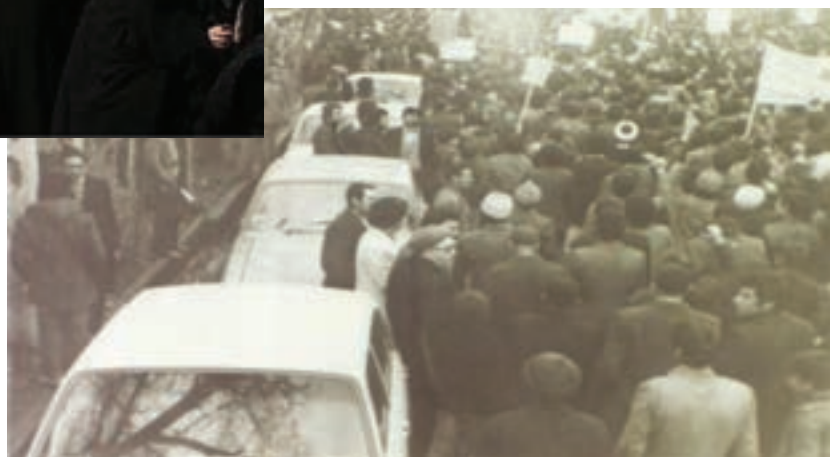
شکل ۱۱-۴- اولین تظاهرات علنی استان علیه رژیم