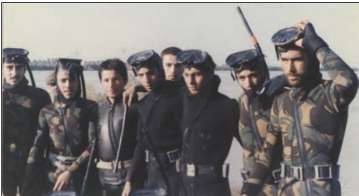
شکل ۲۳-۴- غواصان دریادل زنجان

مردم غیور و دلاور استان زنجان در طول ۸ سال دفاع مقدس، رشادتهای زیادی از خود نشان دادند از جمله رزمندگان این استان در عملیات‌های مختلف به‌عنوان خط‌شکنان معروف بودند. این استان در طول جنگ تحمیلی، شهدا، جانبازان و آزادگان بسیاری را تقدیم نظام جمهوری اسلامی کرده است.