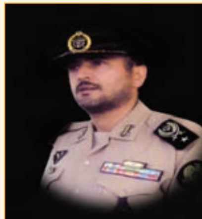
شکل ۲۵-۴- جانباز شهید امیر سرتیپ رحمان فروزنده

این استان با تقدیم ۳۰۰۰ شهید، ۶۳۶۰ جانباز و ۵۸۸ آزاده از کارنامه درخشانی در دفاع مقدس برخوردار است.