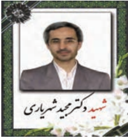
شکل ۱۵-۴- شهید دانشمند دکتر مجید شریاری

آیا در محل زندگی خود شخصیت‌هایی را می‌شناسید که به جدول ۲-۴- اضافه نمایید؟