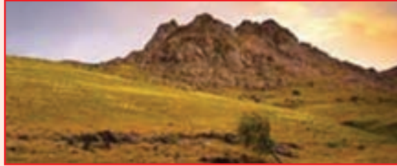
شکل ۱-۴- تپه خالصه خرمدره

سها چای تپه : این تپه تاریخی در شهرستان ایجرود و در مجاورت روستای سها و شیوه قرار دارد. تپه با توجه به قرار داشتن در محدوده سد گلابر، طی یک عملیات نجات بخشی توسط میراث فرهنگی استان زنجان مورد کاوش باستان شناسی قرار گرفت. این تپه تاریخی دارای آثاری از دوره مس و سنگ با تاریخ مطلق ۶۲۰۰ سال قبل است. آثار معماری روستایی شامل مقبره انسان‌ها با قطعات سفال، ابزارهای سنگی و پیکره‌های سفالی می‌باشد.