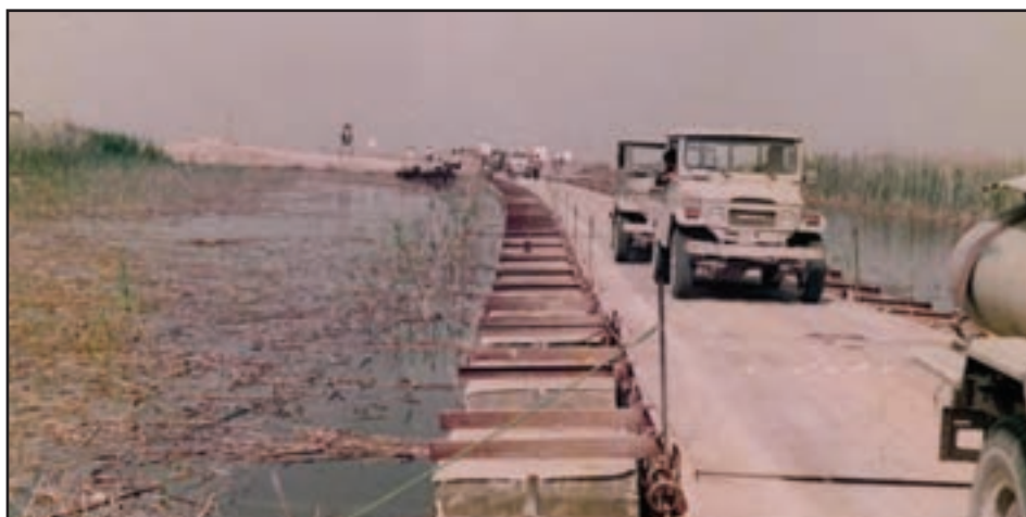
شکل ۲۸-۴- فعالیت جهادگران استان در دفاع مقدس