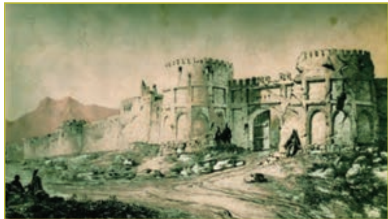
شکل ۷-۴- برج و باروی زنجان

همچنین در این دوره، این منطقه از نظر اقتصادی و فرهنگی و هنری دارای رونق چشمگیری بوده است. بیشتر آثار تاریخی و مذهبی استان زنجان، مانند: مساجد جامع قروه، سجاس، گلابر، کاروانسرای نیک بی، سرچم، آثار تاریخی سلطانیه، خدابنده و ابهر در این زمان ساخته شده اند.