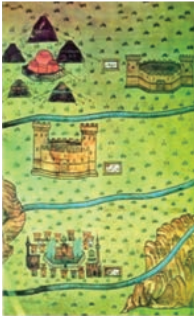
شکل ۶-۴- کاروان سرای سرچم

تا هنگام تسلط کامل سلجوقیان بر سرزمین ایران، زنجان نیز مانند دیگر شهرهای این منطقه، هرازگاهی در دست امیری بود، گاه زیدیان طبرستان و گاه آل بویه و گاه آل زیار بر آن حاکم می شدند.