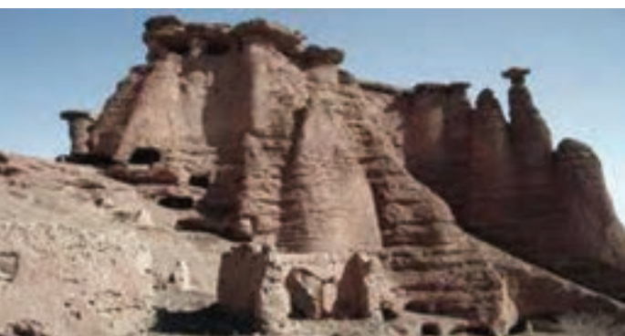
شکل ۳-۴- قلعه بهستان ماه نشان یکی از مراکز اولیه تاریخ