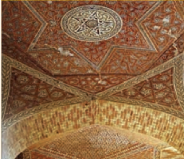
شکل ۱۴-۴- تزئینات معرق یکی از ایوان‌های گنبد سلطانیه

در کنار گنبد عظیم سلطانیه بناهای دیگری نیز احداث شده که شامل: معبد داش کسن، آرامگاه چلبی اوغلی و بقعه ملاحسن کاشی است.