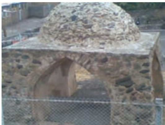
شکل ۴-۵- آتشکده الزین طارم

اگر قول مورخان در انتساب شهر زنجان به دوره ساسانی را بپذیریم، این شهر نیز در دوره ساسانی پایه‌ریزی شده است. همچنین وجود آتشکده‌های متعدد در مناطق مختلف استان در حدود یکصد سال پس از ورود اعراب به ایران که آثار برخی از آنان در شهرستان طارم باقی است تأییدکننده این مطلب است.