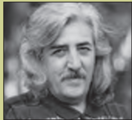
شکل ۲۰-۴- حسین منزوی - شاعر و غزل سرا