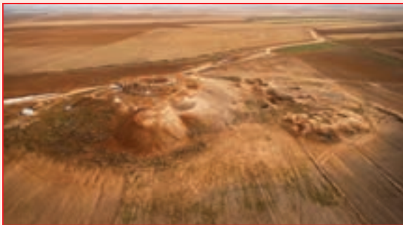
شکل ۲-۴- تپه نور سلطانیه

قرار دارد. دارای آثاری مربوط به چند دوره تاریخی است، قدیمی‌ترین آثار این تپه مربوط به دوره مفرغ (حدود ۵۰۰۰ سال قبل) است و همچنین در اینجا آثاری از دوره‌های آهن، اشکانی و ساسانی و دوران اسلامی نیز وجود دارد.